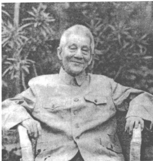
晚年的罗尔纲先生