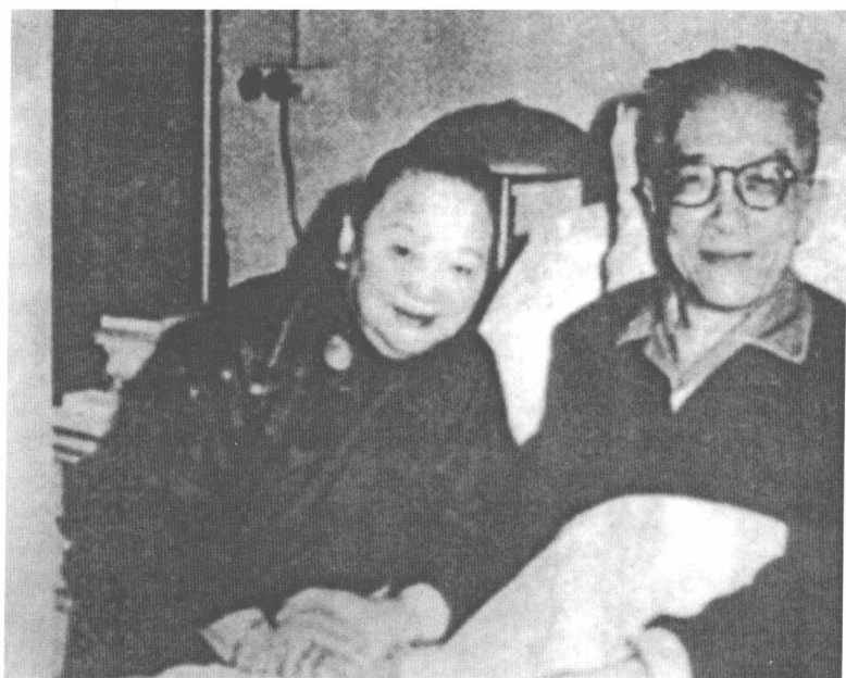
胡适与夫人江冬秀(1961)