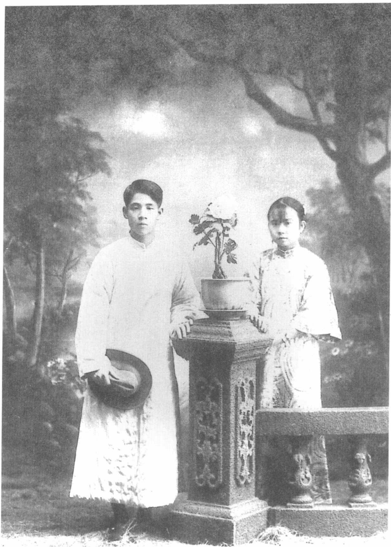
罗尔纲与陈婉芬新婚照(1927)