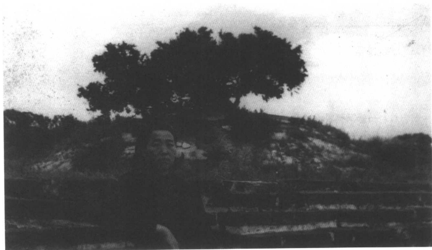
劉志丹夫人同桂榮在西安