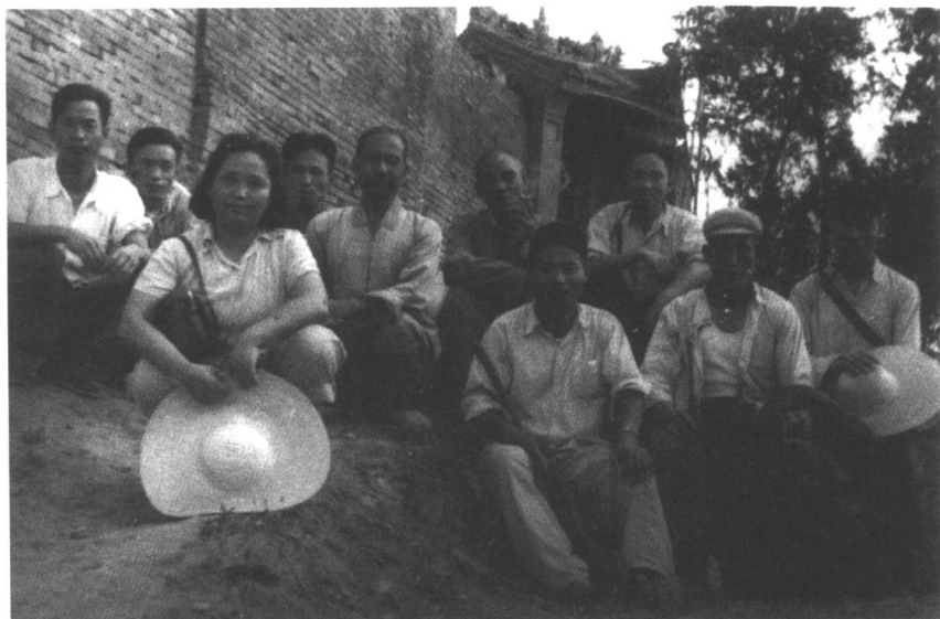
1960年李建彤陝北照金與群眾合影