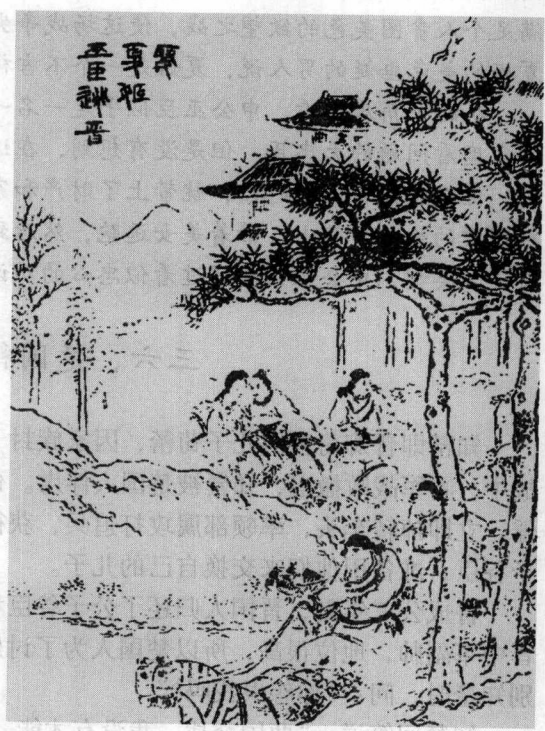
《东周列国志》版画之“娶夏姬巫臣逃晋”图