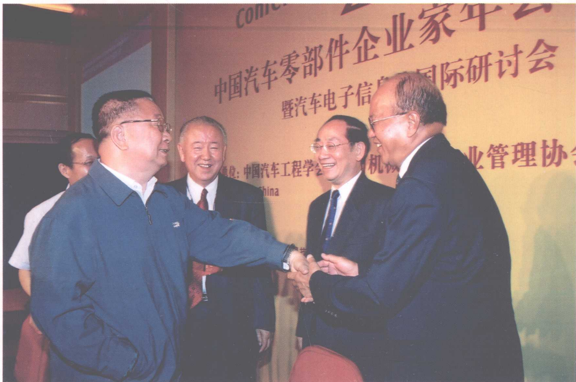
出席 2004 中国汽车零部件企业家年会的部分领导在亲切交谈