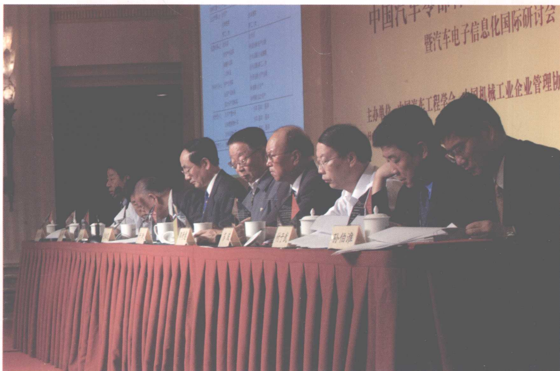
出席2004中国汽车零部件企业家年会有关领导