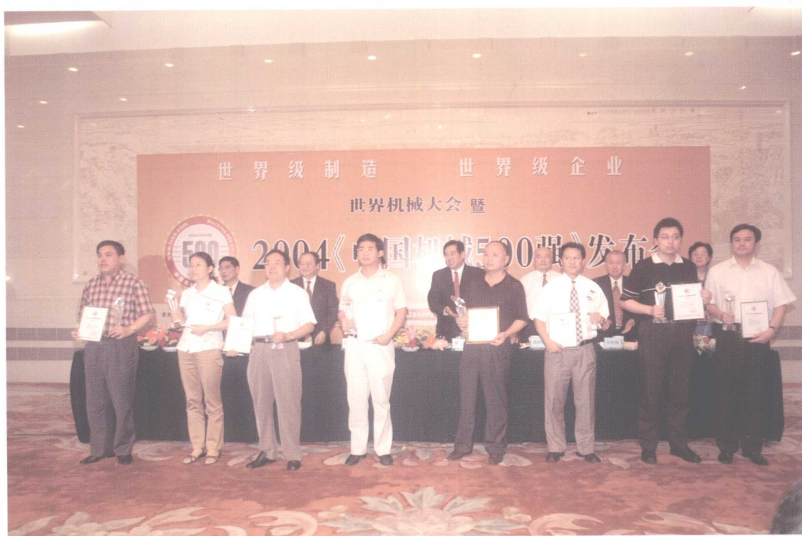
2004《中国机械 500 强》颁奖现场