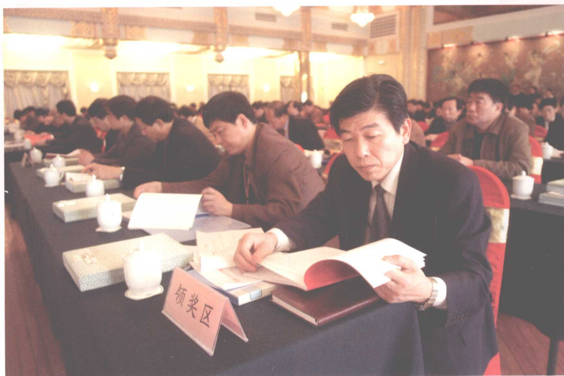
中国机械工业企业管理协会一届三次理事(扩大)会议上的主题发言现场