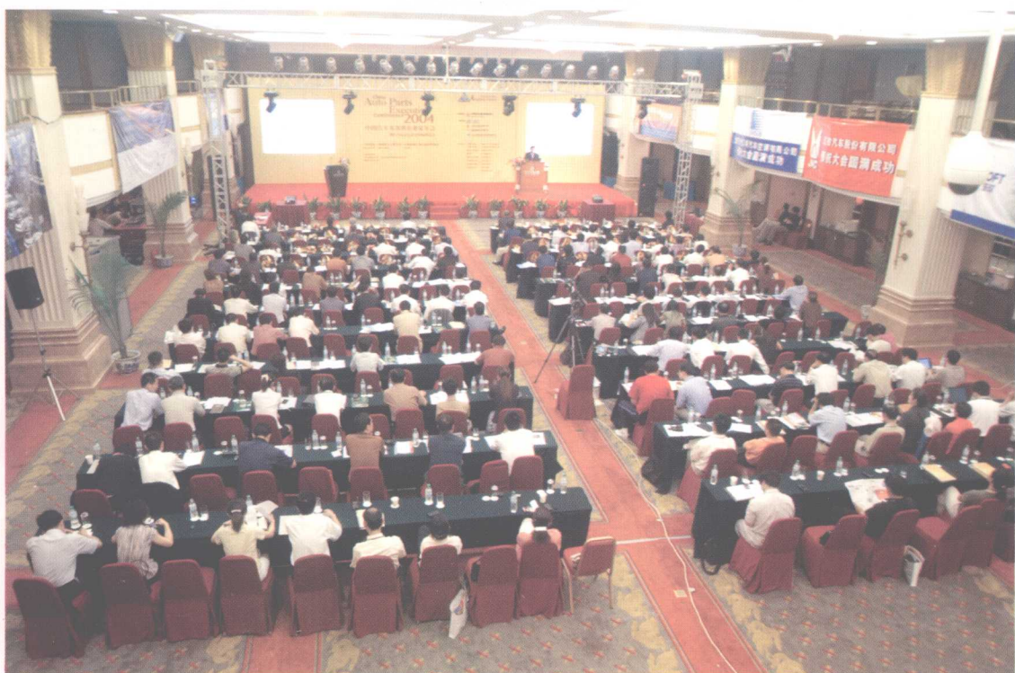
2004中国汽车零部件企业家年会现场