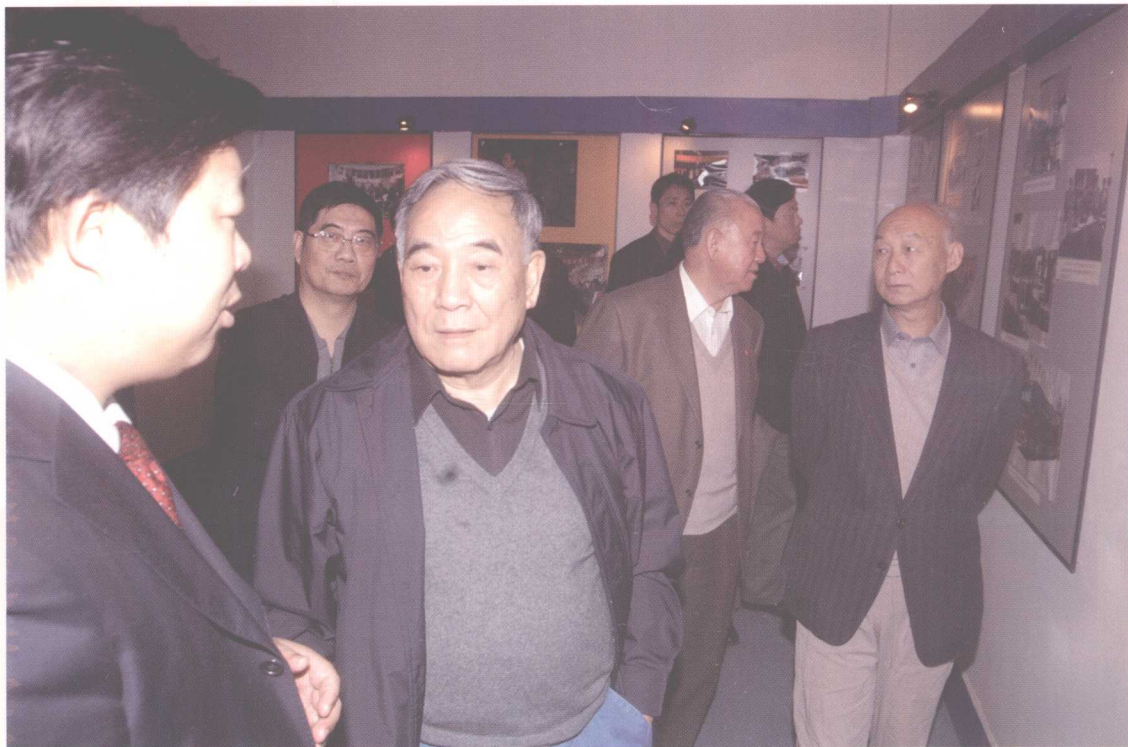
参加中国西部重型汽车发展高峰论坛的有关领导正在参观陕汽重型汽车展览室