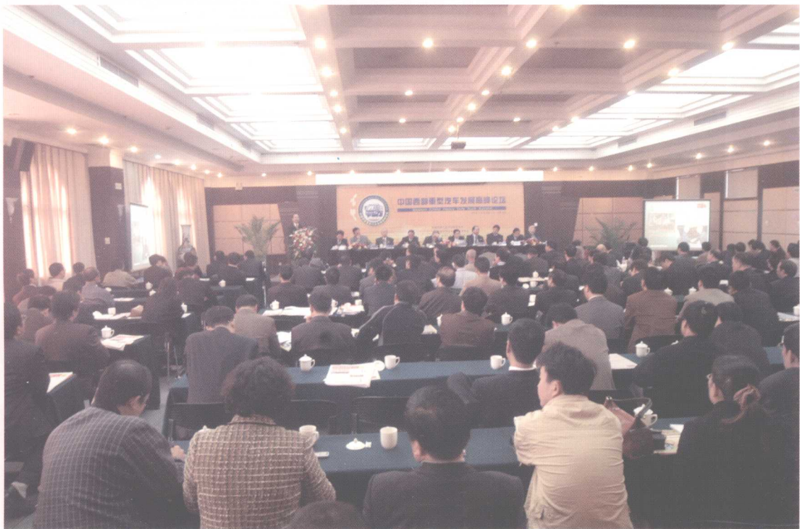
中国西部重型汽车发展高峰论坛会议现场