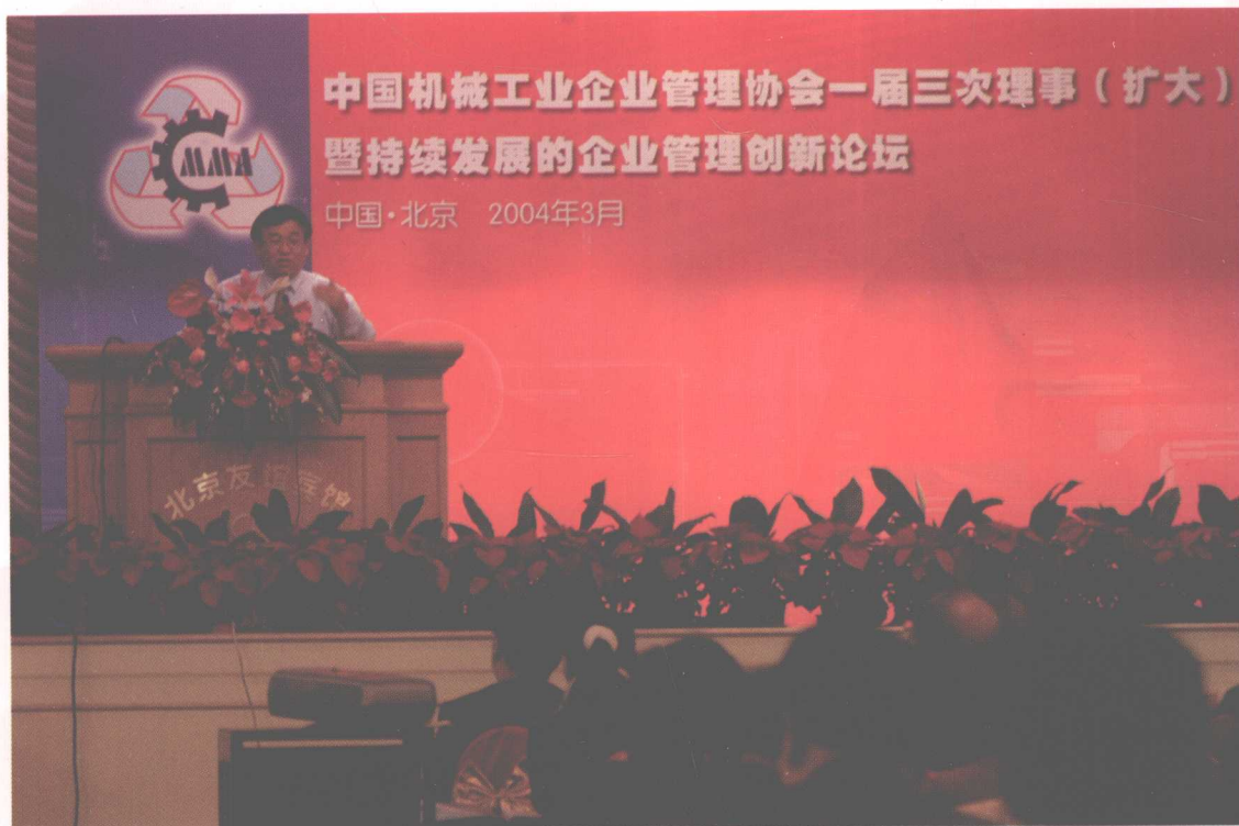
有关专家、学者在中国机械工业企业管理协会 一届三次理事(扩大)会议上作主题发言