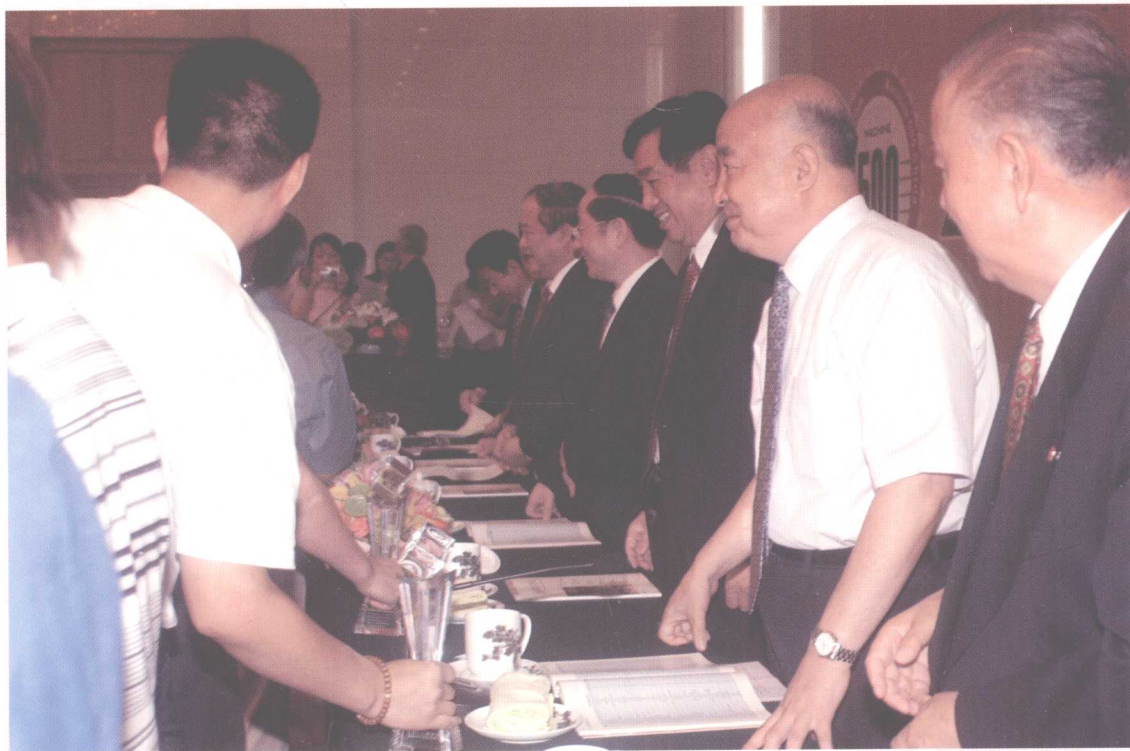
有关领导为入选 2004《中国机械 500 强》的企业颁奖