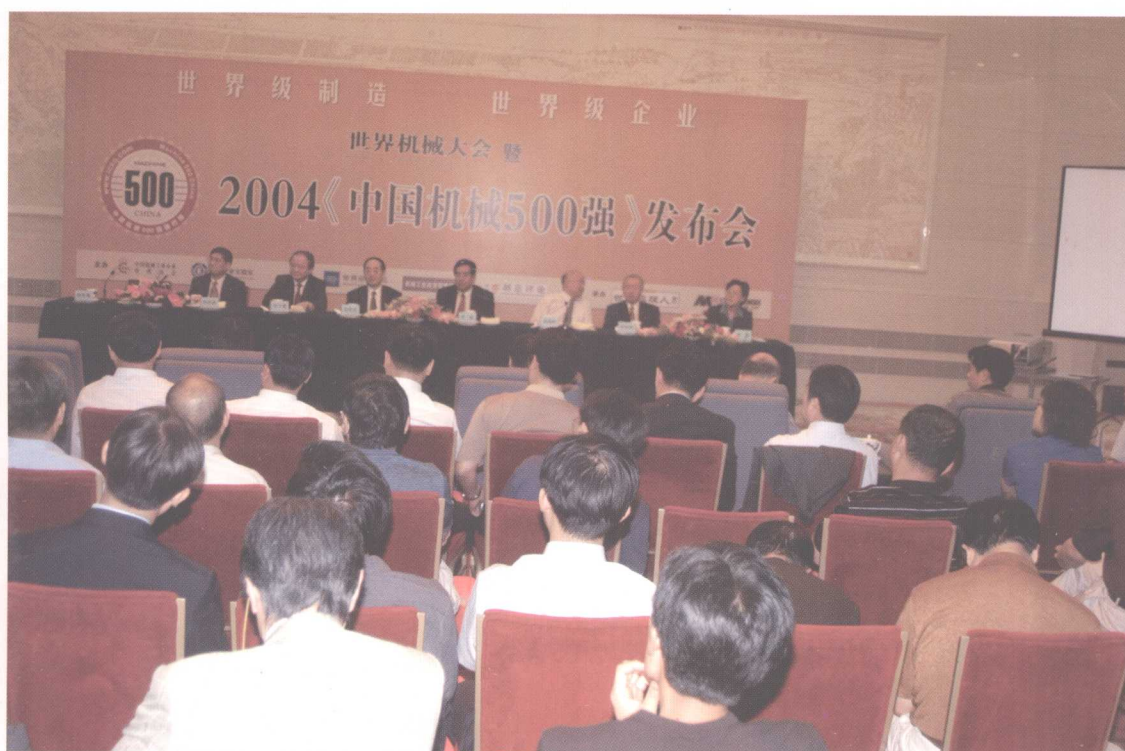
2004《中国机械500强》发布会现场