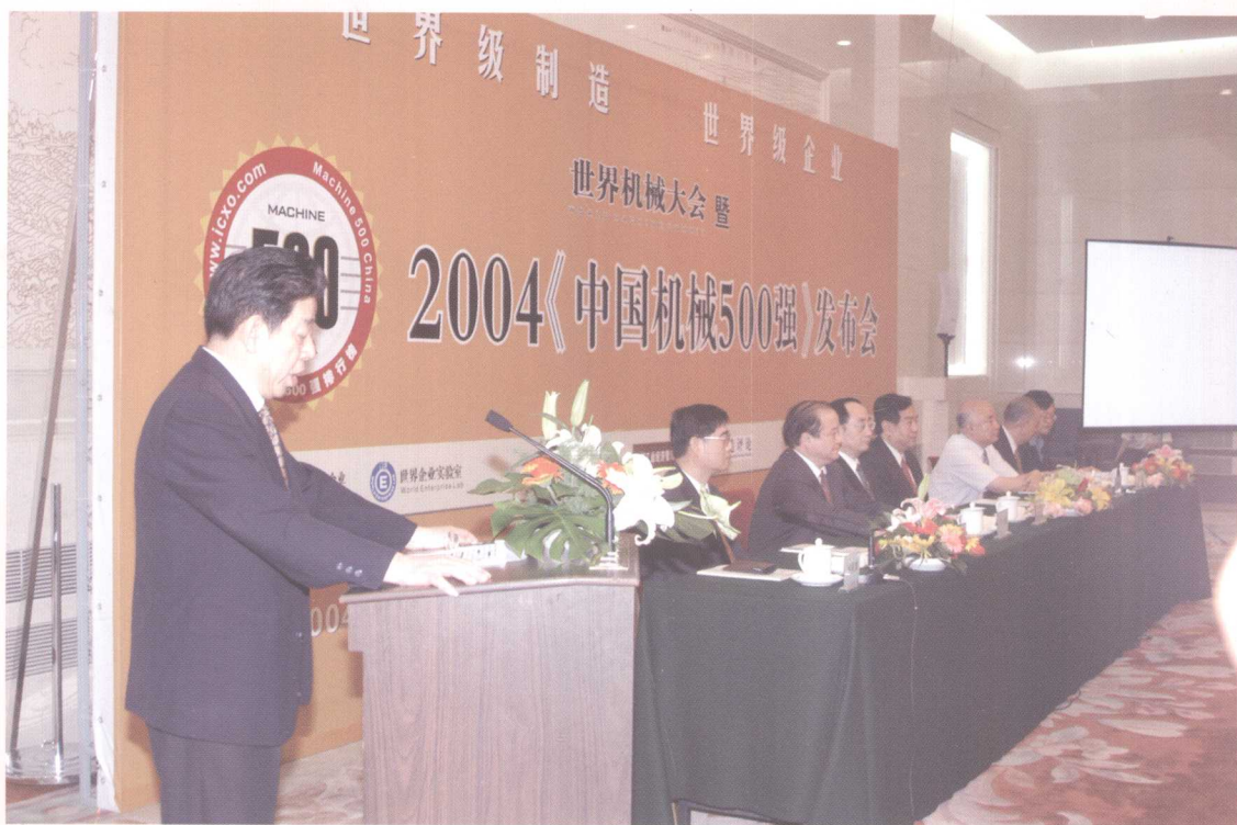
出席2004《中国机械500强》发布会的有关领导