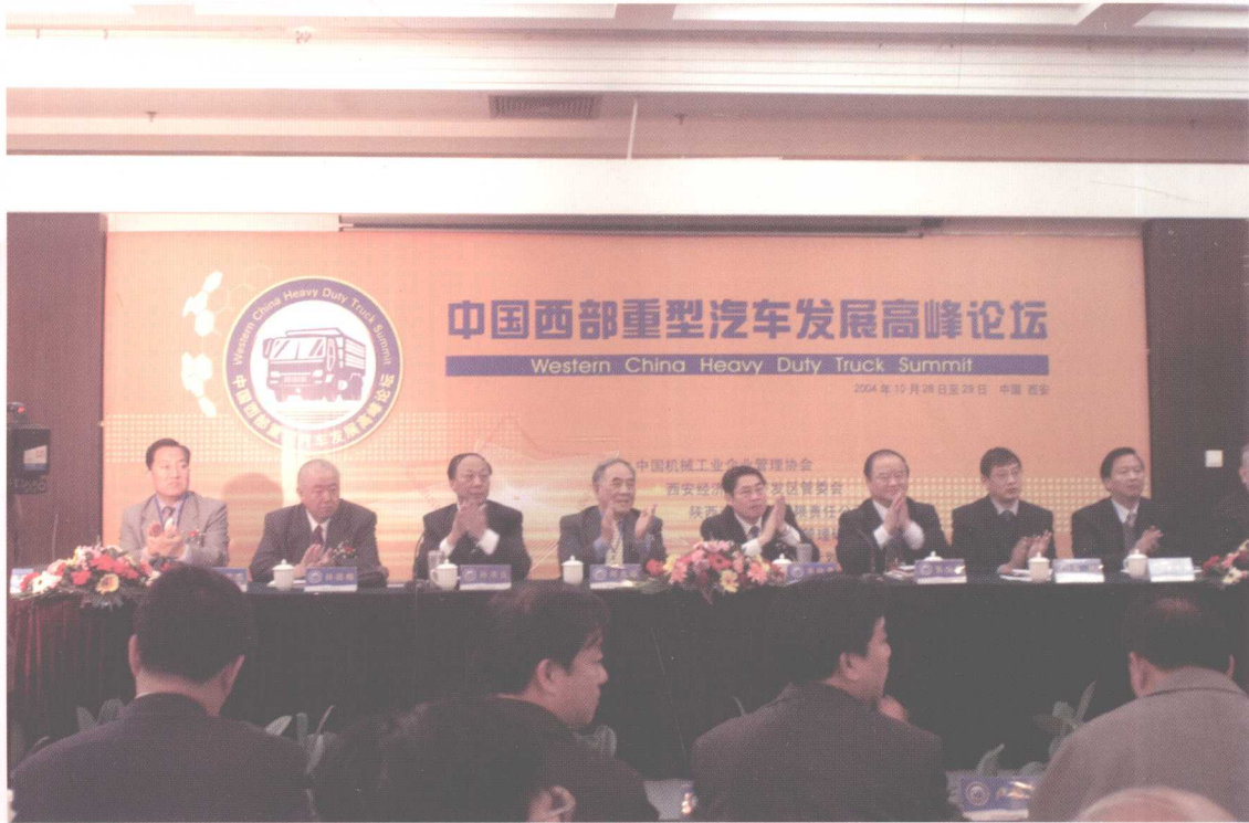
出席中国西部重型汽车发展高峰论坛的有关领导