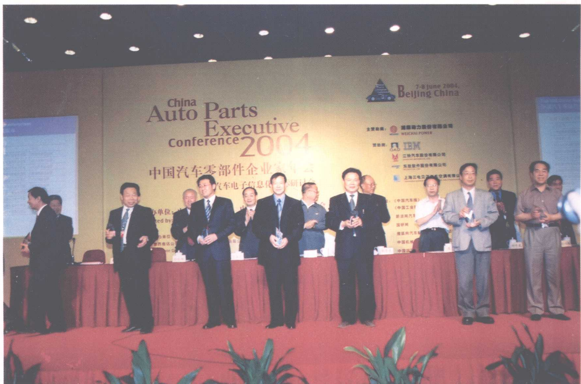
“2004 年度中国汽车零部件企业综合竞争力 100 强暨十大金牌企业”颁奖现场