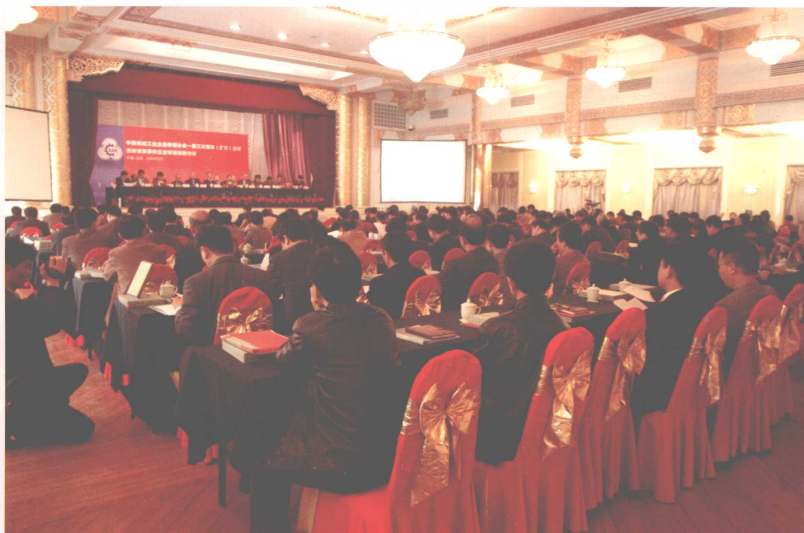
中国机械工业企业管理协会一届三次理事（扩大）会议现场