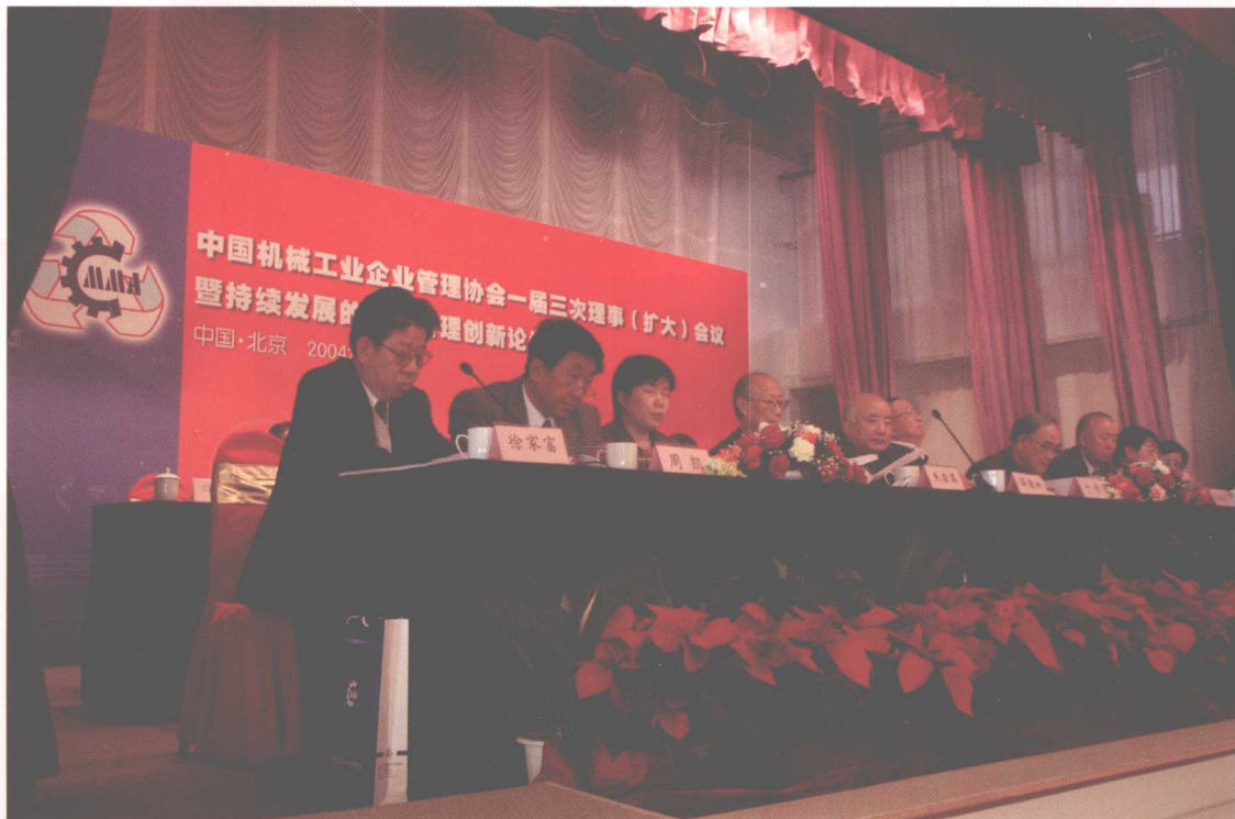
出席中国机械工业企业管理协会一届三次理事（扩大）会议的有关领导