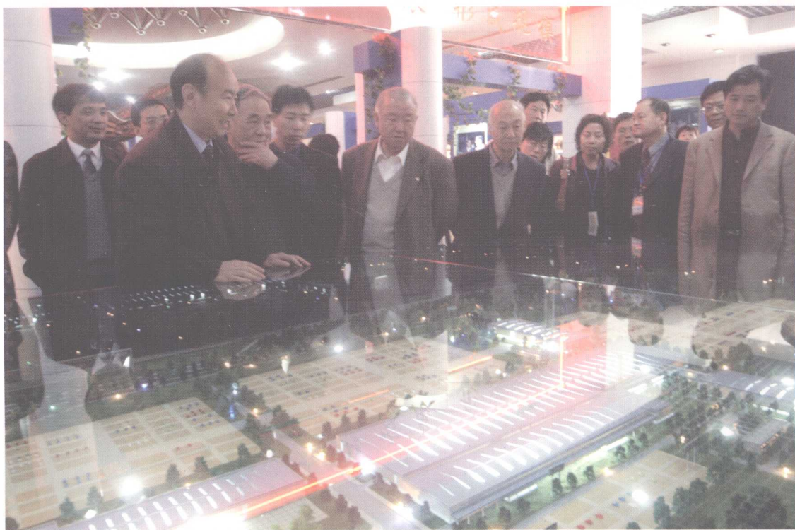
参加中国西部重型汽车发展高峰论坛的有关领导和代表们 正在参观建设中的陕汽重型汽车生产基地模型