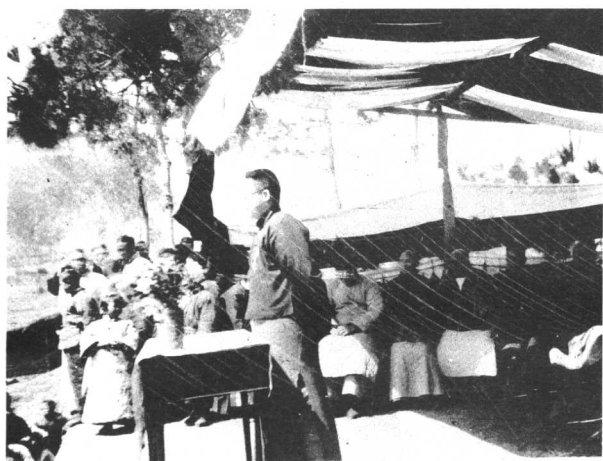
1928年3月15日晓庄学校隆重举行周年纪念大会。图为陶行知在纪念会上讲话