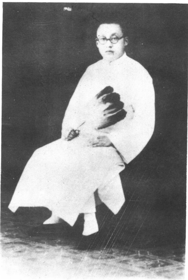
30年代陶行知在上海留影