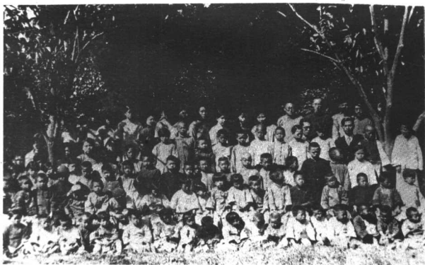
1932年，上海徐家角工学团开学合影（后排右四是陶行知）