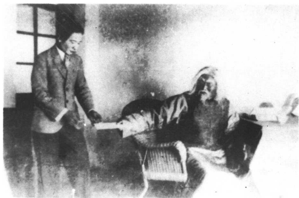
1929年1月，晓庄剧社成立，陶行知为社长。图为在《生之意志》中陶行知饰老父，谢纬声（宋晖）饰儿子