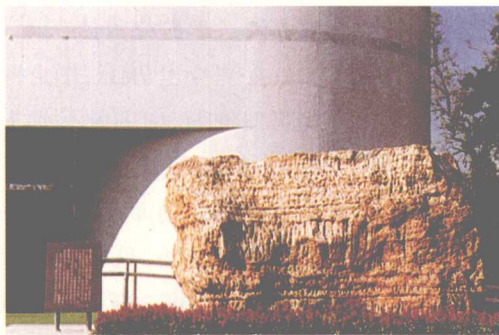
■ 天津自然博物馆门前距今10.5亿年、重达19.8吨的蓟县中上元古界叠层石。

蓟县中上元古界地层剖面就像一部万卷史书,讲述着地球地质古地质的变化、古河流的变迁、古生物的变异。距今约18亿年前,蓟县地区的地壳下降导致海水入侵,形成海洋环境。此后,这一地区的地壳又发生了上升运动,使沉积的地层露出了海面,加之构造运动,沧海变成桑田,于是就出现了当今蓟县剖面的地貌。在距今14亿至12亿年的岩层中,发现了世界罕见的微生物群,大大提前了此种微生物的出现年代。该地层剖面贮存着反映当时的古地理、古生物、古气候、古构造、古地磁等