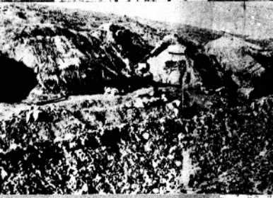
揭露日寇暴力统治的 报纸资料