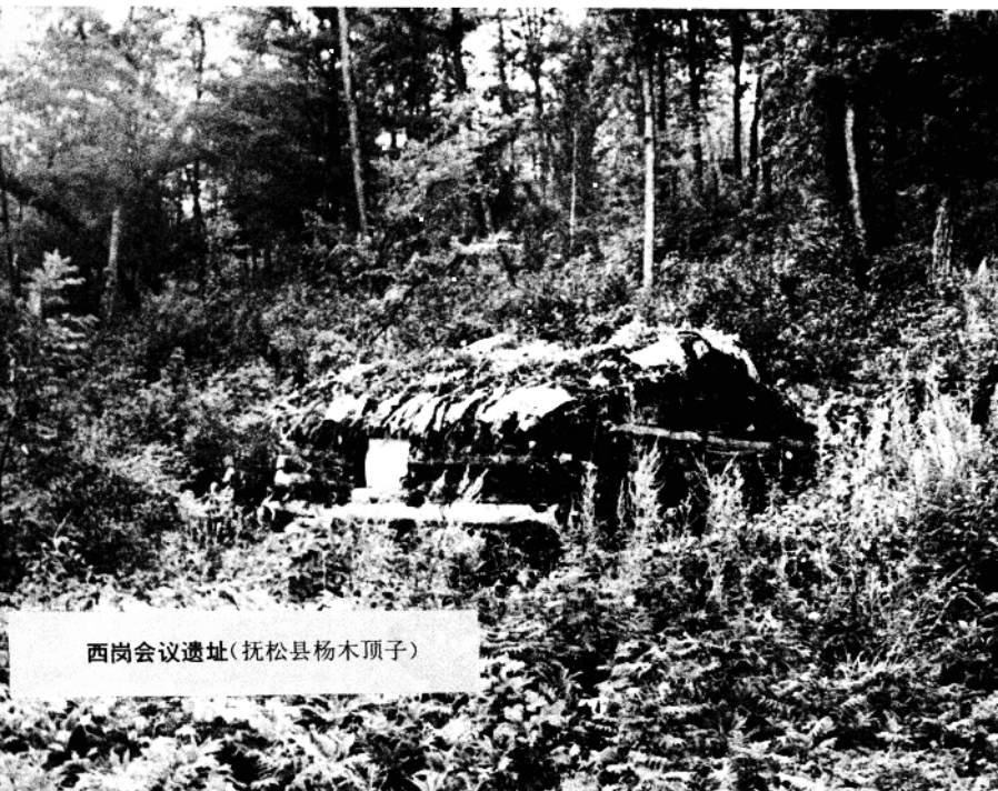
西岗会议遗址(抚松县杨木顶子)