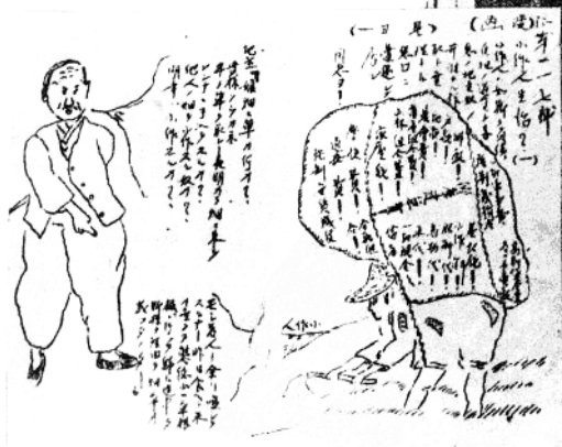
揭露日寇和地主阶级残酷剥削人民的漫画