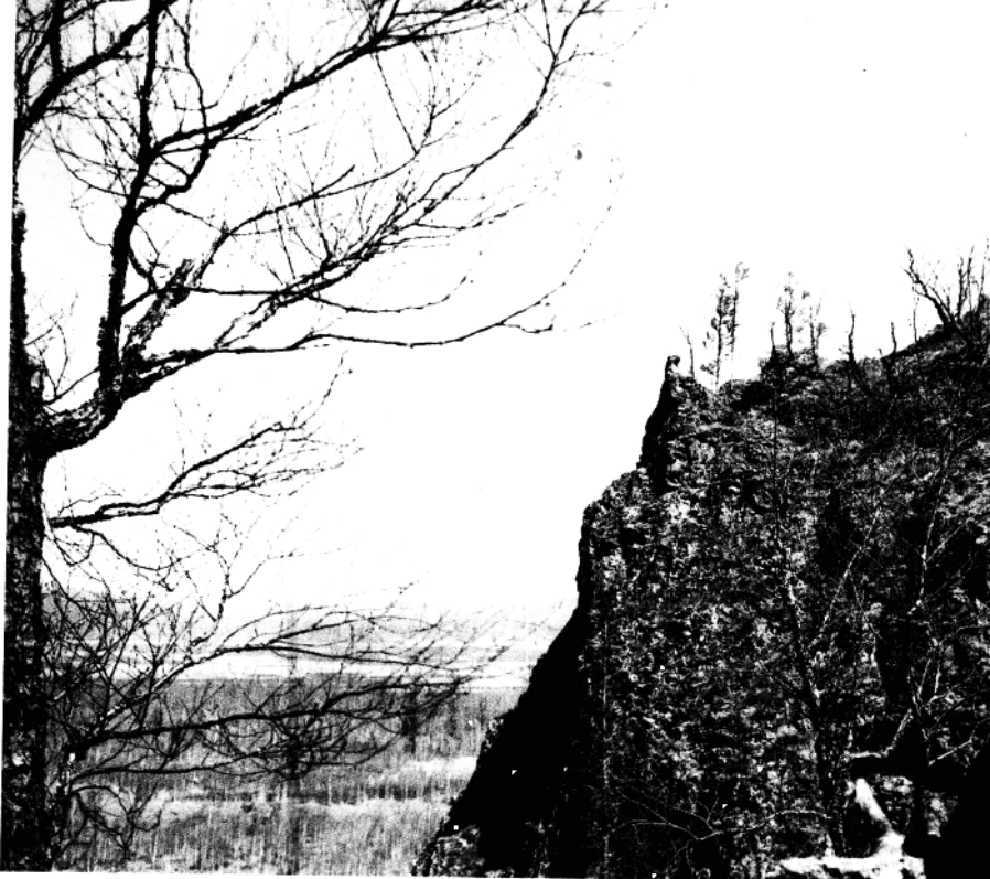
红岩战斗时的战场