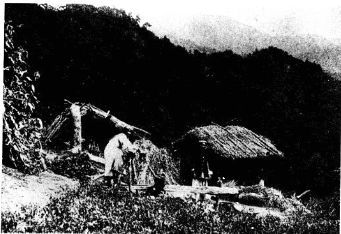
北部地区火田 民的生活