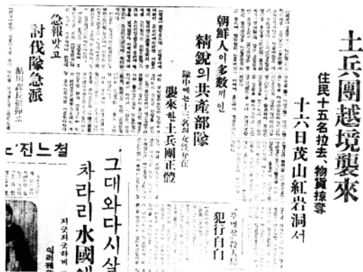
《朝鮮日報》登載的 有关红岩战斗的消息 (1937. 5. 20)