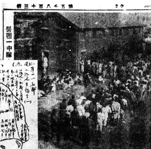
失业工人彷徨街头