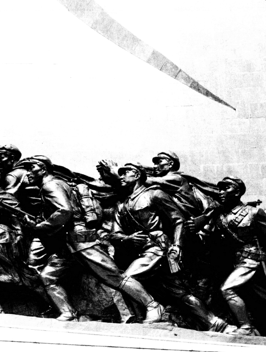
普天堡战斗胜利纪念塔的一部分雕像