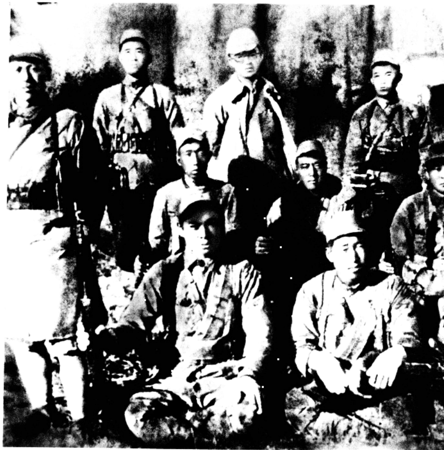
和警卫队员们在一起