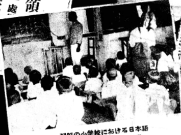
朝鮮の小学校における日本語教授の状況と日本語教科書