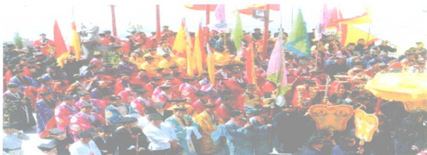
声势浩大的罗天大醮