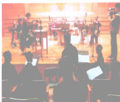
道教科仪音乐录制