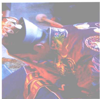
科仪中的高功默朝仪式