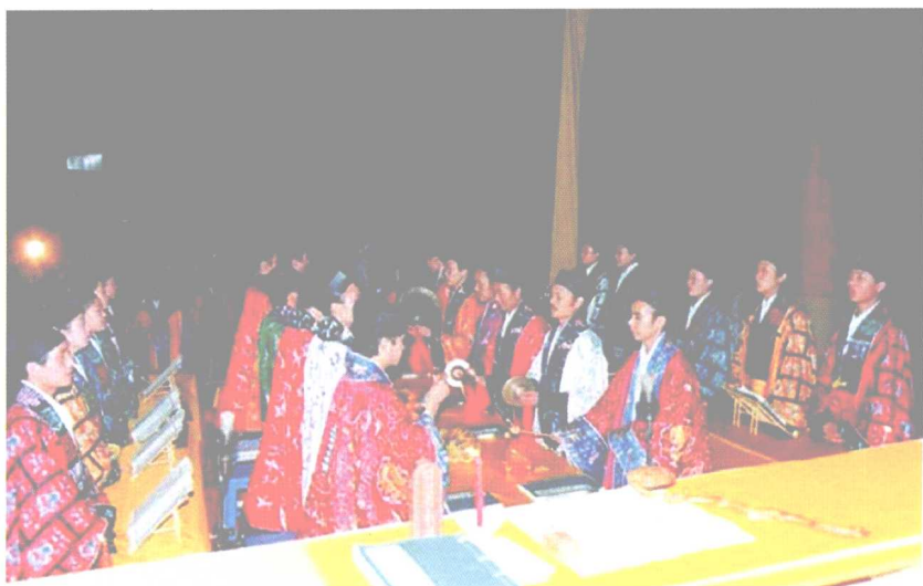
九座高功大焰口台