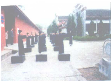
正在教习高功威仪