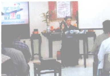
在香港道教学院讲学