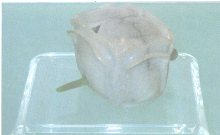
宋代高功在科仪中所用的莲花冠