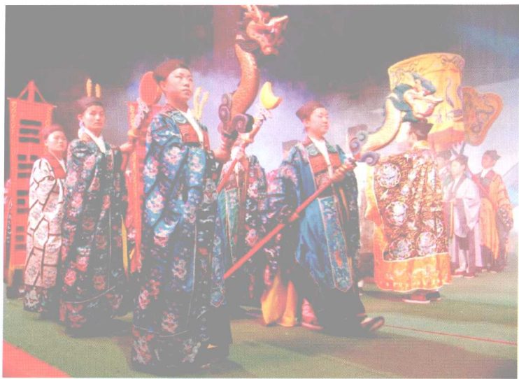
科仪中所用的仪仗