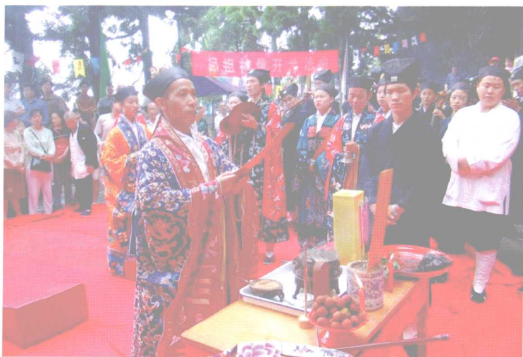
本书作者在庐山仙人洞主持开光大典