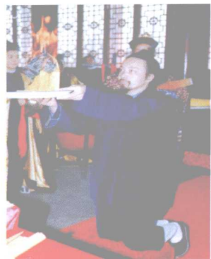
科仪中的化表仪式