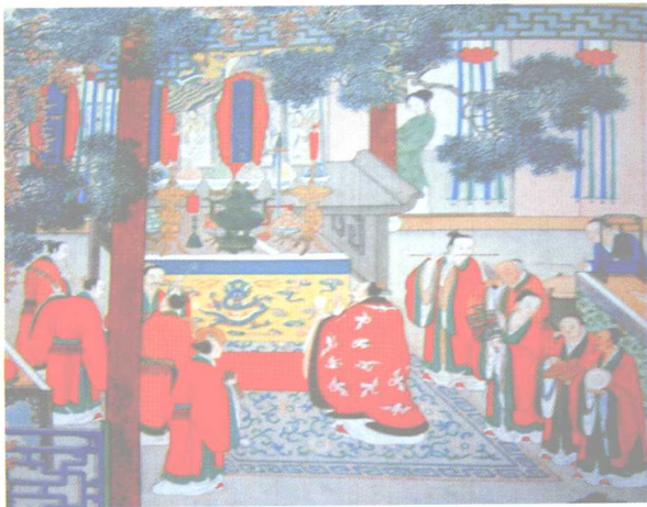
《金瓶梅》中记 载的道场科仪图片