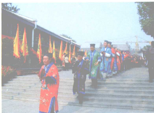
武汉正一派道士的朝谢仪式