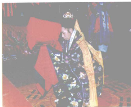
《大表》科仪佩 符拜表谒帝仪式