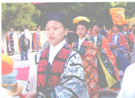
戒坛迎请方丈入院科仪