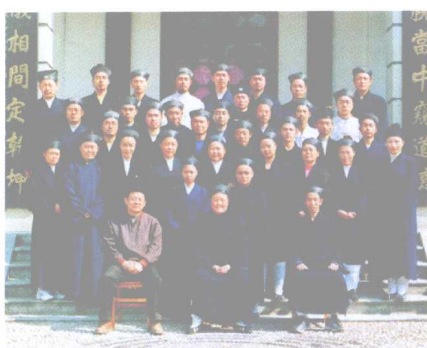
道教高功音乐学习班毕业留念