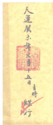
全真道教所用《生天宝箓》以及《城隍牒文》封皮正反书写格式