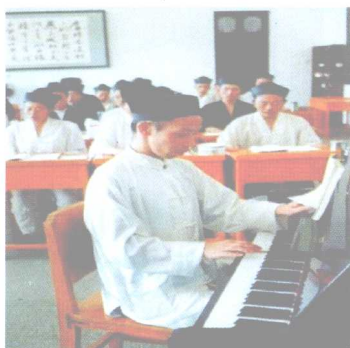
正在教习道教音乐