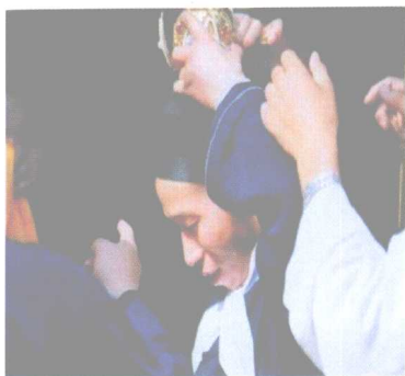
斋醮前的忙碌穿戴