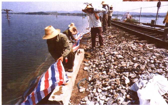
在险情区段筑起防护带