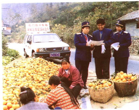
深入现场揽货源,铁路营销新气象