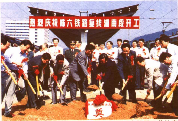
1998年5月25日，株六铁路复线湖南段开工典礼在怀化站举行