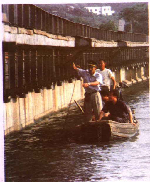
定时检测桥梁设备