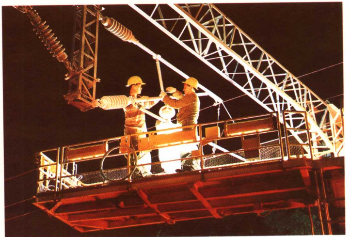
广深电气化铁路施工现场