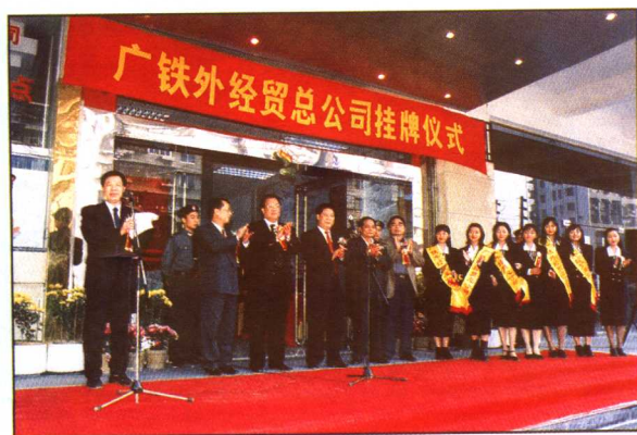
1998年12月31日,广铁外经贸发展总公司成立