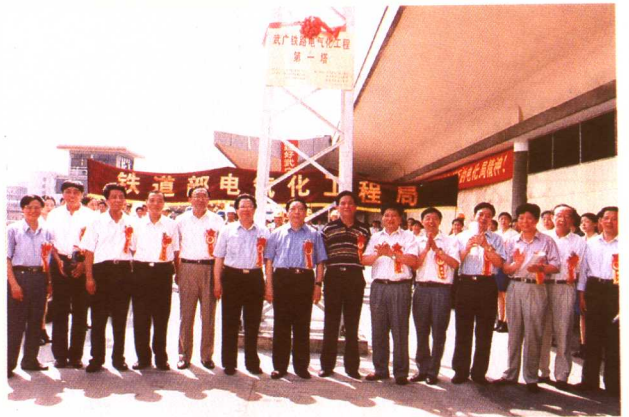
1998年6月28日，武广电气化铁路第一塔竖立在广州站一站台北头