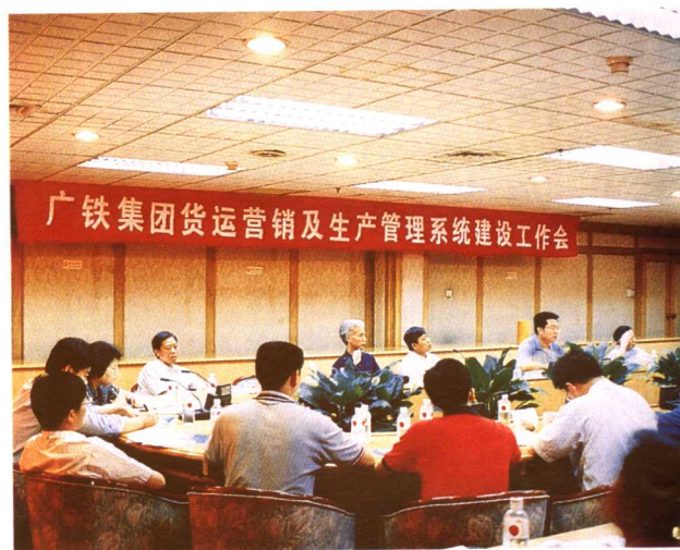
营销工作会议