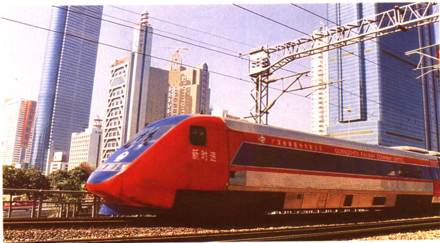
「新时速」列车行驶在深圳特区