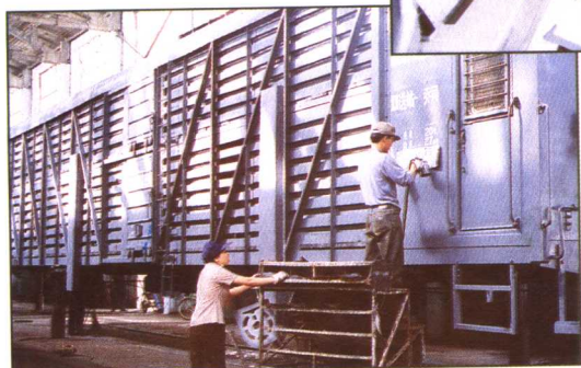
部家畜车定点厂修生产基地