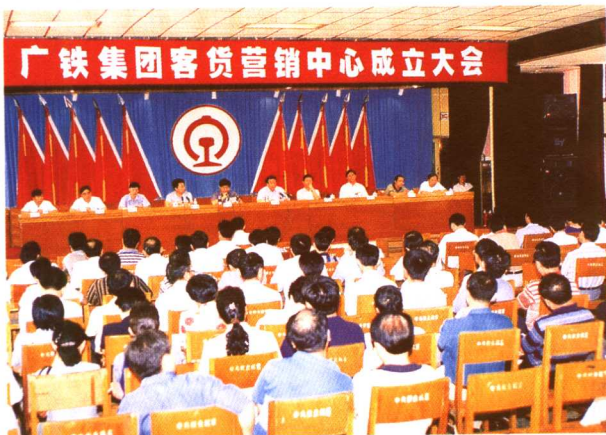
1998年7月21日,客货营销中心成立