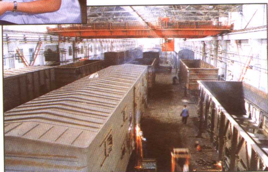
繁忙的货车检修库

衡 阳车辆段位于京广线与湘桂线的交汇处，是湘南地区较大的铁路客、货车辆检修混合段。现有职工2020人，14个生产车间，共有配属客车527辆，担负着20趟旅客列车的检修任务。年均完成铁路货车检修1.5万辆，运用车检修近700万辆，同时也是部家畜车厂修的生产基地。