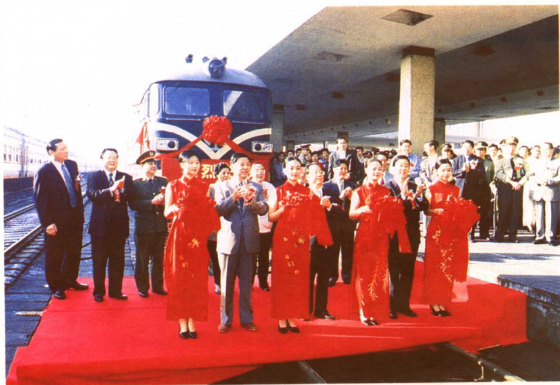
1998年10月16日,石长铁路全线通车