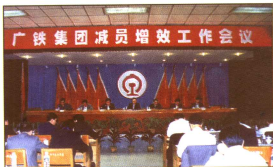
1998年3月25~26日,广铁集团减员增效工作会议召开