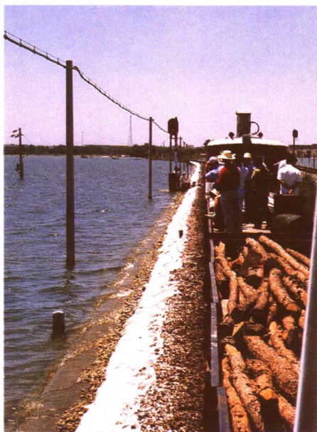
用轨道车紧急运送抗洪救灾物资