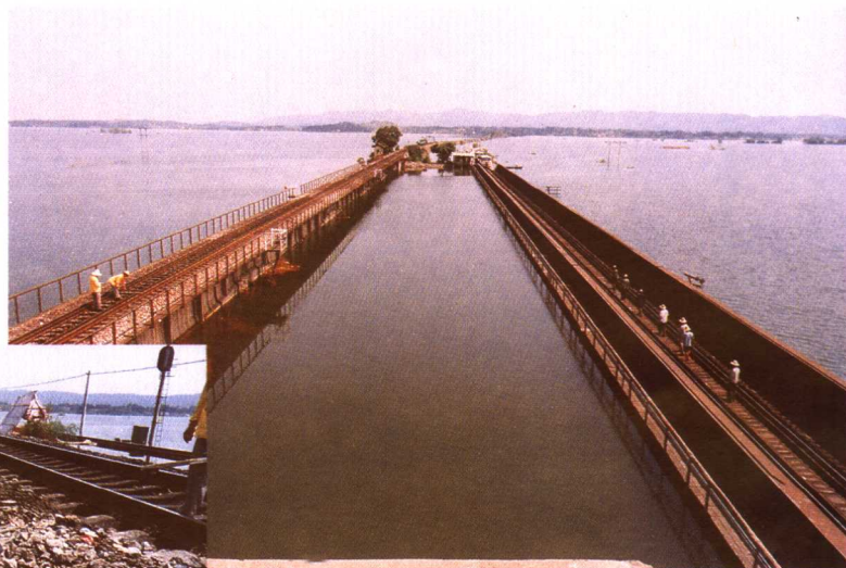
经历八次洪峰考验的破塘口大桥安然无恙