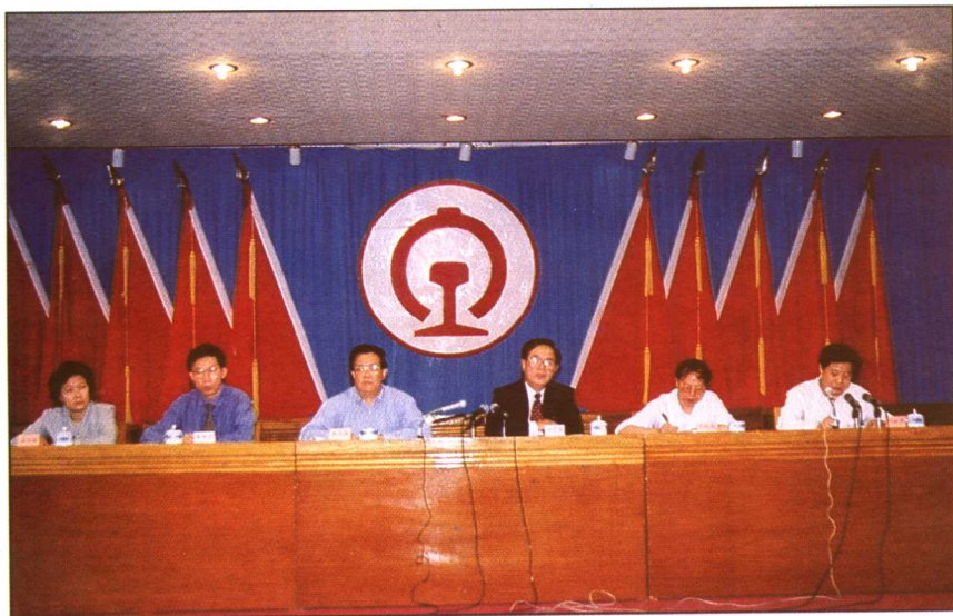
1998年4月10日,铁道部党组书记、部长傅志寰宣布调整广铁集团领导班子,任命张正清为董事长、总经理,党委书记江林洋兼副董事长