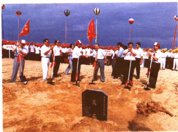
1998年8月30日,粤海铁路通道工程开工奠基 (重点办 供稿)