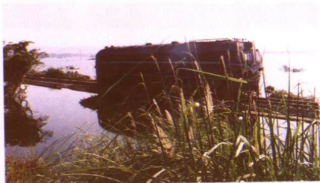
机车在荣家湾与麻塘间压道