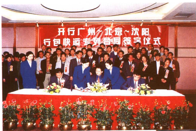
1998年3月18日,全路首列行包广州~北京~沈阳直达快运专列开行。上图为合同签字仪式,右图为开行情形