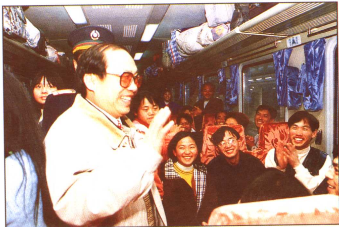
铁道部领导刘志军向旅客做安抚解释工作