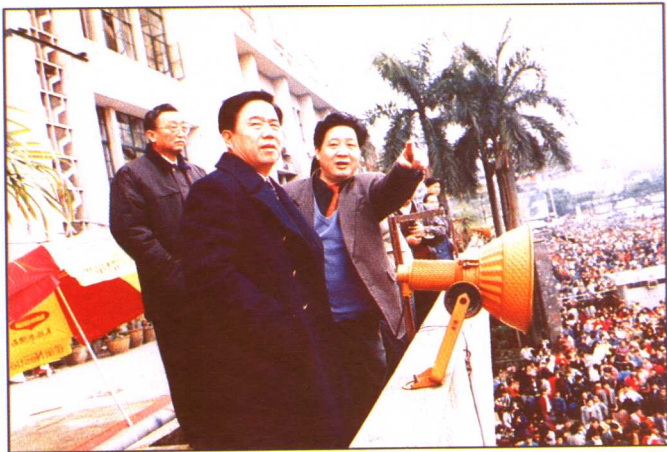
铁道部领导傅志寰、华茂昆在集团公司党委书记江林洋陪同下亲临广州站指挥春运