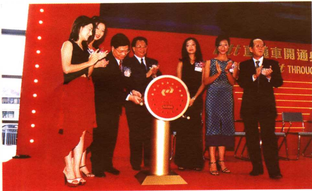
与新时速同时投入广九间运营的九广铁路公司“Kit”双层电气化列车开通典礼在香港九龙红磡火车站举行