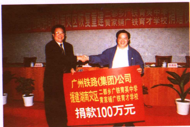
集团公司捐资百万援建灾区两学校