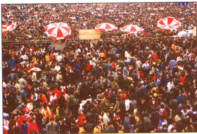
春运旅客发送量创 1527 万人的历史最高纪录