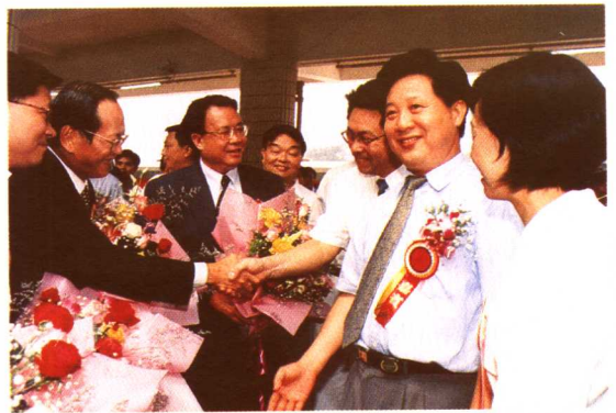
广铁集团公司领导欢迎香港九广铁路公司 主席杨启彦一行