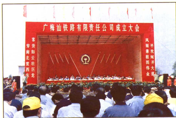
1998年9月26日,广梅汕铁路改制为有限责任公司