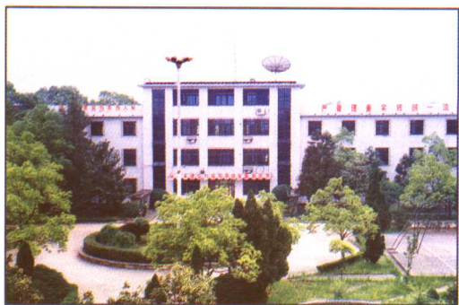
环境优美的公司大院

怀 化铁路总公司线路工程公司始建于1976年7月，主要担负湖南境内湘黔铁路娄底至酒店塘、焦柳铁路西斋至牙屯堡线路大中修任务，拥有固定资产2500多万元，下设四个施工队、一个二级维修厂、三个大修机械化施工基地，具有年完成铁路线路大中修70~100KM、外委工程5000万元左右的生产能力，年生产总值逾亿元，实现利税600多万元。