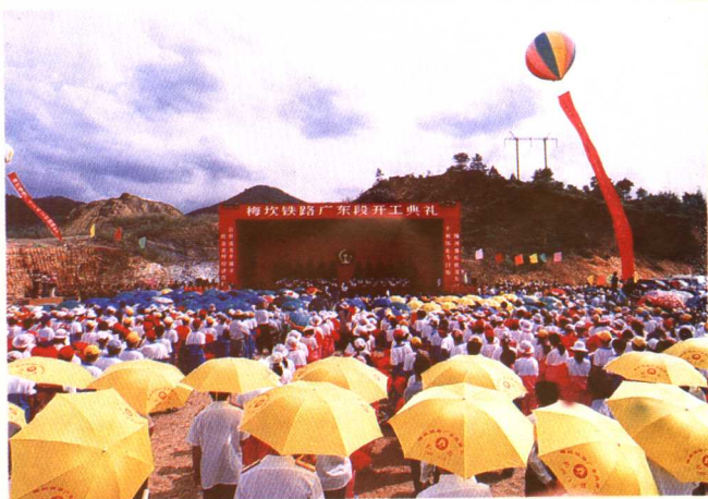
1998年4月8日,梅坎铁路广东段开工典礼