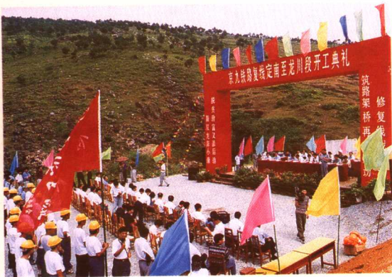
1998年8月29日，京九铁路复线定南至龙川段开工