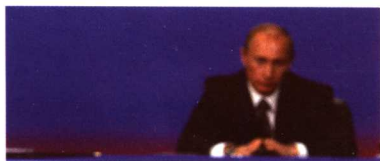
总统普京听取第一副总理梅德韦杰夫 在统一俄罗斯党代表大会上的讲话 (2007年12月17日)