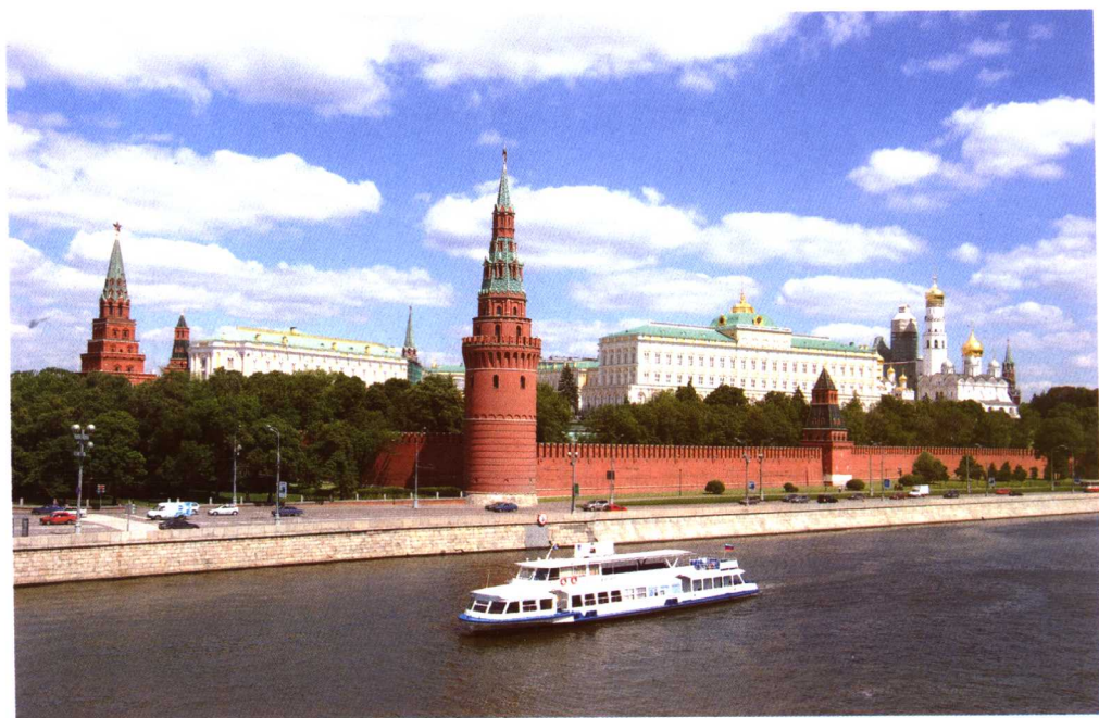
克里姆林宫是一个庞大的俄式建筑群，主要建于14—17世纪，俄罗斯联邦总统官邸所在地