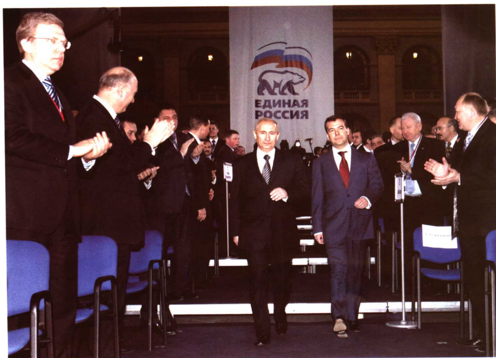
普京表示如梅德韦杰夫当选总统他准备出任总理（2007年12月18日）