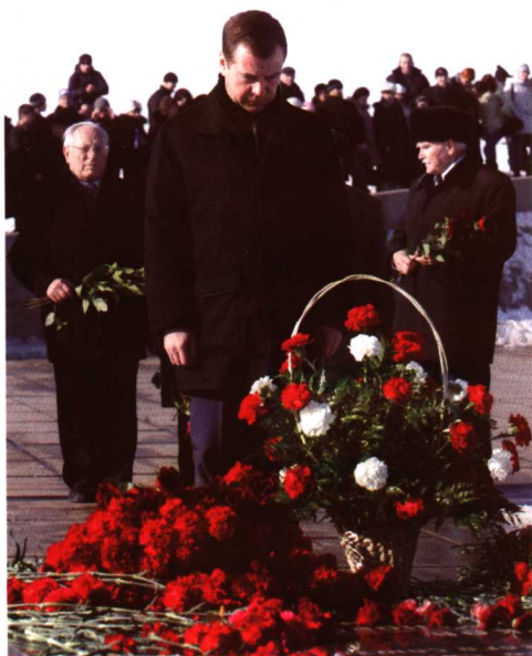
参加俄罗斯纪念斯大林格勒战役 胜利65周年仪式 (2008年2月2日)