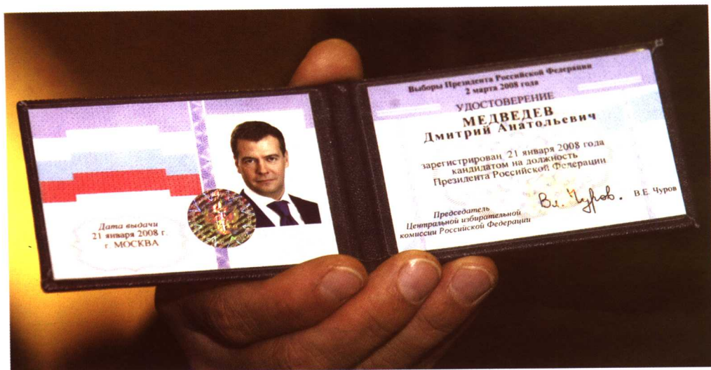
梅德韦杰夫的总统候选人身份证明（2008年1月21日）