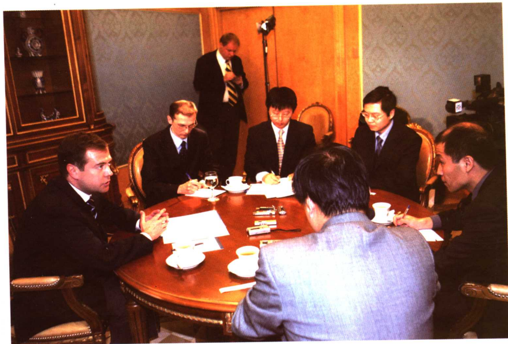
梅德韦杰夫称俄中“国家年”为史无前例的大工程(2006年3月17日)