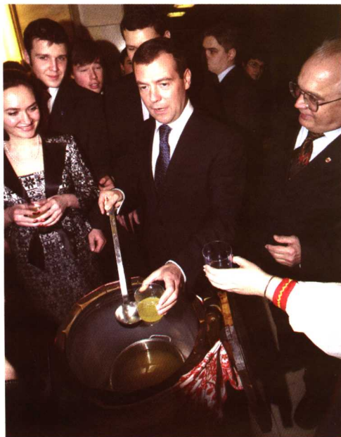
第一副总理梅德韦杰夫一行赴 国立莫斯科大学庆祝“学生日”