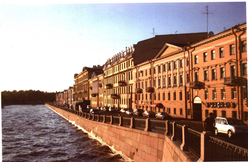
梅德韦杰夫的家乡——“北方威尼斯”圣彼得堡