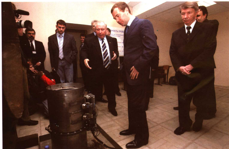
第一副总理梅德韦杰夫参观俄罗斯国立 技术大学实验室（2007年11月1日）