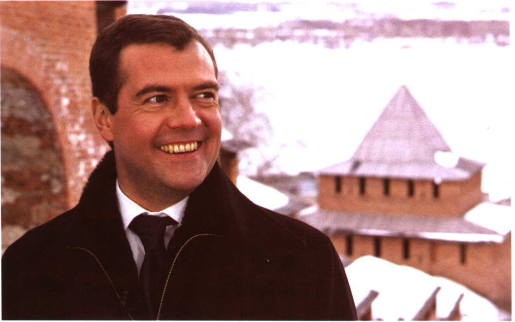
梅德韦杰夫（2008年2月28日）