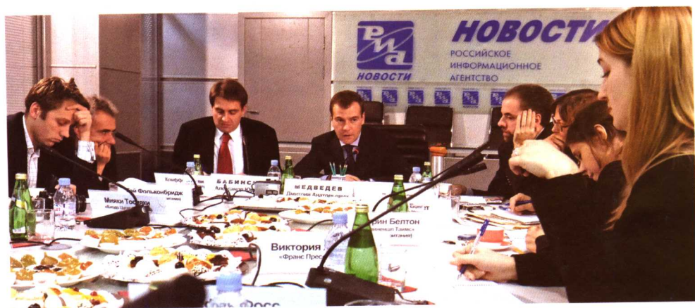
梅德韦杰夫称俄中“国家年”主要成果是 增进两国人民相互了解(2006年3月17日)