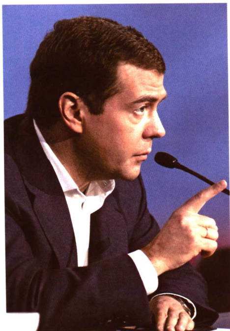
梅德韦杰夫表示如当选将继续 普京路线（2008年2月28日）