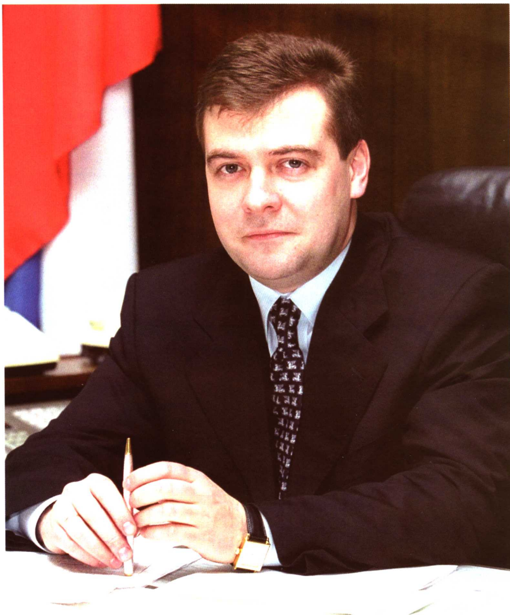
梅德韦杰夫（2005年11月15日）