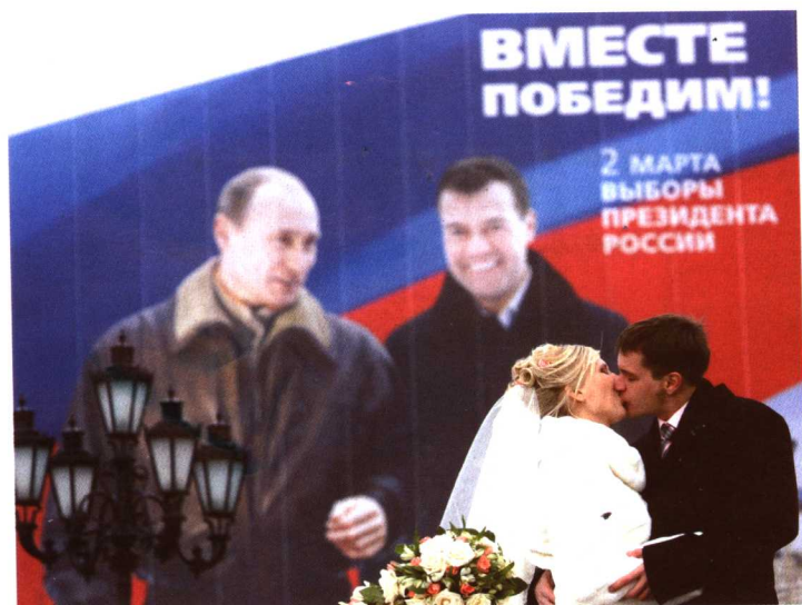
一对新婚夫妇在俄罗斯首都莫斯科市中心的梅德韦杰夫竞选宣传画前亲吻（2008年3月1日）