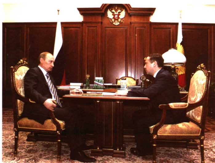
普京与梅德韦杰夫 商讨新政府构成 (2008年3月4日)