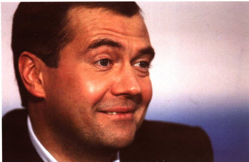
俄罗斯公布总统选举初步统计结果，梅德韦杰夫以绝对优势当选总统 (2008年3月3日)