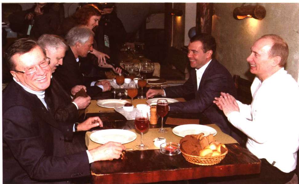
选举后的午餐（2008年3月3日）