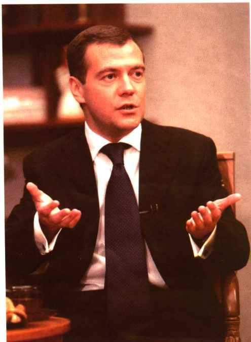
梅德韦杰夫表示俄罗斯仍将延续 总统制政体（2008年1月25日）