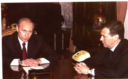
俄罗斯总统普京与梅德韦杰夫 在莫斯科克里姆林宫交谈 (2007年12月10日)