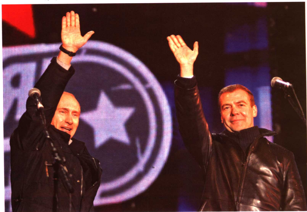
普京与梅德韦杰夫出席红场音乐会 (2008年3月3日)