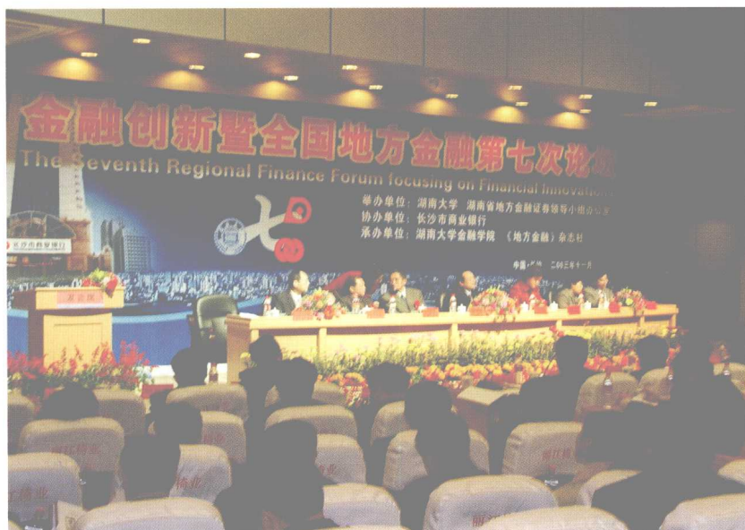
2003年11月10日，金融创新暨全国地方金融第七次论坛在湖南大学隆重举行。