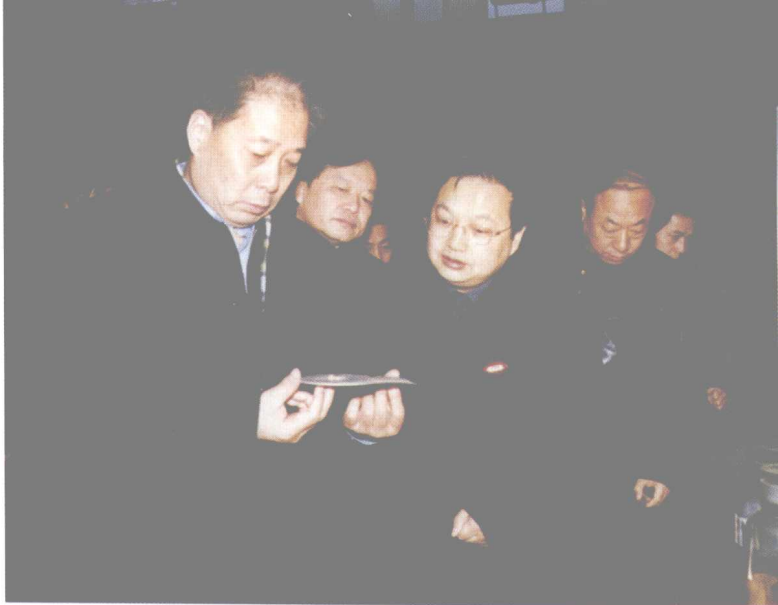
2003年2月17日，教育部副部长张保庆视察湖南大学。