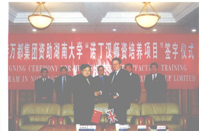
2003年3月26日，“诺丁汉师资培养项目”正式签约。