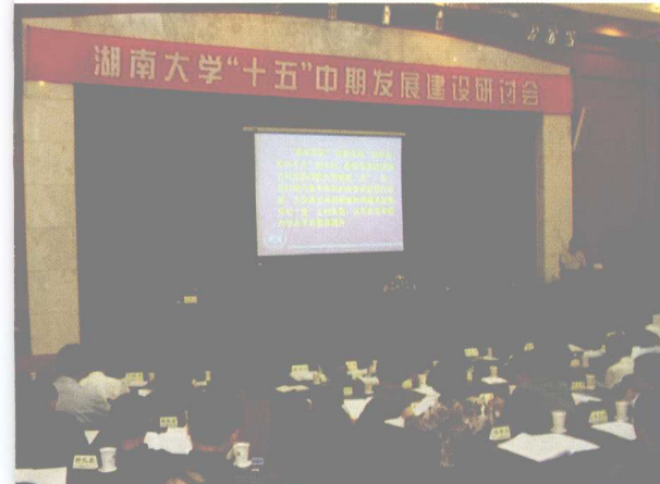
2003年7月13-17日，湖南大学成功召开 “十五”中期发展建设研讨会。