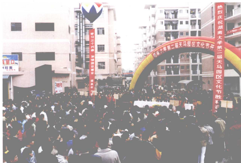
2003年11月1日，大学生公寓园区文化节开幕。