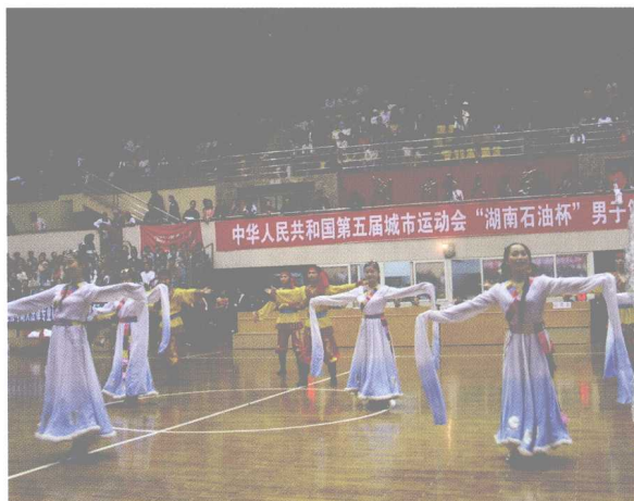
2003年10月19日，湖南大学承办第五届城市运动会男子篮球赛。