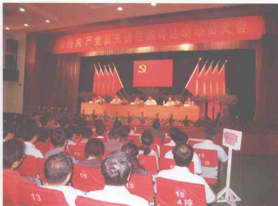
7月8日，我校隆重召开保持共产党员先进性教育动员大会