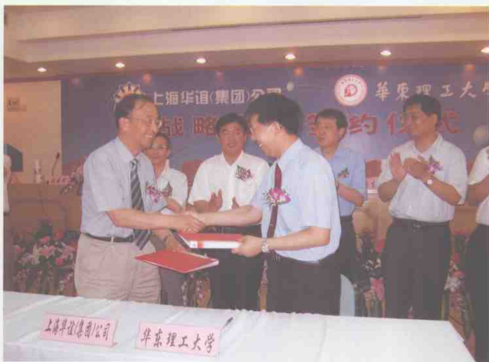
7月4日，我校与上海华谊(集团)公司签署战略合作协议