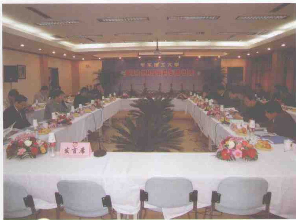
11月4日，我校国家科技园通过评估验收