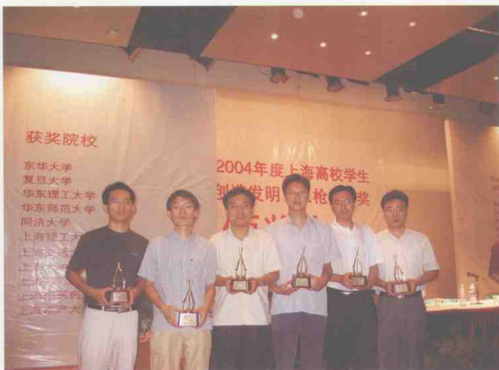
7月10日，在“创造发明三枪杯”颁奖大会上，我校获奖数量创历年之最