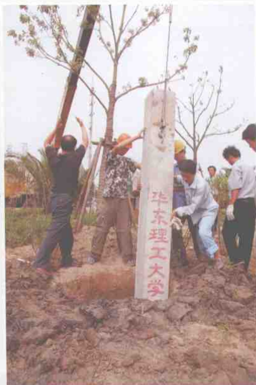
6月20日，奉贤校区一期工程启动