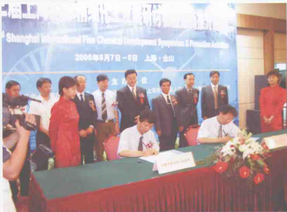
6月7日，我校与金山区政府签订全面合作框架协议