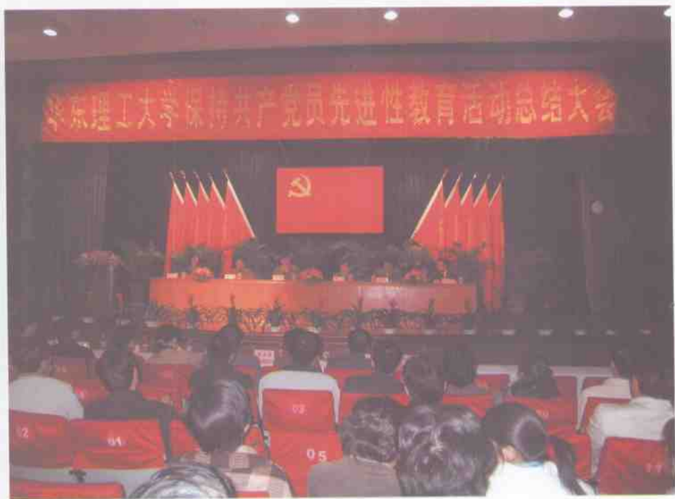
11月25日，我校召开保持共产党员先进性教育活动总结大会