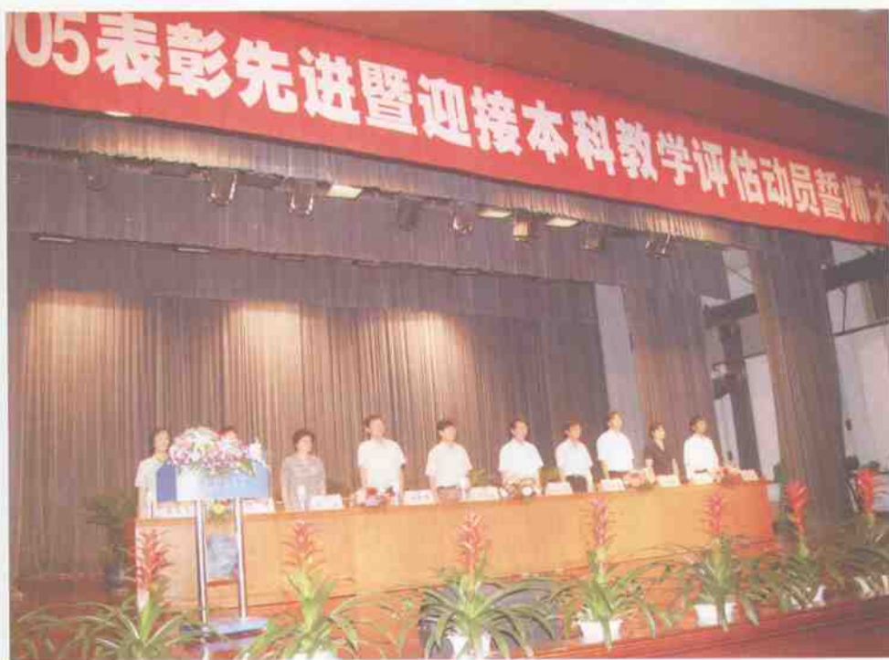
9月12日，我校召开表彰先进暨迎接本科教学评估动员誓师大