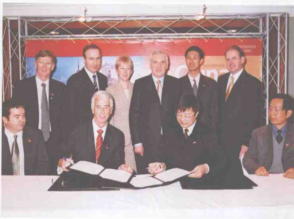
1月21日，爱尔兰总理在上海出席我校与都柏林理工大学合作协议的签字仪式