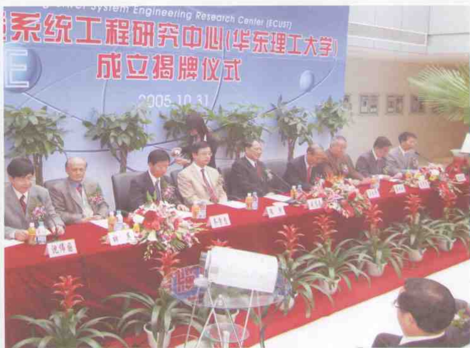
10月31日，华东理工大学系统工程研究中心成立