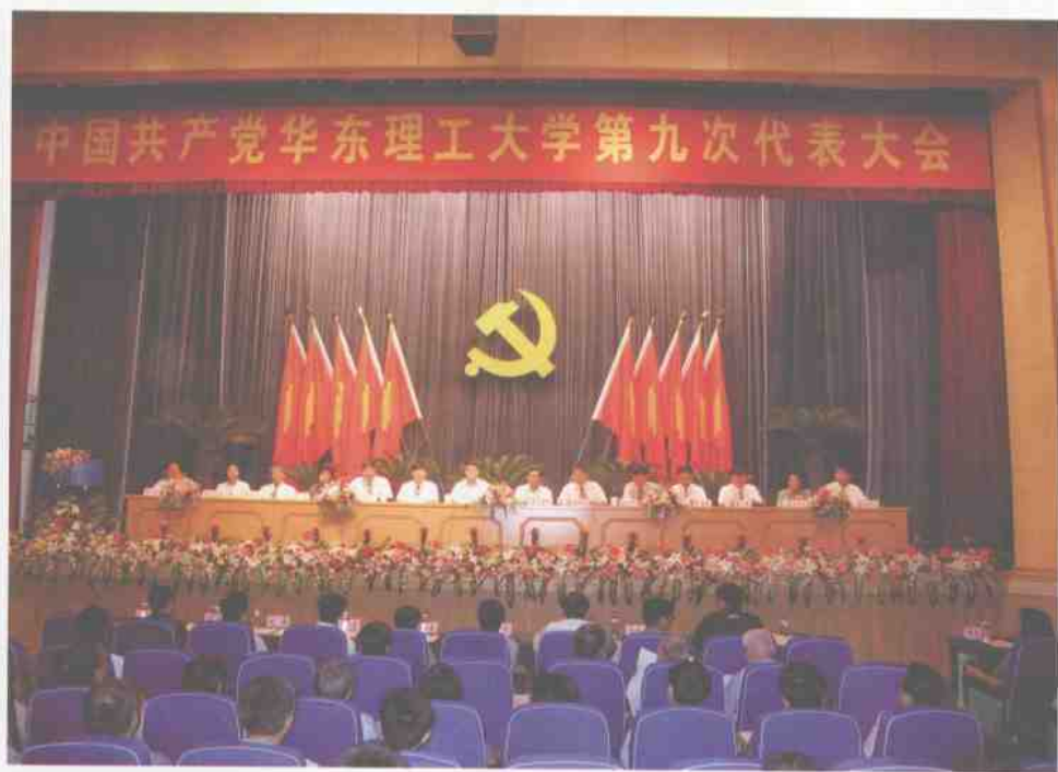
6月2日，我校隆重召开第九次党代会