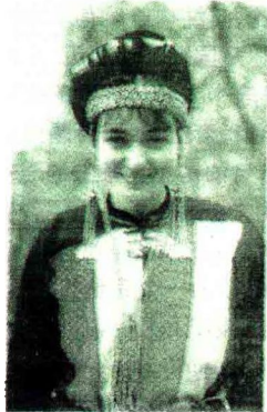
An American girl in traditional Chinese costume

首先,命题提纲中的“describe the picture”要求“描述图画内容”,这说明本段应该是描写文,我们可以称之为描述图表段,它的写作特点是根据图表