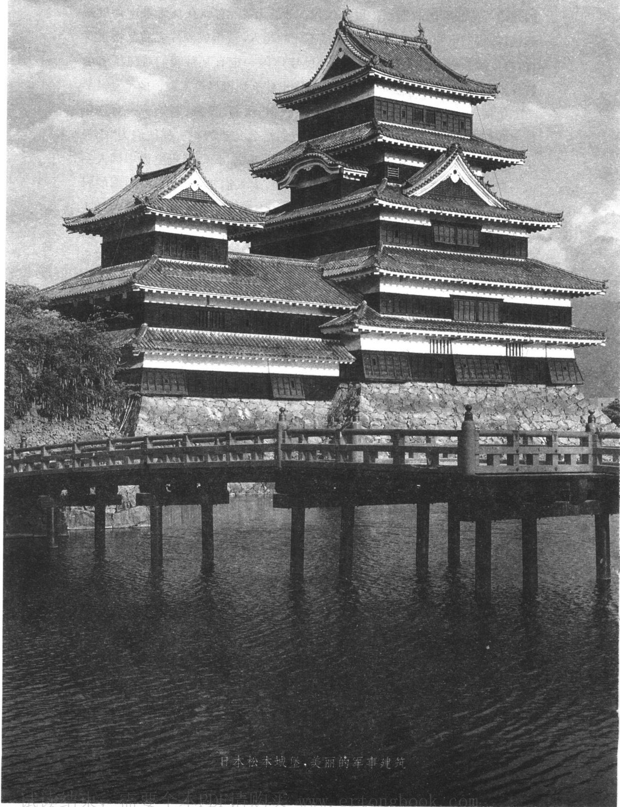
日本松本城堡，美丽的军事建筑