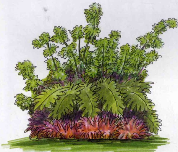
鸭脚木、春羽、新叶芋