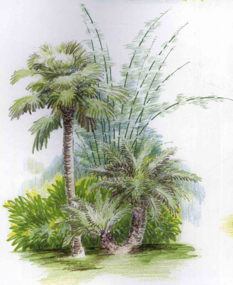
蒲葵、银海枣、花叶姜与竹子