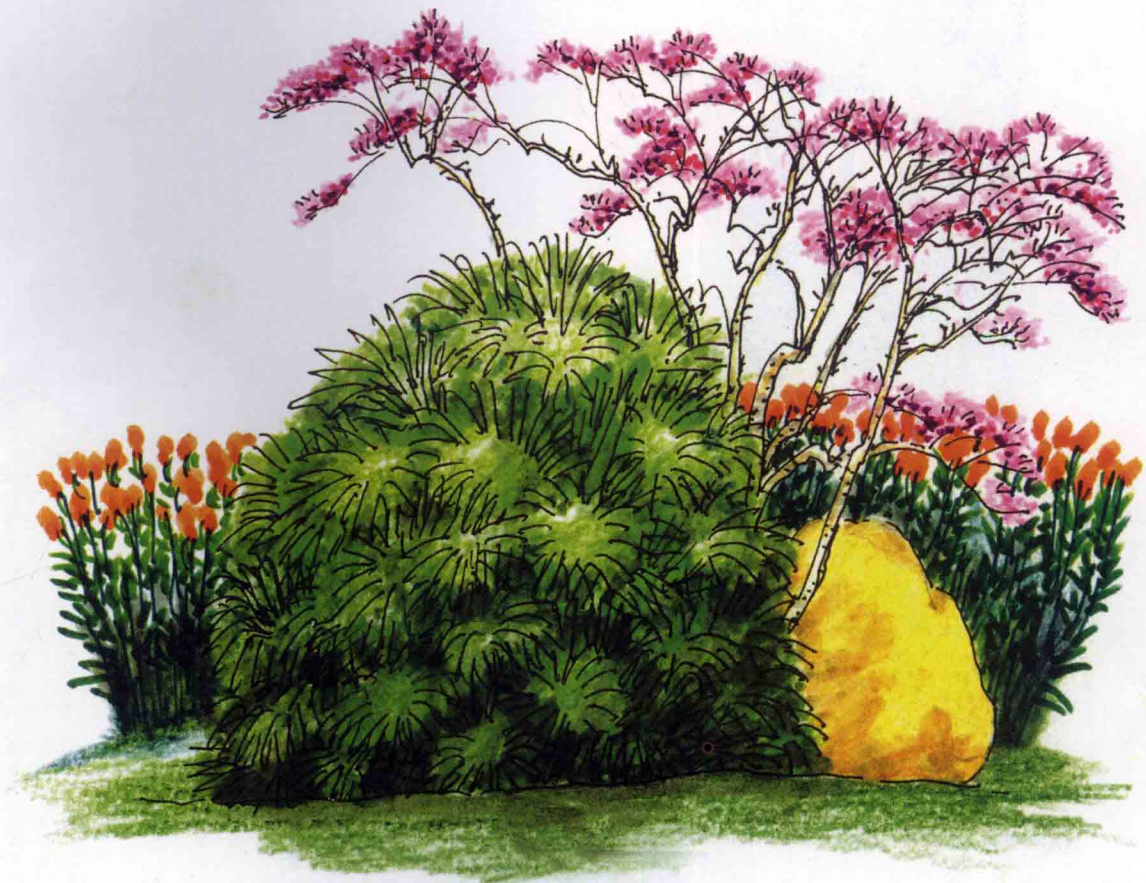
紫薇、棕竹与夹竹桃