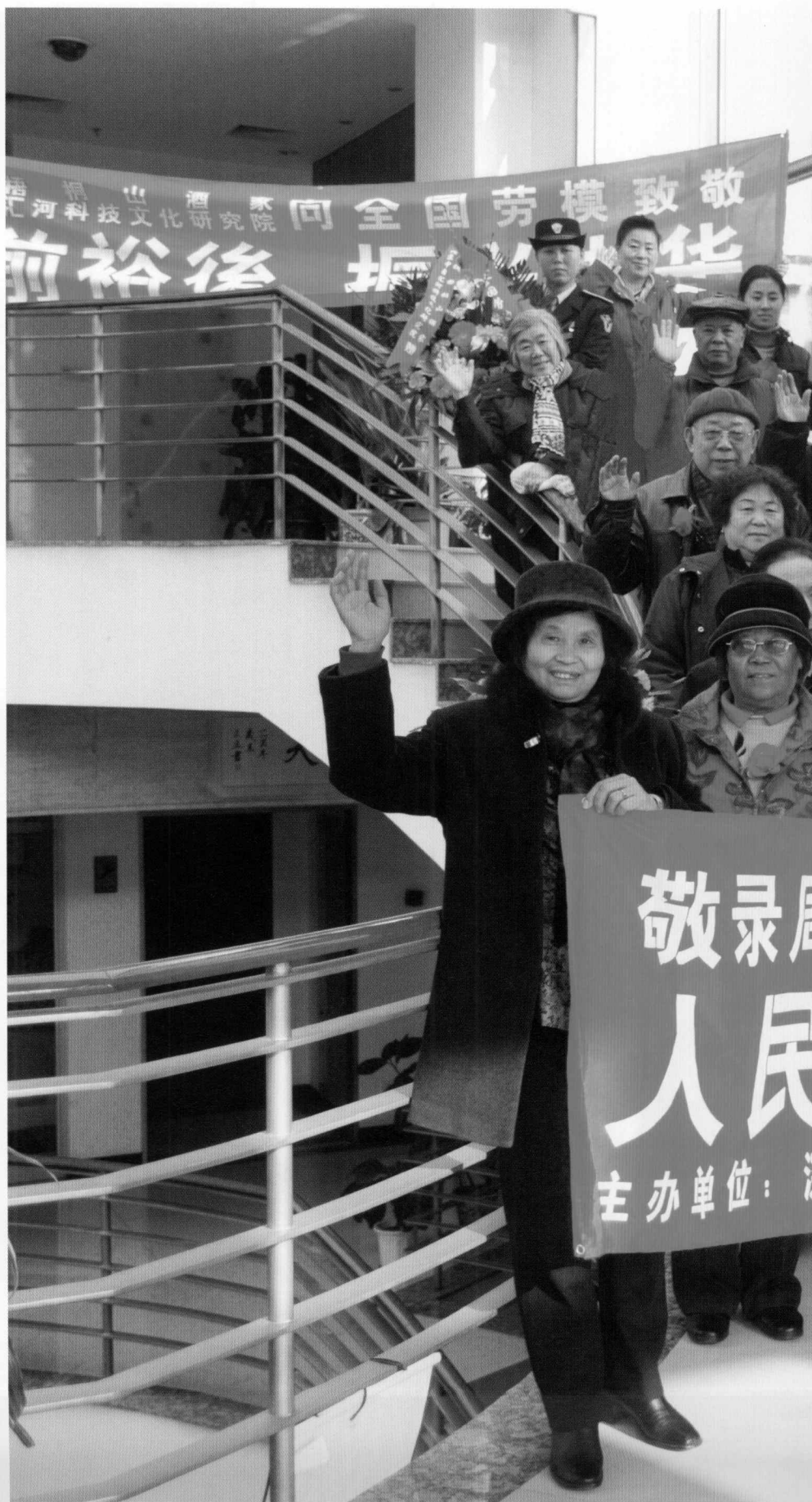
慰问全国劳动模范活动的主办单位——深圳梧桐山酒家、北京中自汇河科技文化研究院、北京紫竹书画社、北京溪梦轩书画艺术工作室的慰问队伍，手举“慰问劳模，构建和谐”、“人民不会忘记你们”的横标，举行慰问活动。