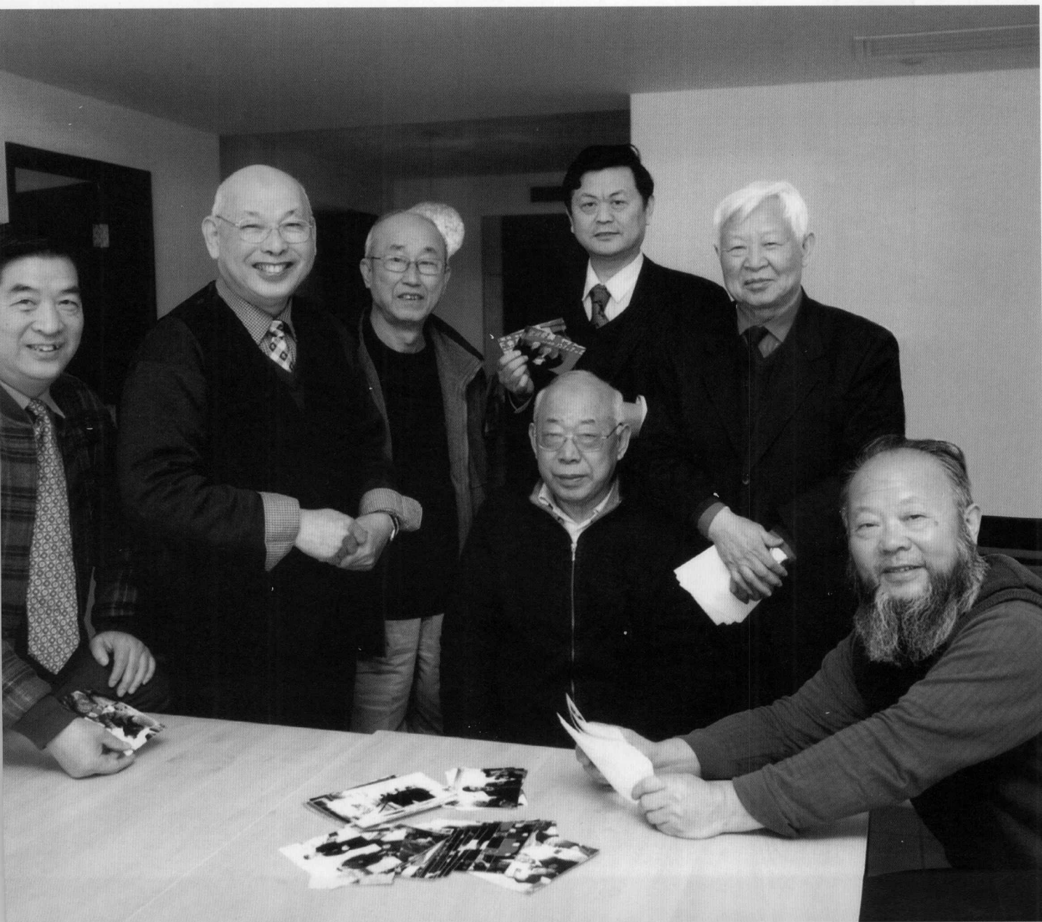
慰问全国劳动模范组委会部分委员和本书编委会部分成员合影