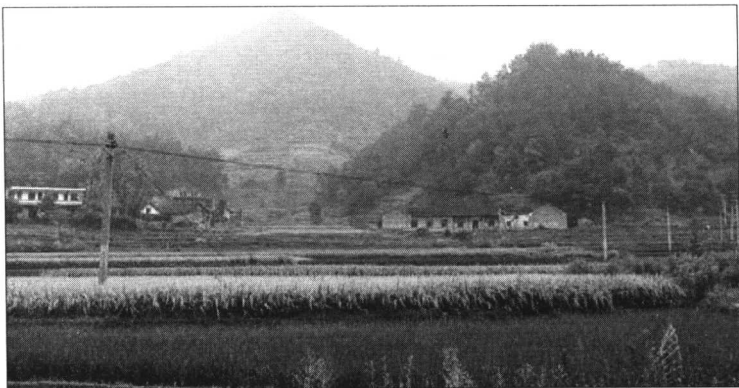
图1：白玉堂老屋今景。图中的高山即高嵎山，左首为残存的白杨坪老屋，右首为曾氏家塾利见斋。

无告者，则量力帮助。 5 星冈公热心于乡党邻里之事，在家中却是个严厉专断的家长：“星冈公昔年待人，无论贵贱老少，纯是一团和气，独对子孙诸侄则严肃异常，于佳时节令，尤为凛不可犯。盖亦具一种收蓄之气，不使家中欢乐过节，流于放肆也。” 6