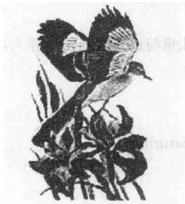
State Flower and State Bird

该州位于美国东南部,州花为鸢尾花,州鸟为反舌鸟,别名“志愿之州”,箴言“农业和商业”。地势由东向西降低,多丘陵及山地,林区约占本州面积二分之一。它是美国实施多目标水利计划最成功的州。兴建水闸及多座水库,用以防洪、灌溉、发电及工业用水。它也是美国制造原子弹最早之州。二战期间在橡岭(Oak Ridge)制成第一枚原子弹,现此地设有美国原子能博物馆。