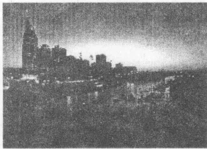
Downtown Nashville from the Cumberland River at Dusk

田纳西州州府,位于该州中北部,面积 1226 平方公里,人口 54 万,市区人口超过 100 万。这里是融合高等教育、文化和艺术的圣地,也是皮靴、牛仔帽和美妙的乡村音乐的所在。它享有“美国音乐之城”的盛誉。该市的范德比尔特大学同其他七所享有盛名的私立大学为纳什维尔赢得了“南方的雅典”的美名。