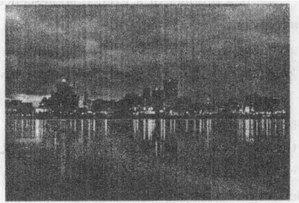
Memphis, a Major Commercial Metropolis in Tennessee, at Night