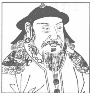
◁ 图 6-0-1 明刻 元世祖画像 ▷

的一度畅通，在元代，中国和西方的交流也较之以往更为密切。中国的罗盘、火药、印刷术等文明的结晶先后传入西欧，西方的天文学、算学等哲人的智慧也陆续传入中国，这都促进了中西方科学文化的发展。因此，法国历史学家格鲁塞（René Grousset）在《蒙古帝国史》中说：“从蒙古人的传播文化一点说，差不多和罗马人传播文化一样有益。对于世界的贡献，只有好望角的发现和美洲的发现，才能够在这一点上与之比拟。”〔1〕