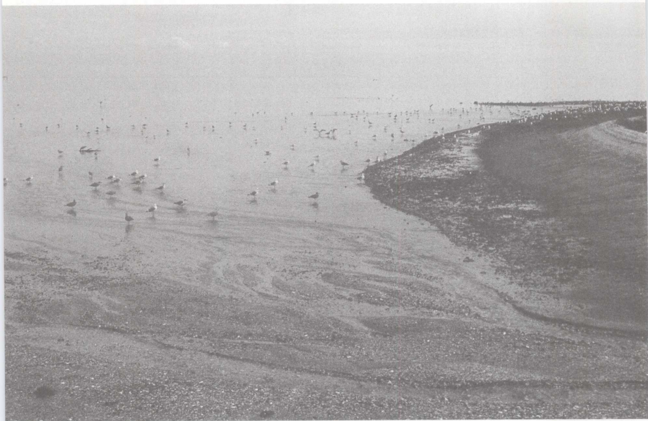
濒危园中的沿岸障壁沙嘴,旧金山