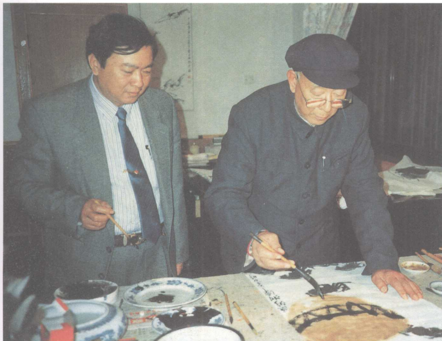
作者与授业恩师、著名画家齐良迟先生合影