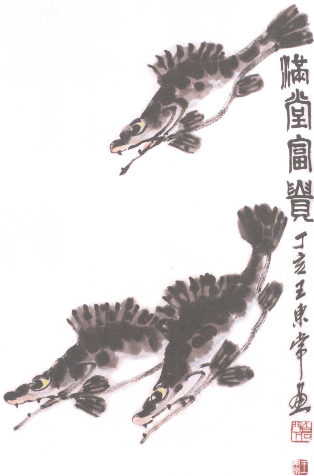
满堂富贵 44.5 x 97cm