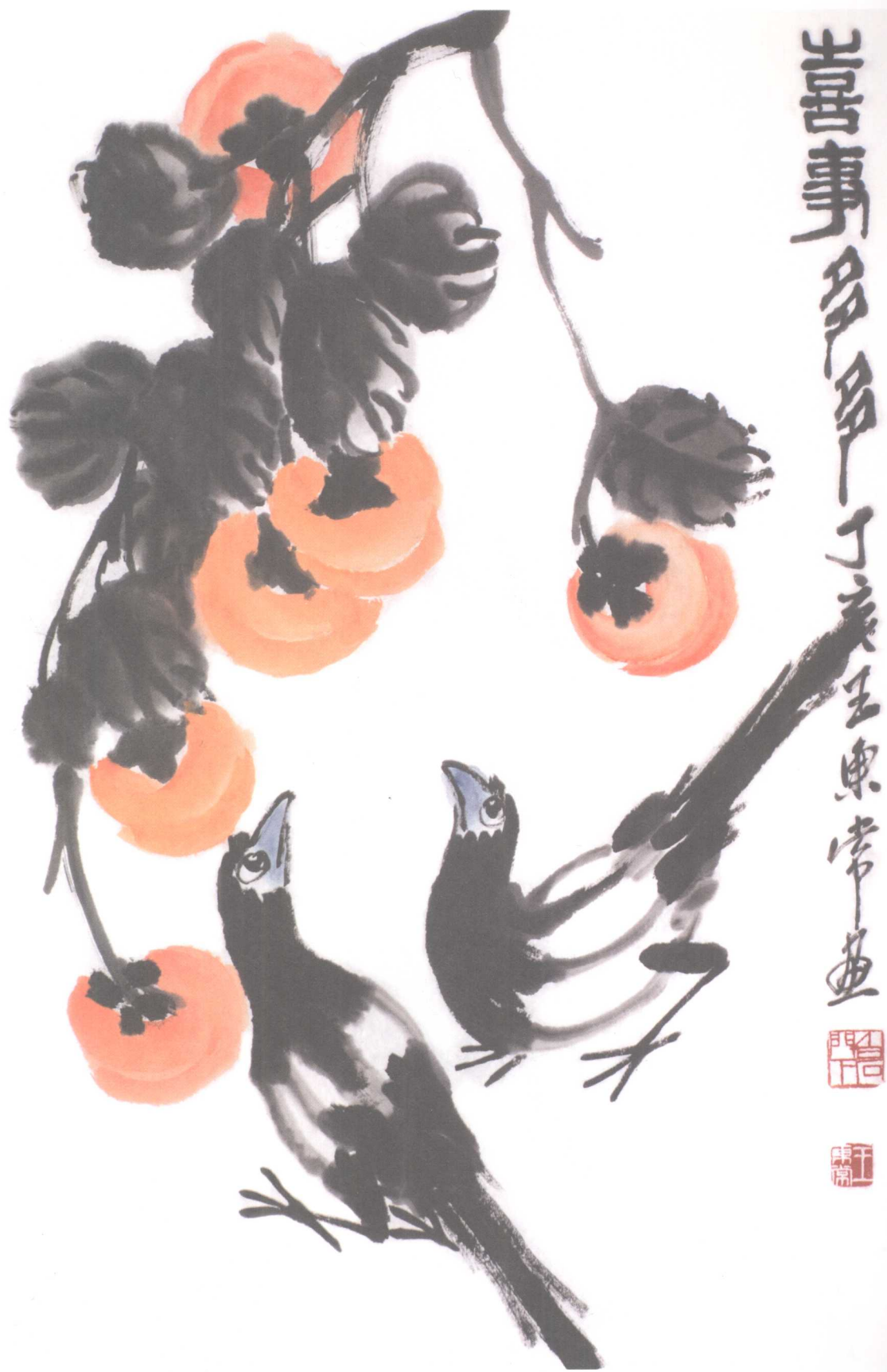
喜事多多 44.5 × 97cm