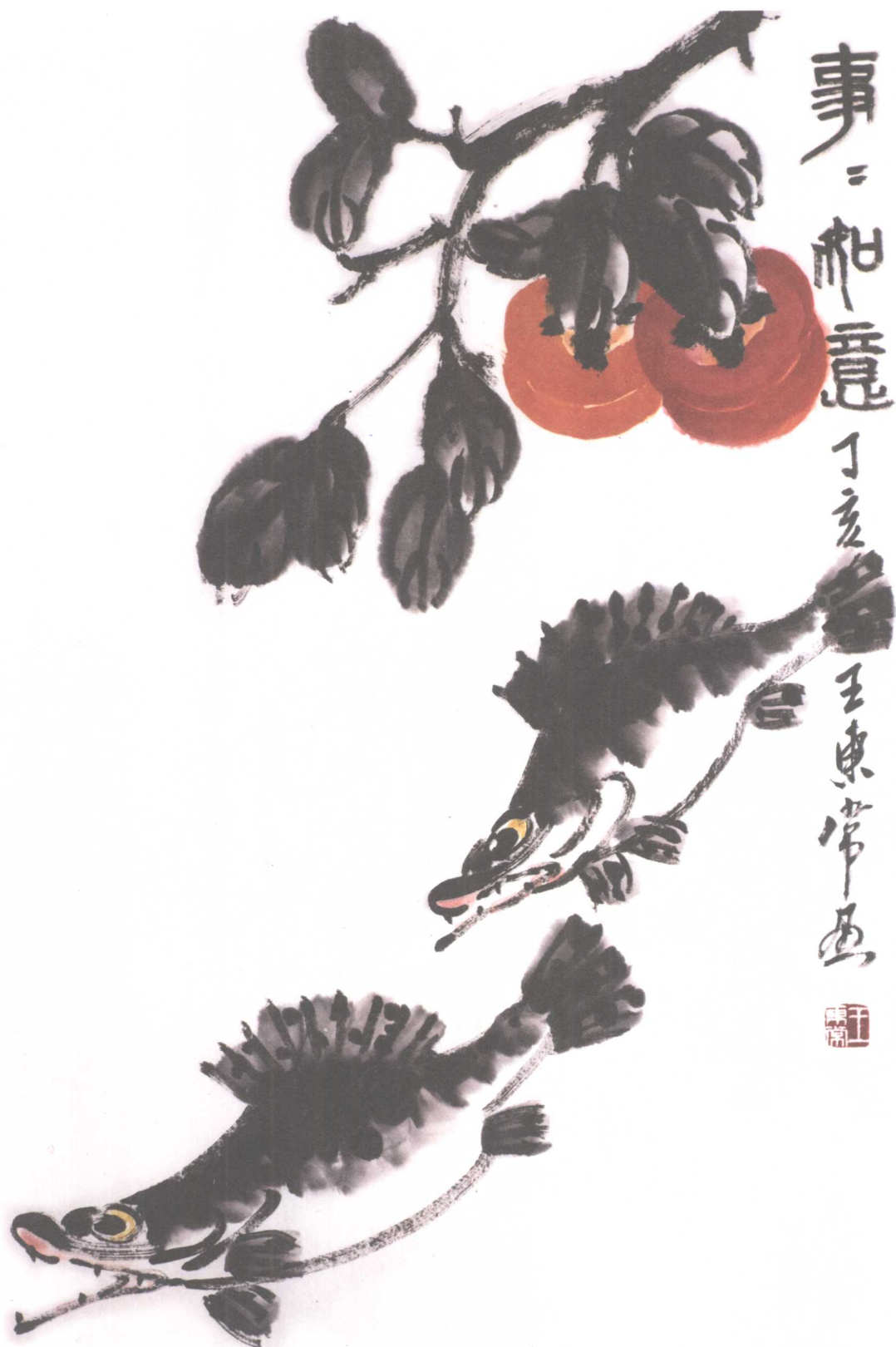
事事如意 46 × 68.5cm