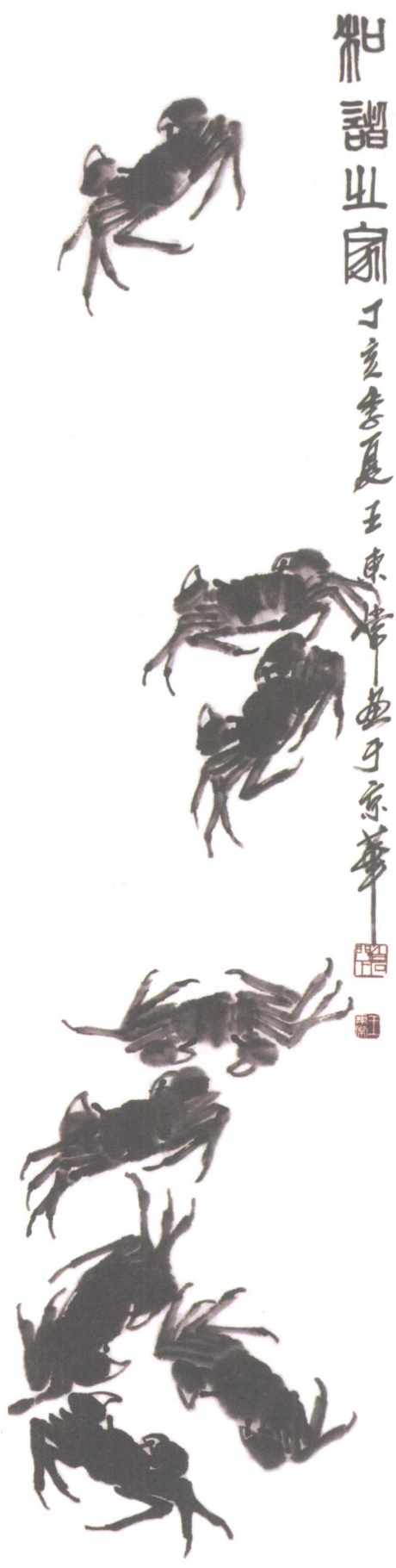
和谐之家(右) 34 × 137cm