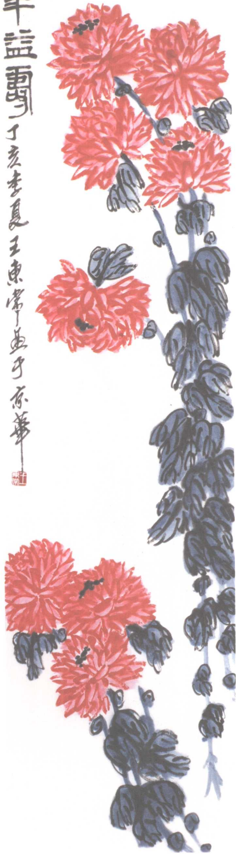
延年益寿(左) 34 × 137cm