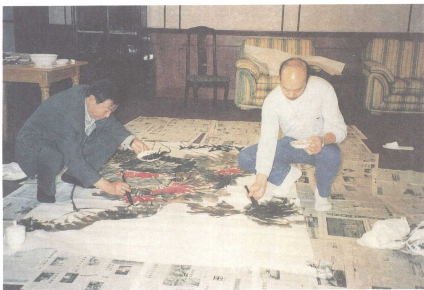
◀ 作者与师兄、著名画家齐展仪合影