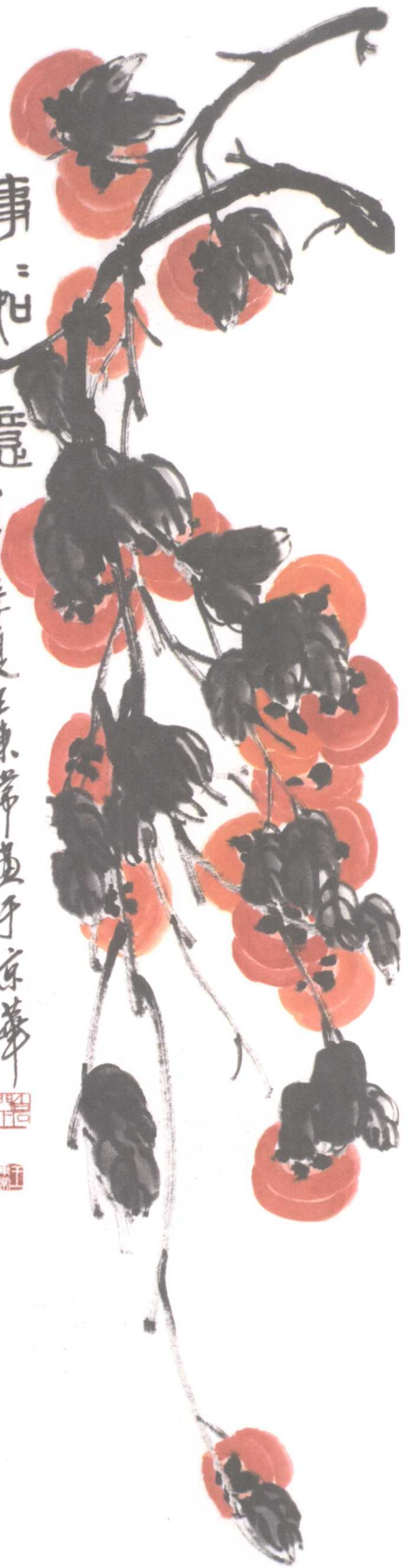
事事如意(右) 34 × 137cm