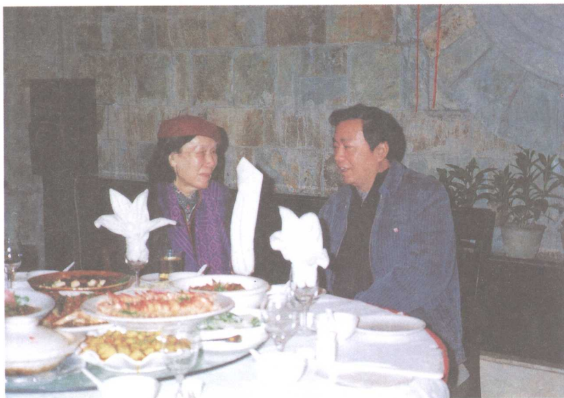
▶ 作者与徐悲鸿夫人、著名画家廖静文合影