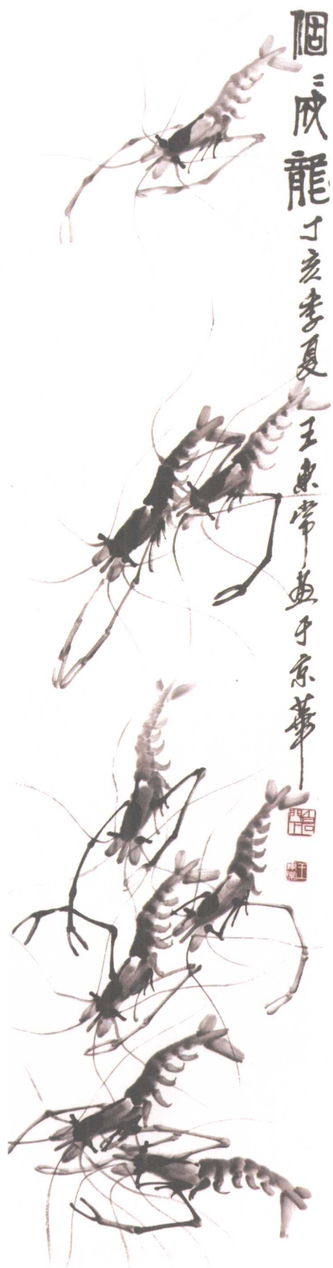
个个成龙(左) 34 × 137cm