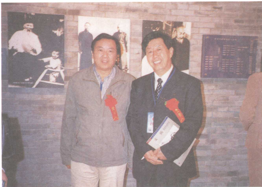
◀ 作者与中国美协党组书记、常务副主席刘大为合影