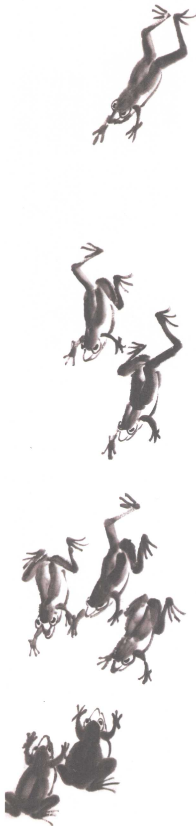
人壽年丰(右) 34 × 137cm