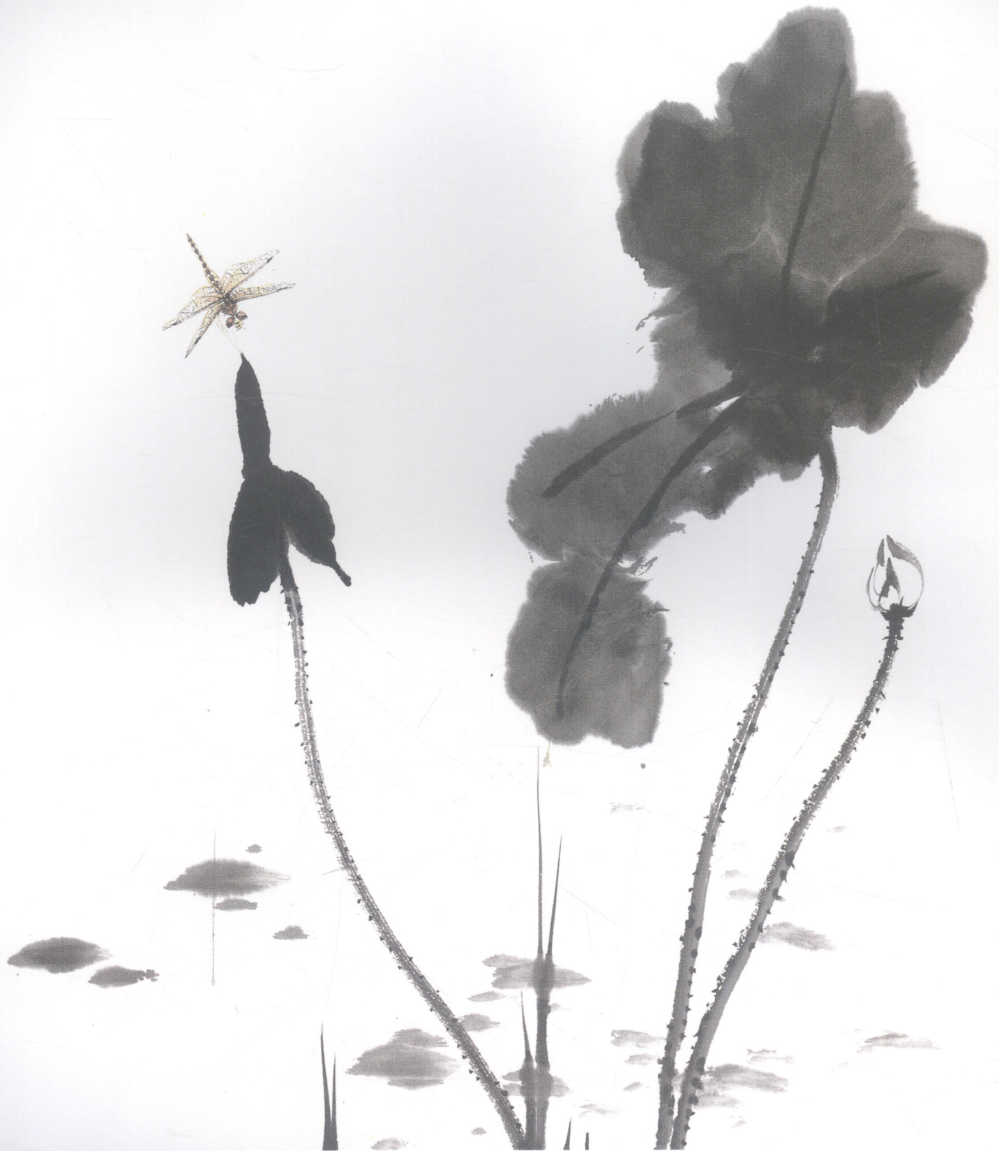
池塘清趣（与霍春阳合作）