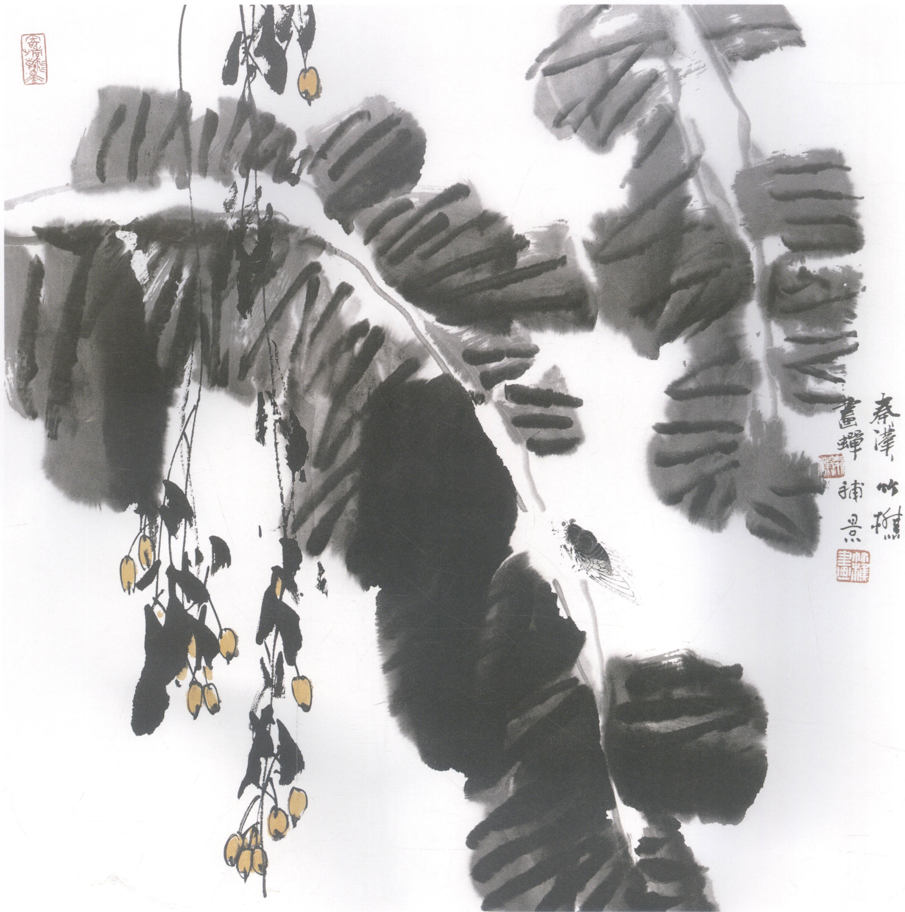
蕉阴蝉鸣（与竹蕉合作）