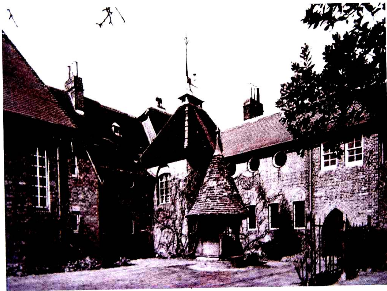
红屋 设计：菲里普·韦伯(Philip Webb) 1859年

红屋因外墙用了红砖而得名。红屋是具有创造性的建筑，强调了功能性、使用性和舒适性，改正了过去建筑单纯模仿而缺乏创造性的通病，是哥特式建筑与英国乡村建筑的结合体，自然、简朴、实用。