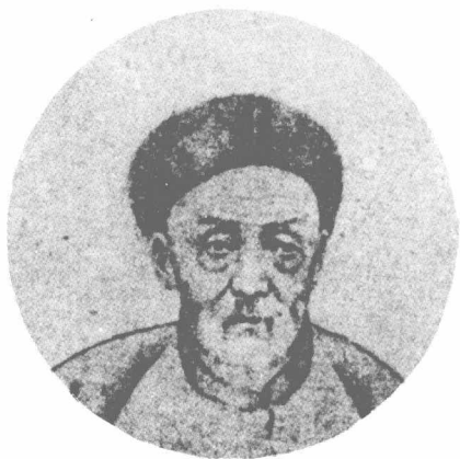
左：俞樾像。他学识渊博，著作繁富，笔记有《春在堂随笔》、《右台仙馆笔记》。