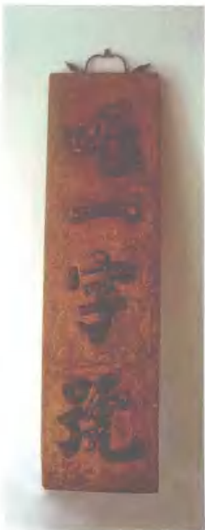
清代湖广巡抚谭继洵（谭嗣同之父） 所题爆庄字号