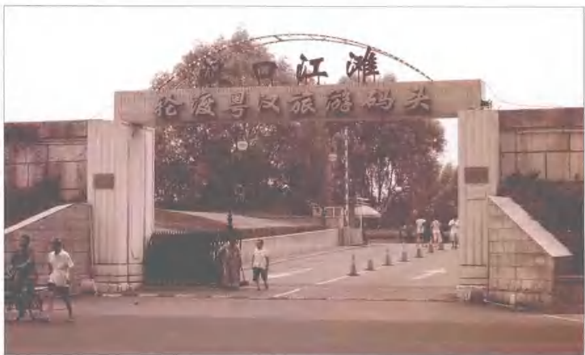
民国时期出口运输浏阳花炮的汉口粤汉码头