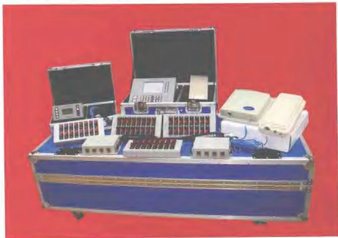
音乐焰火点火器系统