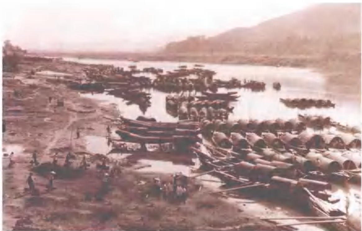
民国时期水运花炮到外埠销售的浏阳河码头遗址