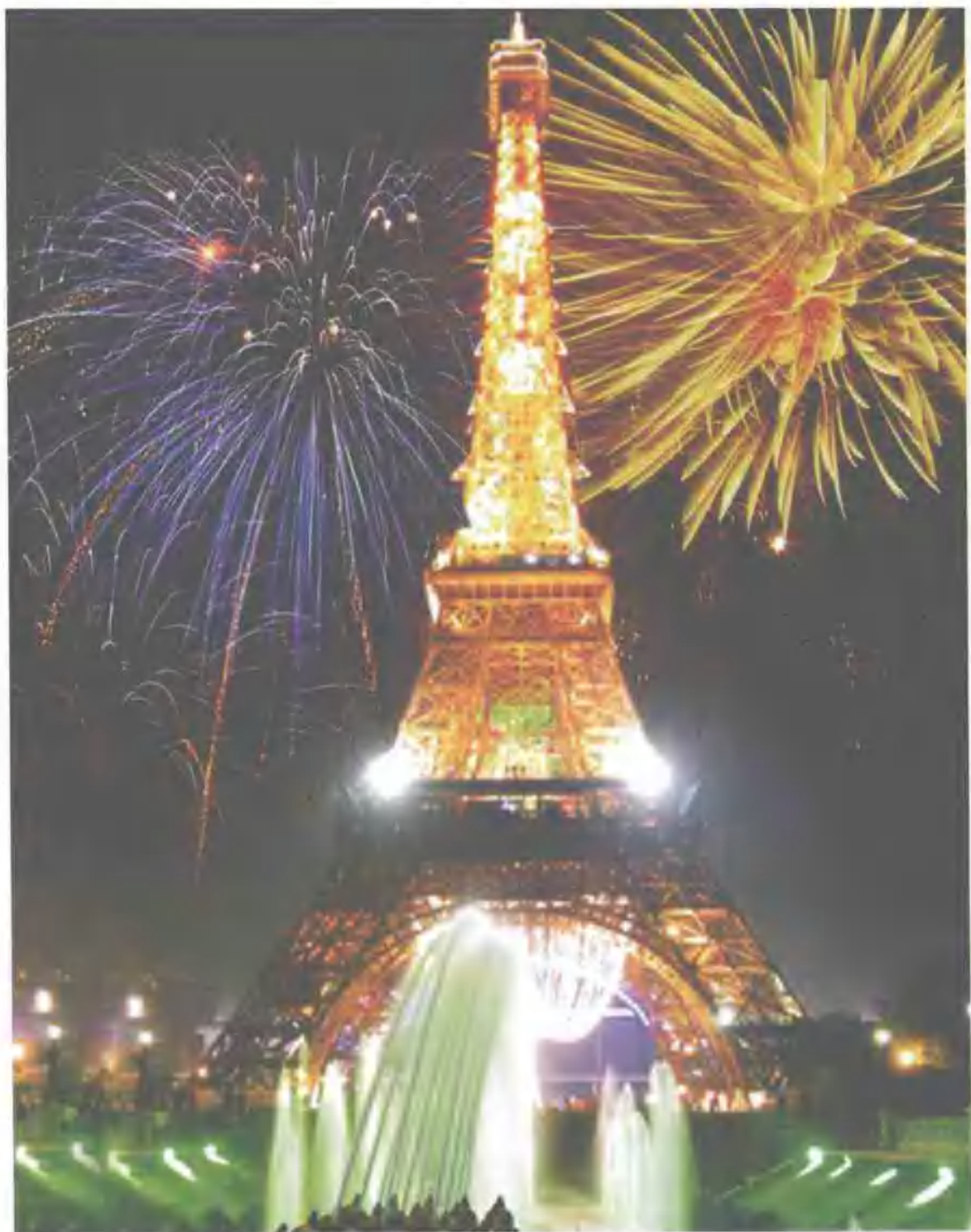
浏阳花炮为法国“世足赛”喝彩