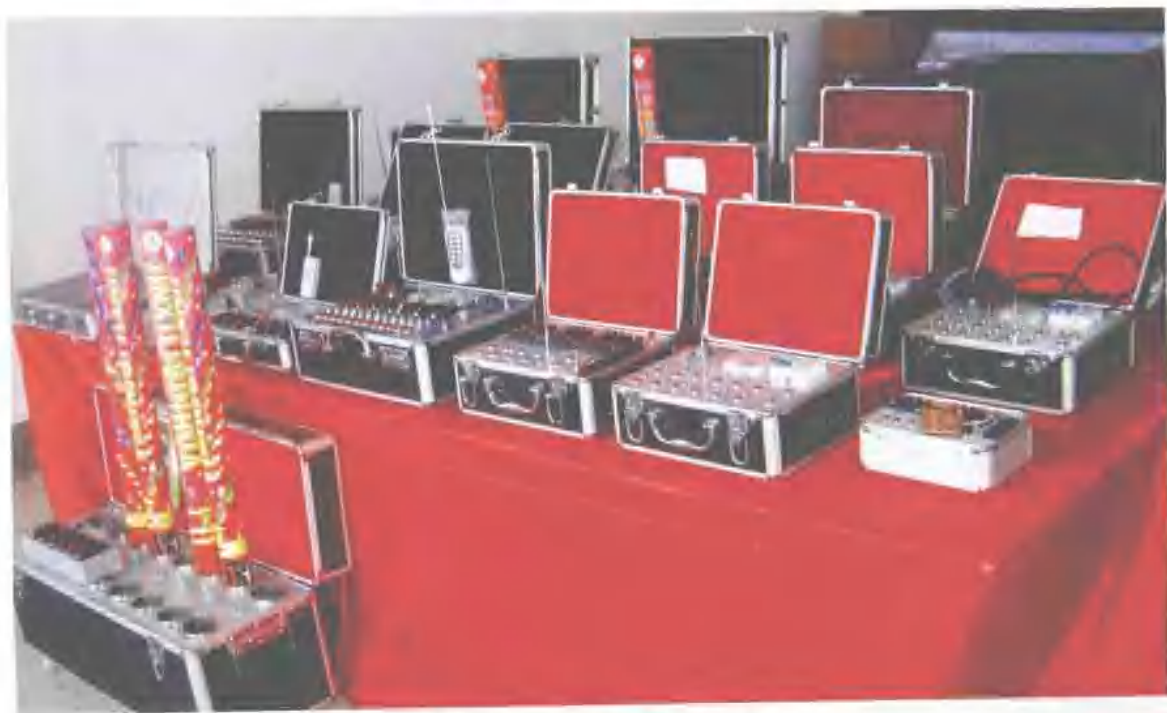
礼宾花点火器