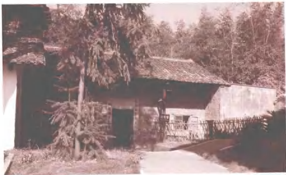
浏阳大瑶爆庄旧址