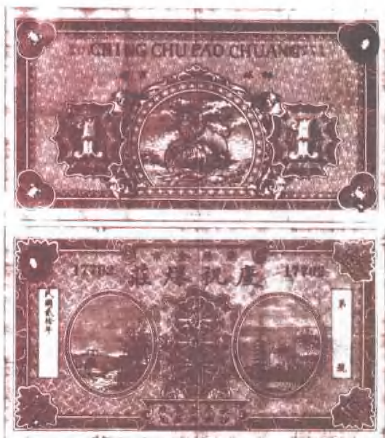
1931年浏阳金刚爆庄银票（张文清 收藏）