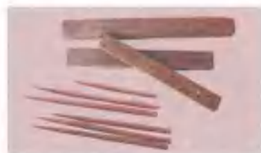
筒口签子、打方、压方