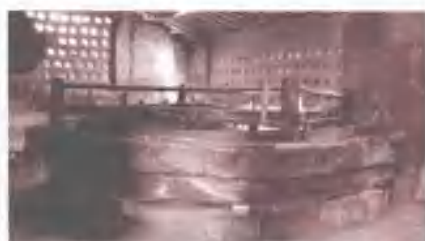
爆竹作坊内保存的磨硝牛碾