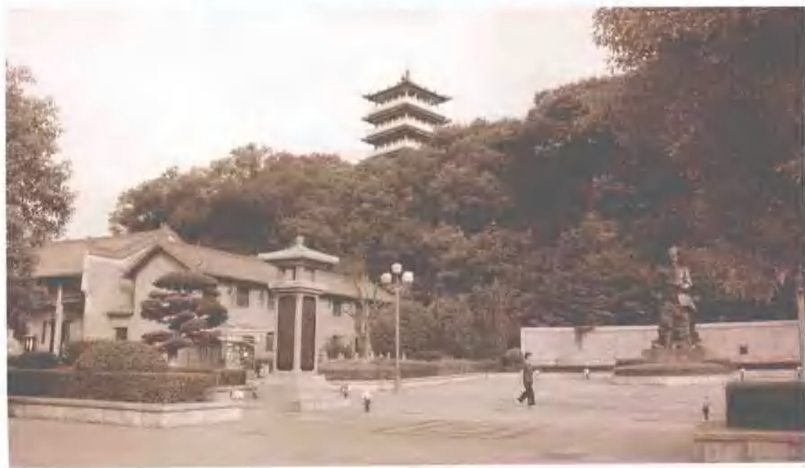
思邈公园