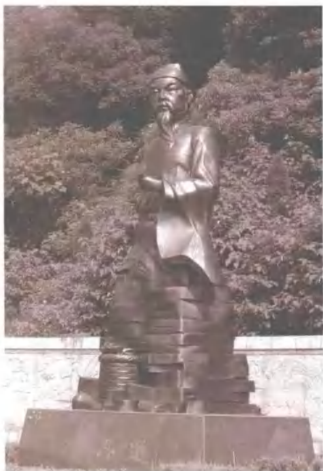
孙思邈塑像