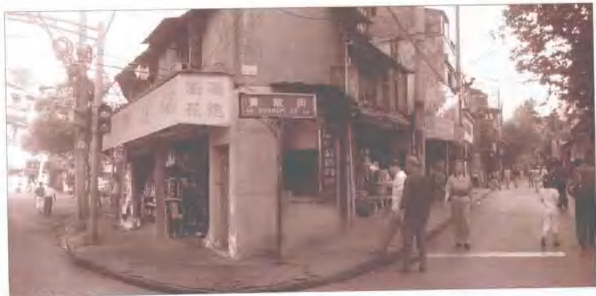
汉口黄陂街保存的浏阳爆庄旧址