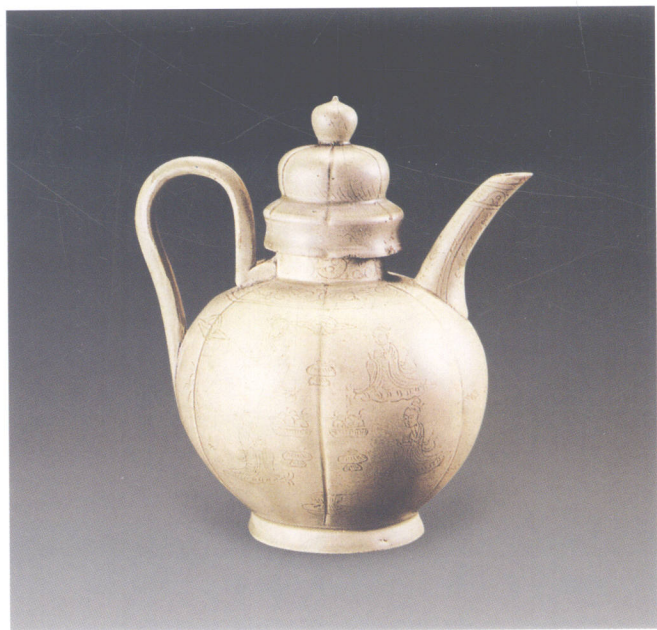
图9 划花宴乐人物执壶