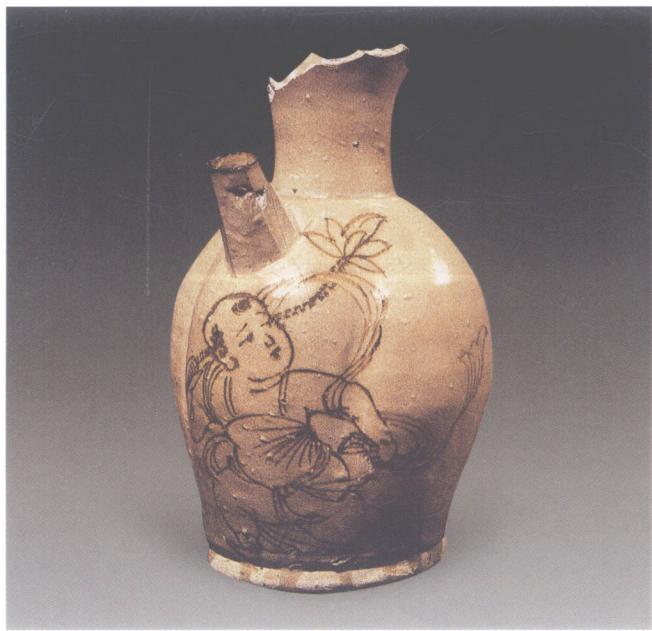
图7 唐代童子持莲纹执壶

五代时期生产的秘色瓷为越窑的珍品，赵令畤《侯鯖录》云：“今之秘色瓷器，世言钱氏有国，越州烧进为供奉之物，不得臣庶用之，故云秘色。”五代秘色瓷用来向中原王朝纳贡，《十国春秋》记载：“开宝二年（909）秋八月……是时王贡秘色瓷器于宋”（卷八十二《吴越六·忠懿王世家》下）；“宝大元年（924）……秋九