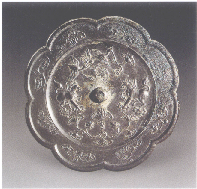
图8 唐代双雁舞马葵花镜