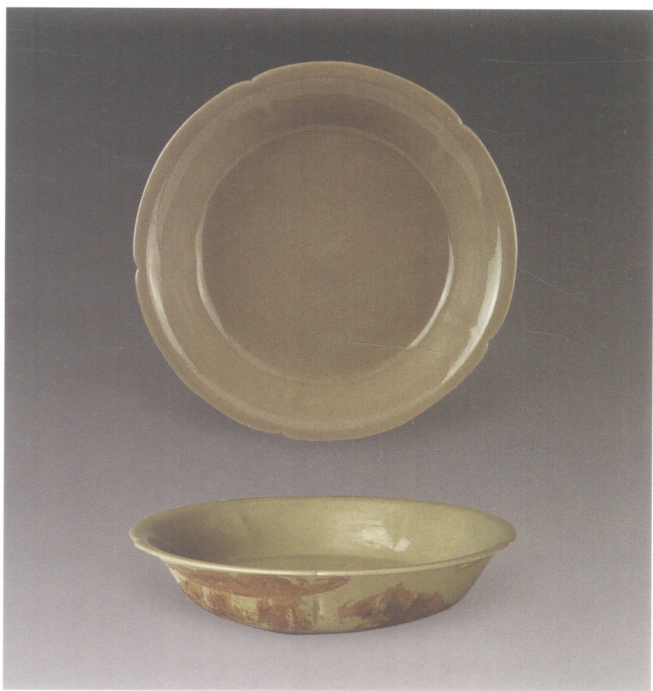
图4 秘色瓷青釉花口盘

青釉刻花四系背壶（残器）（图版93），造型呈扁状葫芦形，椭圆形杯形小口，短细颈，扁