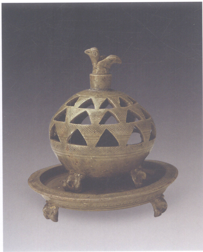
图1 西晋青釉镂空香熏

青釉羊形烛台(图版78),羊卧伏状,体态肥硕,神态祥和安逸。釉色青绿,晶莹润泽。羊头有孔用以插蜡烛。羊在古代被视为祥瑞动物,三国、两晋青瓷中屡见羊形器,均精巧可爱,为一时风尚。中国古时羊与祥通,许慎著《说文解字》曰:“羊,祥也。”吉祥多写为“吉羊”。汉字中的美、善等字均从羊。《说文解字》释美:“美,甘也,从羊大。羊大为美。”在中国古代工艺和美术作品中常常见到羊的形象。1958年