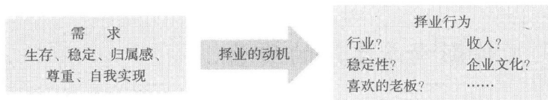
图 1.2 需求决定择业行为

需求产生动机，动机决定行为。马斯洛的需求层次理论从心理学的角度深刻阐述了工作、职业对我们的真实含义，阐述了各种动机对我们择业的影响。需求决定择业行为的流程如图 1.2 所示。