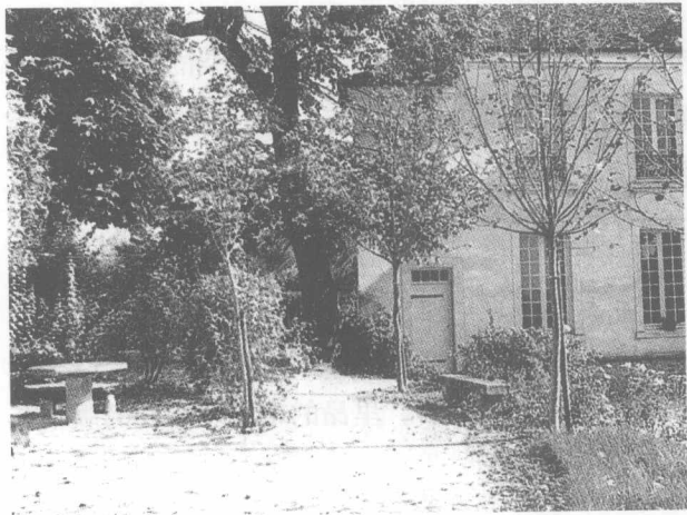
1757年卢梭在蒙莫朗西居住的小屋蒙路易（原为17世纪修建的一座小仓库，《爱弥儿》就是在这间小屋里写作的）

更令人迷惑不解的是：原来推心置腹、有话直说的朋友，现在在谈话和通信中都闪烁其词，吞吞吐吐，好像在打哑谜。达朗贝尔写信向他表示祝贺，但在信末为什么不签上自己的名字？布弗勒夫人写信向他致意，为什么又要他把信看完后将原信退回？卢森堡元帅为什么要他把马尔泽尔布关于《爱弥儿》出版一事的信通通还给马尔泽尔布本人？更令人莫名其妙的是，他不知道布弗勒夫人为什么无缘无故地劝他到英国去，说大卫·休谟 ⑥ 非常欢迎他，将一路陪他到伦敦。尤其令人摸不着头脑的是：这位夫人还在信中间他是否愿意拿着一封盖有王室印章的公