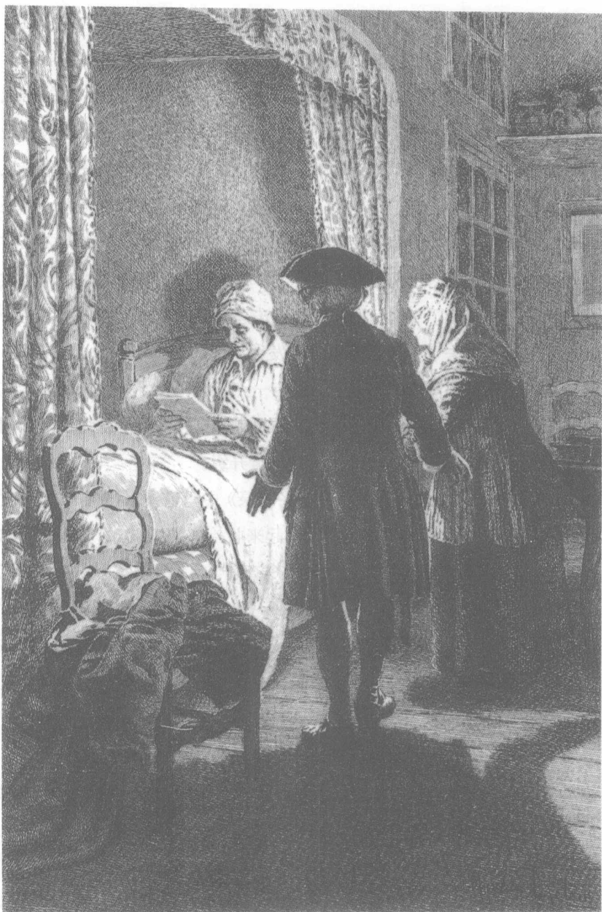
卢森堡元帅深夜派人通知卢梭逮捕令已经下达