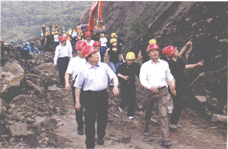
中共四川省委副书记、四川省省长蒋巨峰在抗震救灾现场