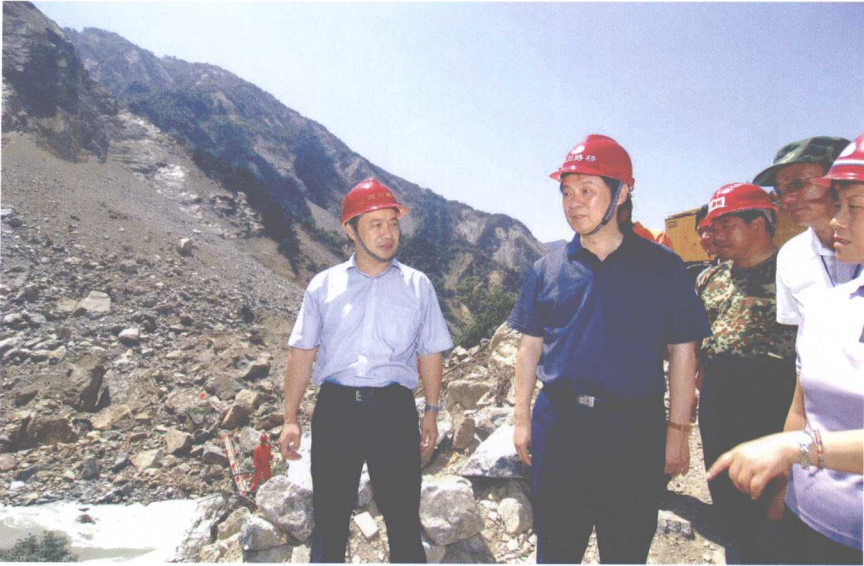
中共四川省委书记、省人大常委会主任刘奇葆在抗震救灾现场