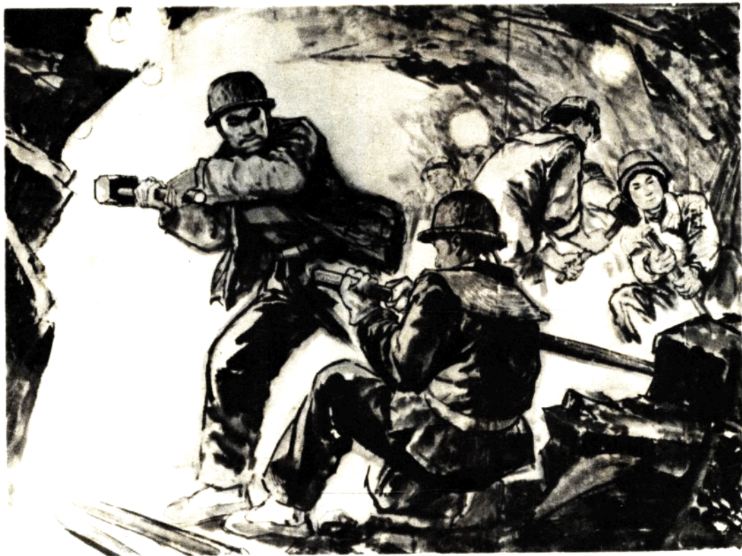
9. 凿穿太行山 梁长林