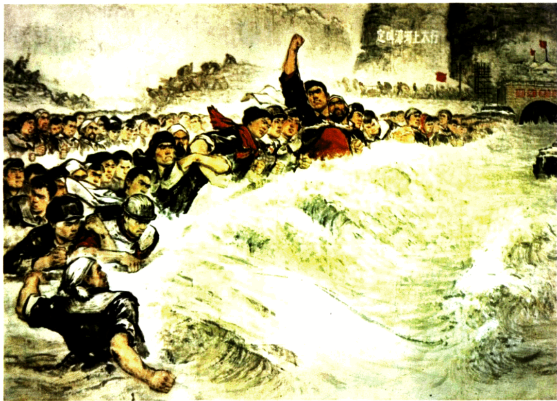
13. 截流 梁长林