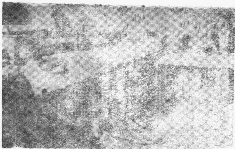
图为府谷县榆家坪村。1935年3月，在此成立了府谷县革命委员会。