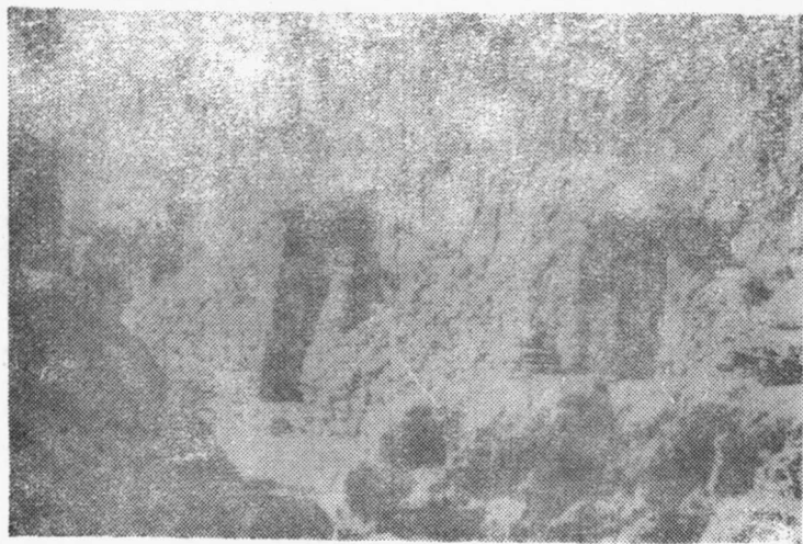
图为府谷县委、县革委领导在榆家坪住过的土窑洞。