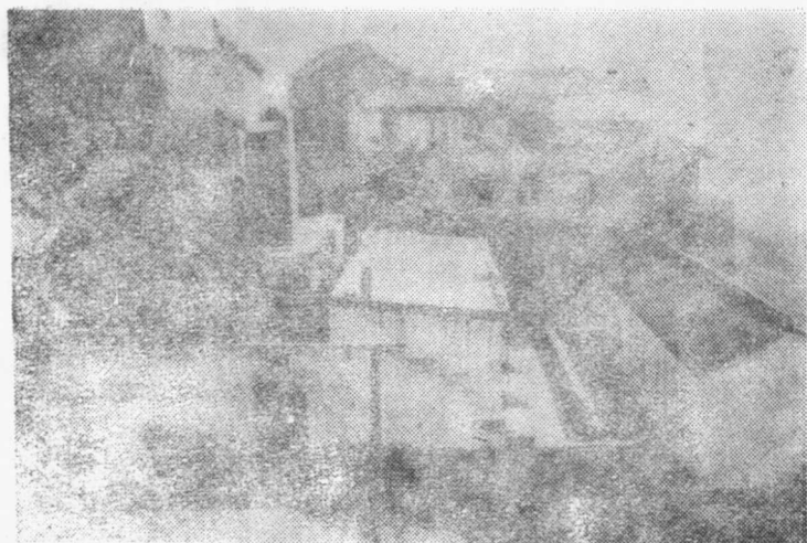
图为府谷县南门第一高小旧址。1927年至1931年中共府谷南门第一高级小学支部和中共府谷县委机关设在这里。