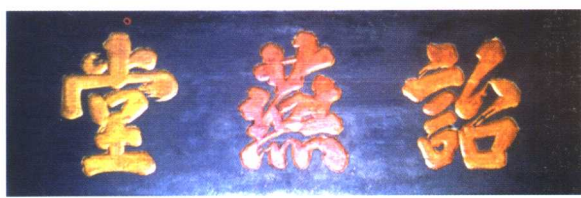
治燕堂 石仓下桥陈氏 家庙堂匾