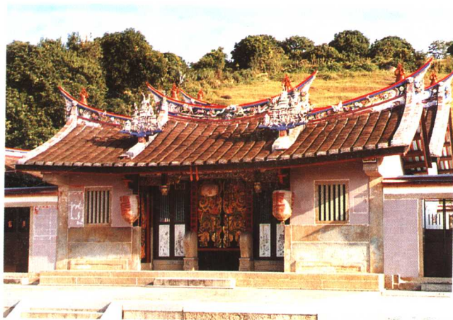
郭坑霞洲景良楼大夫第