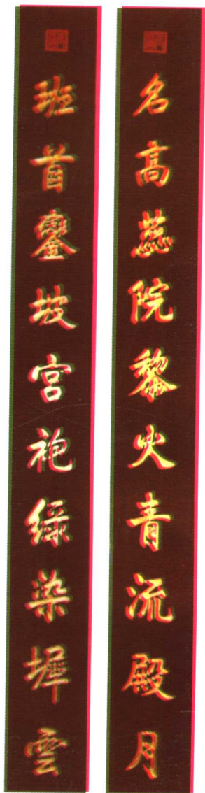
明·崇禎帝賜联林杆（原件）在洞口林氏宗祠