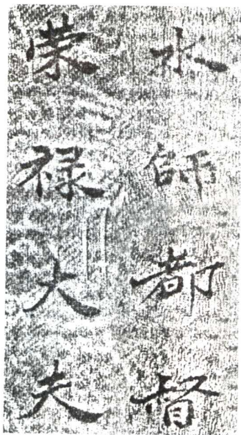
选自康熙御书（原件）在龙头林氏家庙