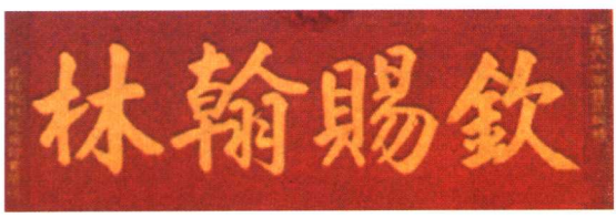
钦赐翰林 湘桥大夫第门匾（原匾 已废，新匾仿制）