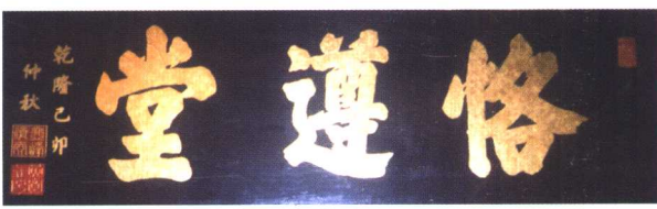
恪遵堂 郭坑霞洲景良楼 大夫第堂匾