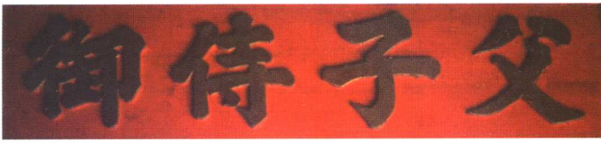
父子侍御 后坑侯氏家庙 内挂匾