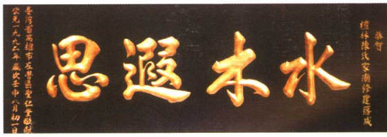
水木遐思 台湾宗人到檀林陈氏 家庙谒祖送匾