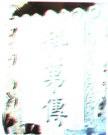
在田璞社曾氏祠堂（原件）