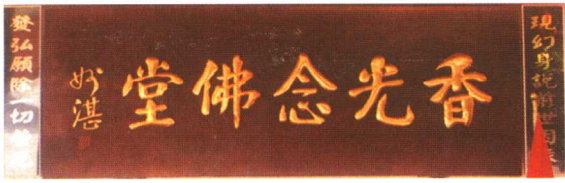
香光念佛堂 在土坪社