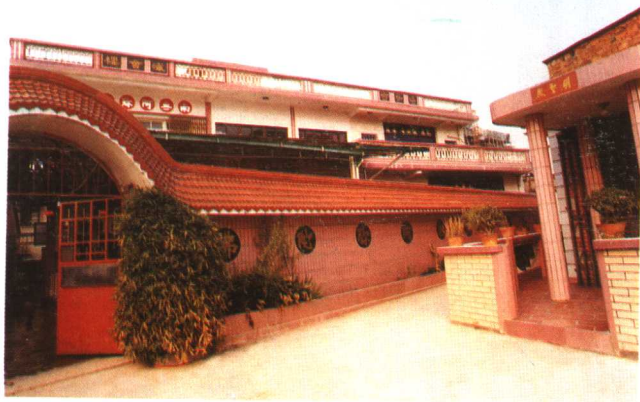
龙文区香光念佛堂