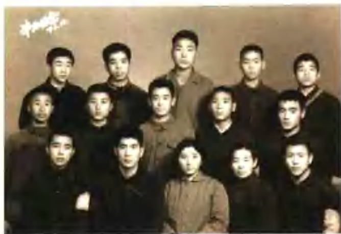
虽然年轻，可是已教了这么多学生