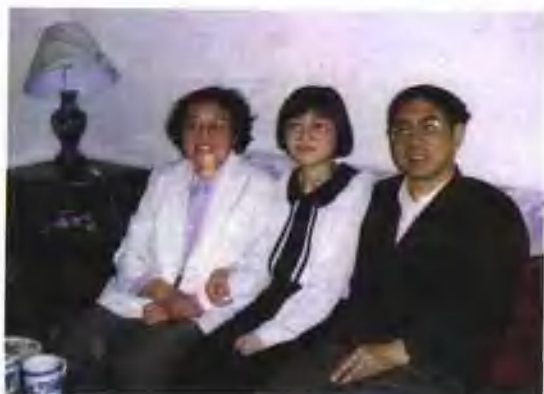
一家三口，其乐融融