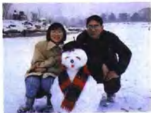
和女儿一起堆的雪人儿 多漂亮