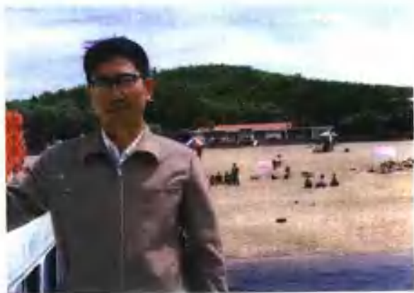
工作以后第一次外出