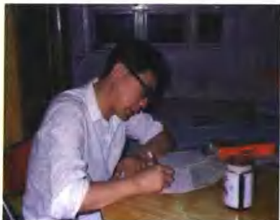
创作的欢乐和艰辛