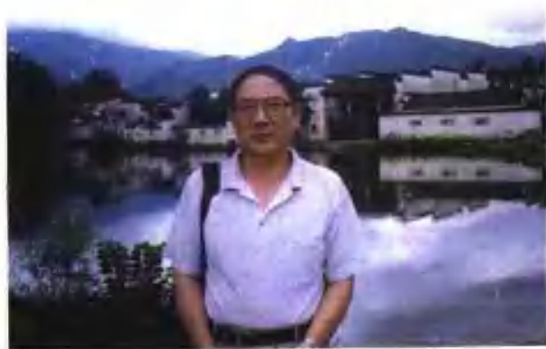
享受黄山古寨的风光