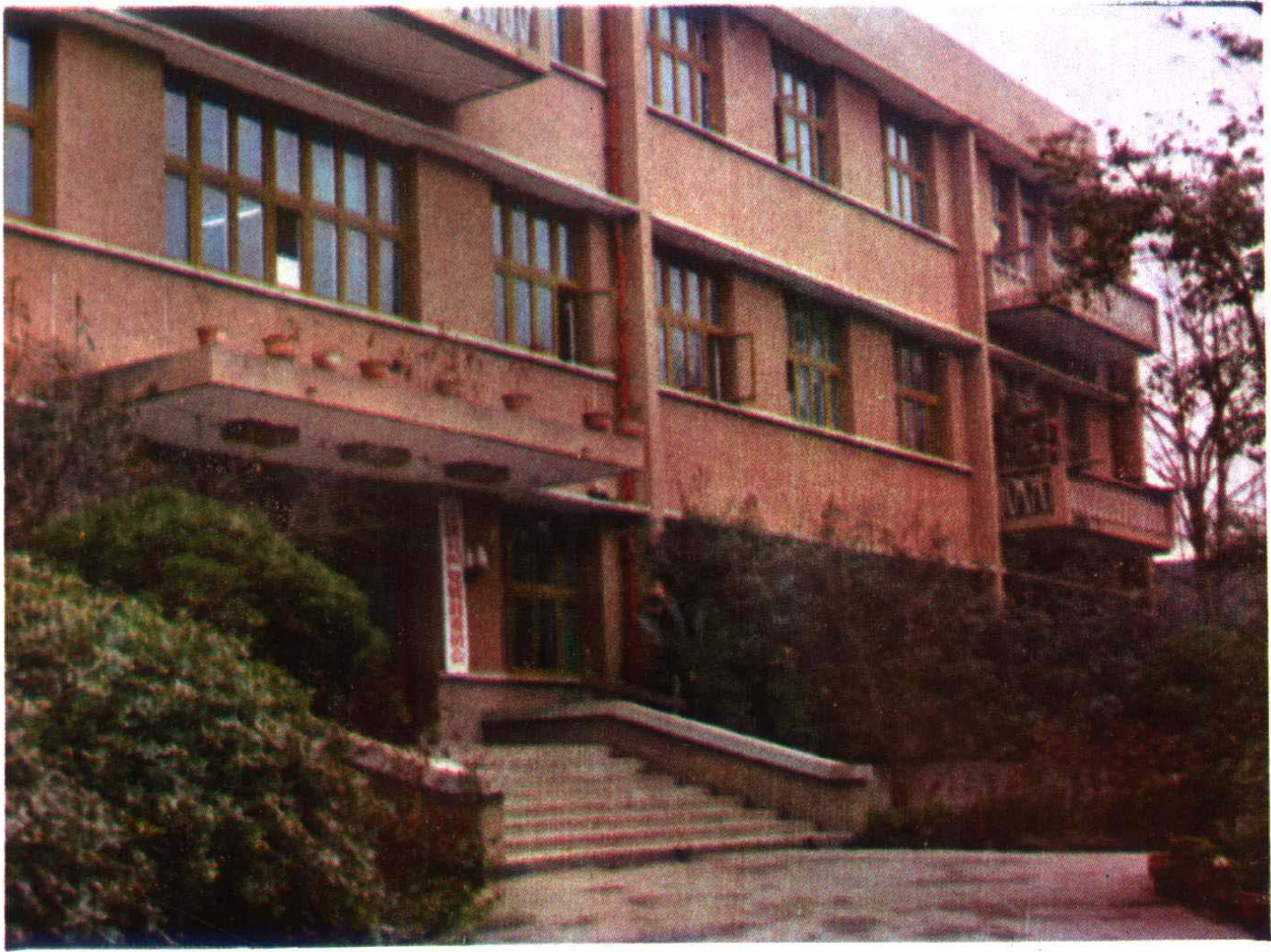
中共郟县县委办公大楼一角