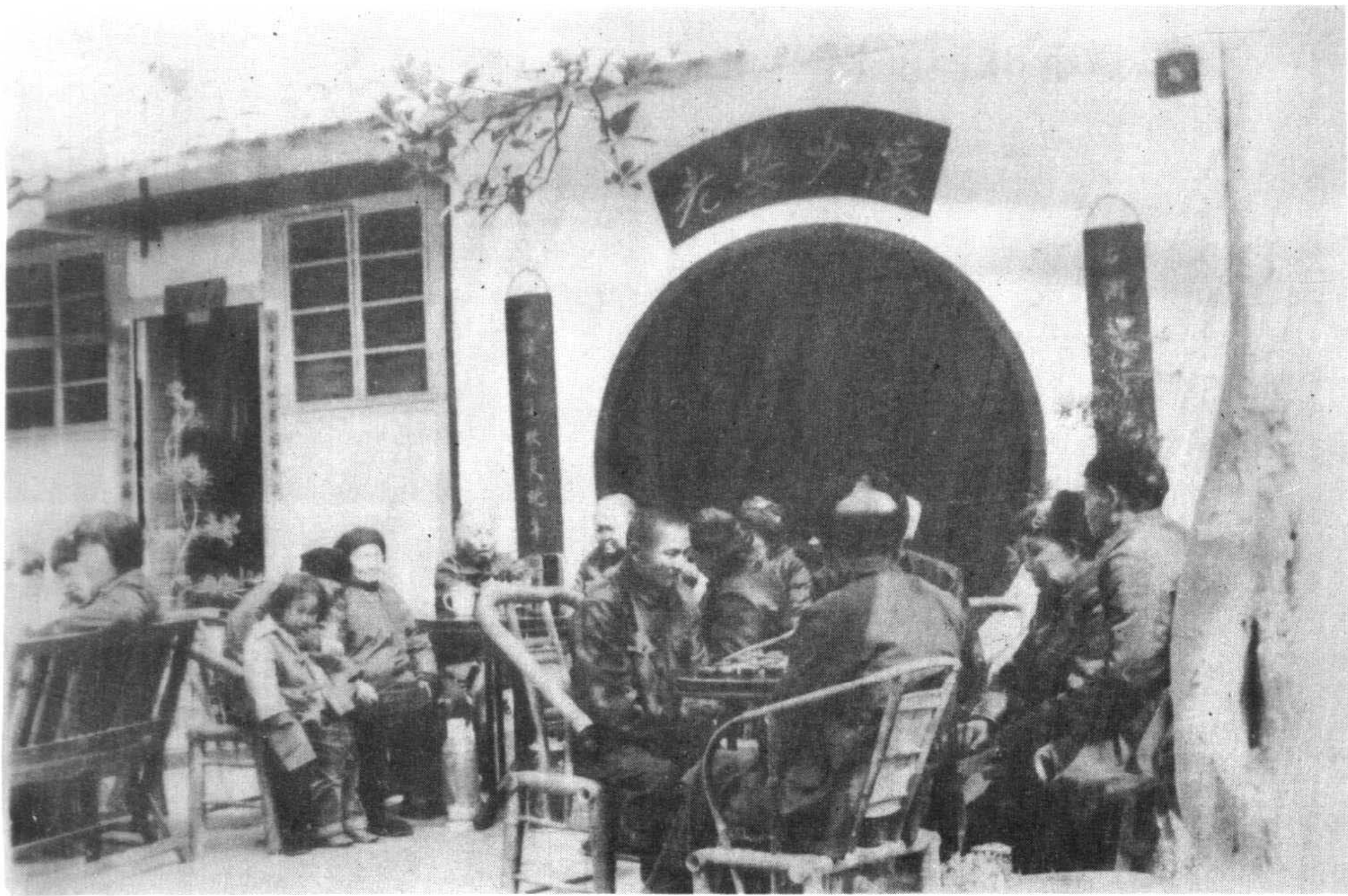
先锋公社敬老院老人欢度晚年情景。