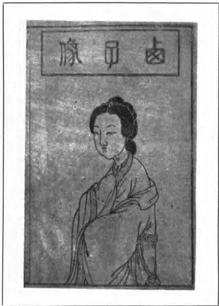
▲ 西施画像（原载〔明〕《苧萝西子志》）