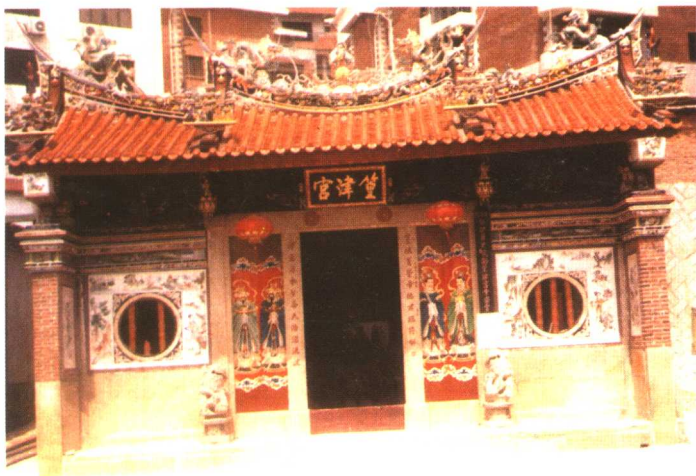
位于厦门市湖滨北路官浔村奉祀保生大帝的筮津宮，始建于明代