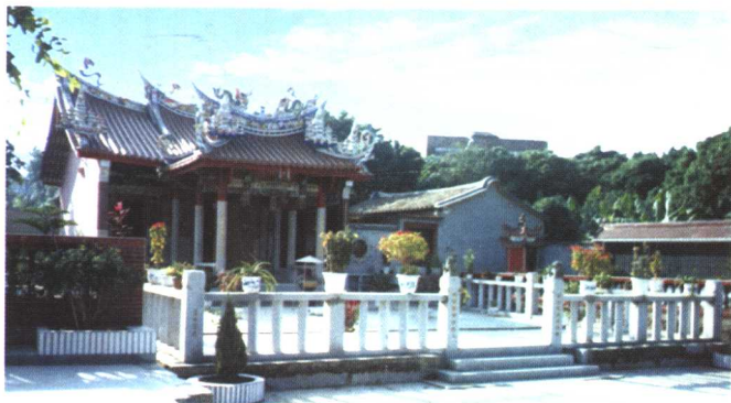
漳州市龍文區后店建溪宮