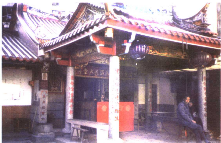
漳州市芗城区苍园苍吴宫