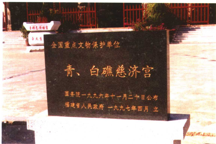
国务院一九九六年十一月二十日公布青、白礁慈济宫为全国重点文物保护单位，图为文物保护单位标志。