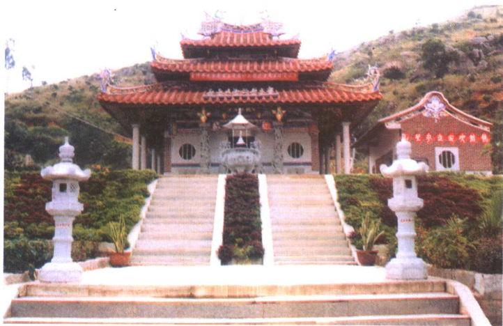
龙湫庵，位于厦门市海沧的东鸣岭之下