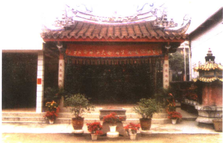
漳州市芗城区市尾石虎宫