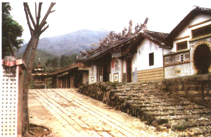
位于漳州市平和县的心田宮，是从青礁慈济东宫分灵的庙宇，清乾隆年间又分灵台湾的元保宮