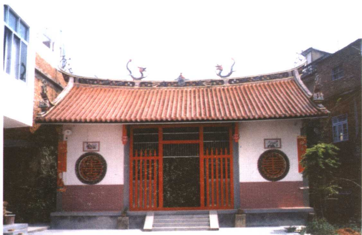
漳州市平和县东明宫