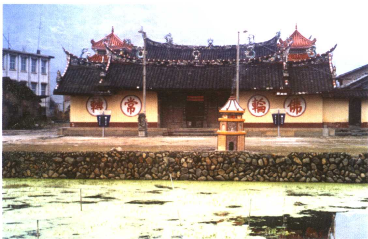
漳州市平和县崎岭乡南湖村天湖堂