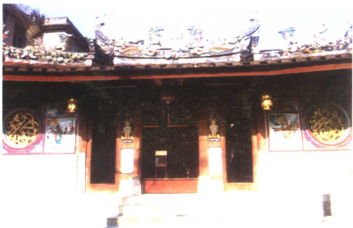
漳州市芗城区西街西湄宫（西清宫）