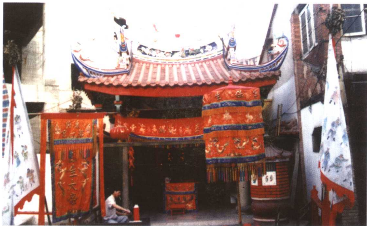
漳州市芗城区东吴第一宫