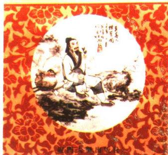
由台中市元保宫资助出版的《吴真人药签与中草药研究》，封面为《吴真人采药图》