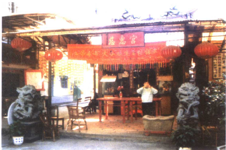
漳州市芗城区宝珠园慈惠宫