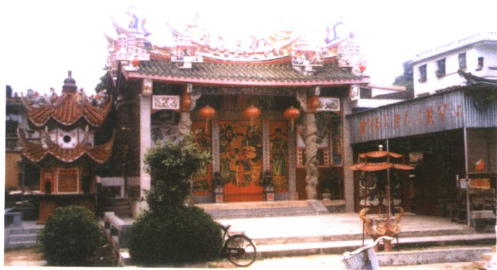
漳州市长泰县武安镇慈济宫