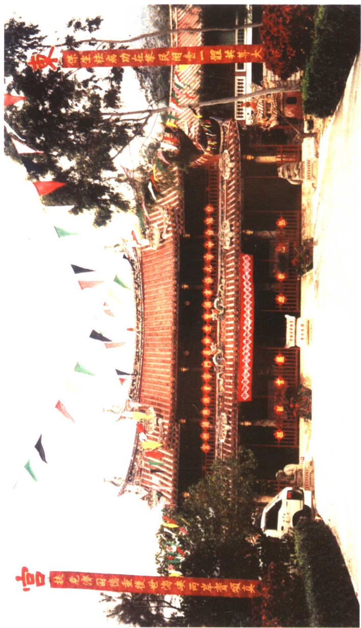
青礁慈济宫（东宫），位于厦门市海沧的东鸣岭之麓，始建于南宋绍兴二十一年（1151年）