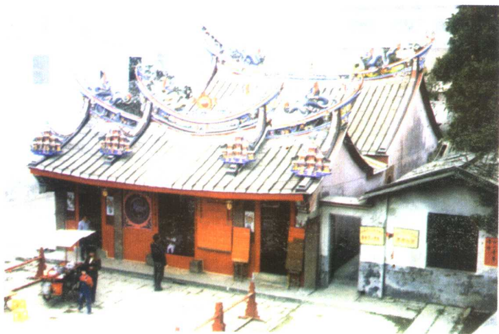
漳州市芗城区诗浦慈济宫