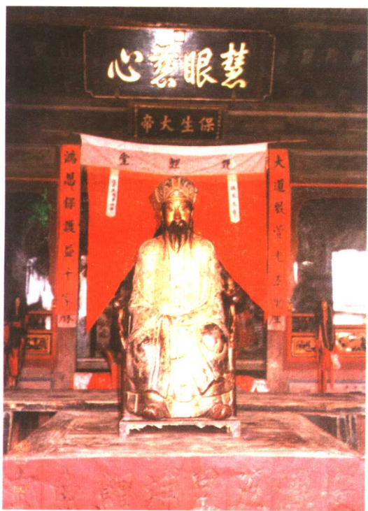
泉州市安溪縣五里埔鯉魚宮供奉的吳真人神像