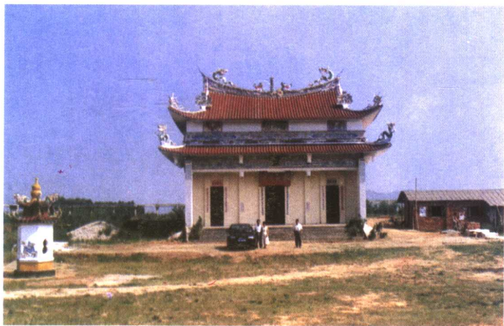
位于厦门市海沧温厝村的慈济北宫，始建于南宋绍兴二十七年