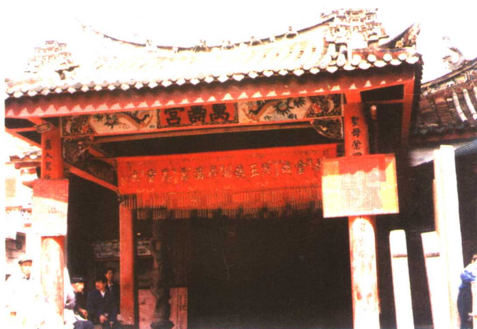
厦门市湖里区高崎村奉祀保生大帝的万寿宮始建于元代，已有700年历史