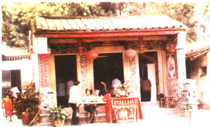
鼓浪屿内厝澳奉祀吴真人的种德宫建自明代