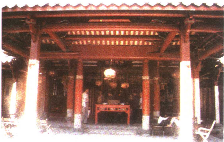
位于泉州法石，供奉吴真人的大道公宫