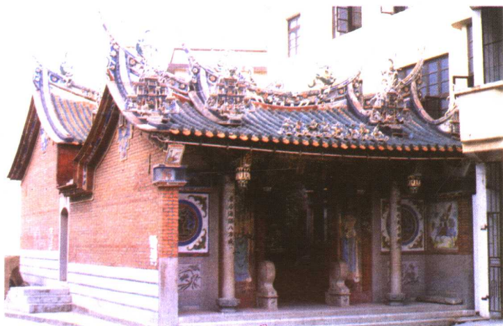
位于厦门市湖里工业区的凤和宫