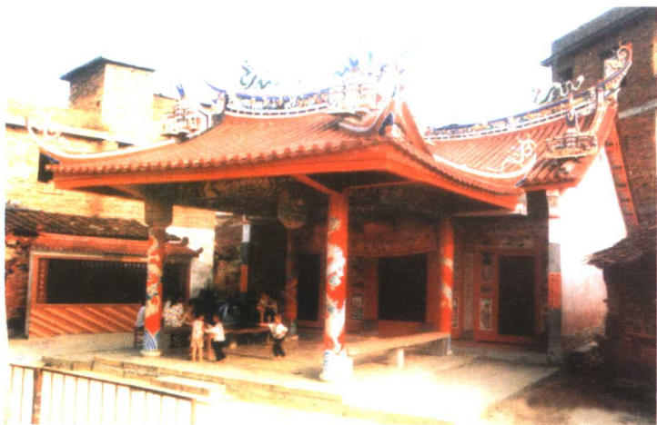
漳州市芗城区坑头慈济宫