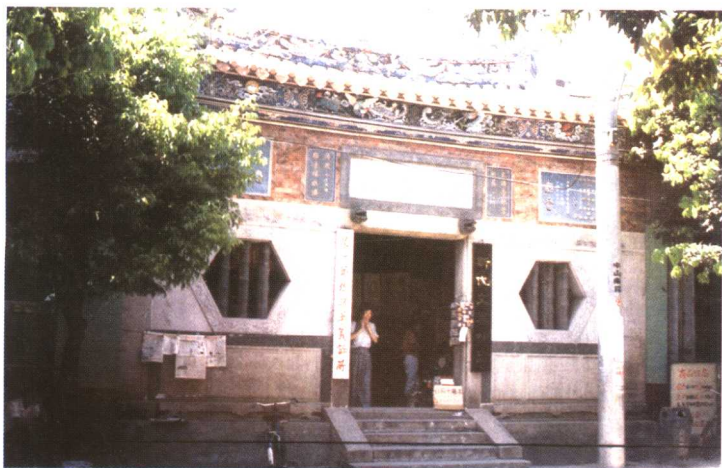
泉州花桥慈济宫，奉祀吴真人，明张瑞图题额“真人所居”。素以赠药义诊著称