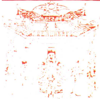
厦门吴真人研究会和青礁慈济宫东宫董事会编印的《吴真人研究》论文集