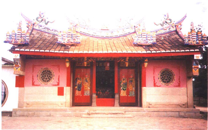
漳州市龙文区步文镇石仓永兴堂