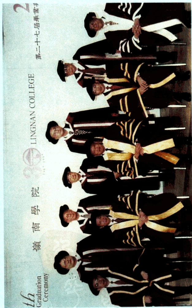
香港特別行政區長官董建華先生(前排中)于1997年11月27日向黃浩川先生(後排中)等頒發嶺南學院榮譽法學博士銜後合影。