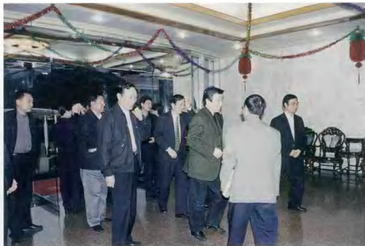
省委代书记卢展工考察我市新城市中心区规划建设工作