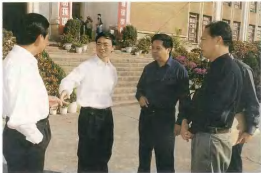
分管领导陈谈生副市长关心规划方案展示工作