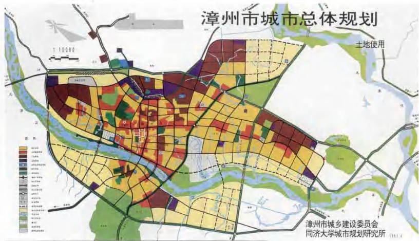
20世纪90年代漳州市总体规划图