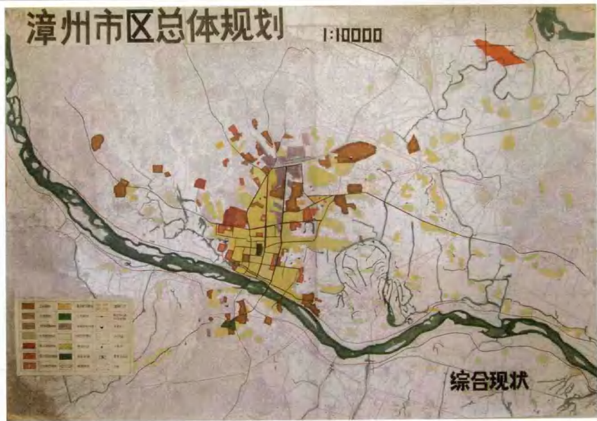
20世纪80年代漳州市总体规划图