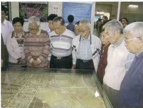
市人大代表、政协委员参观我市新行政中心区规划方案展示