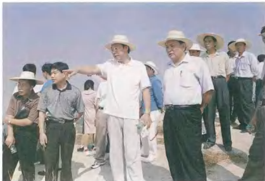
省委常委、原市委书记郑立中到云洞岩风景区现场办公