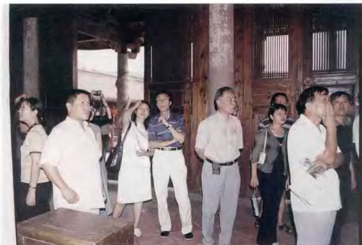
国家历史文化名城学术委员会主任委员王景慧亲临我市指导工作