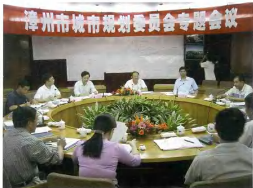
市委、市政府主要领导主持召开的市城市规划委员会召开专题会议