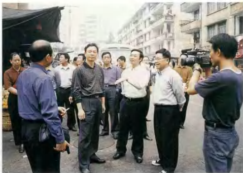
市长何锦龙深入市区考察城市规划建设工作