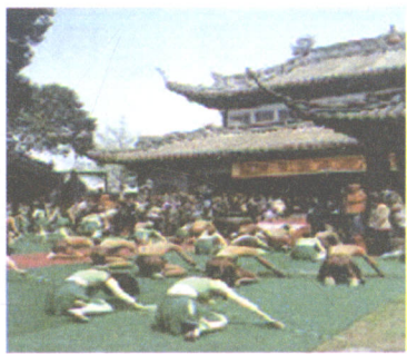
绍兴公祭大禹组图