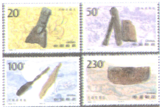
河姆渡遗址出土的文物

1984年，在今绍兴县马鞍乡寺桥村凤凰墩，出土了一批石刀、石钺(yuè)、石耜等生产工具，还有制作比较精美的陶罐、陶盆、陶盘等生活用具。据专家考证，这些器具制作于4000多年前。1985年在马鞍乡寺桥村仙人山西南坡，又出土了一批石器生产工具和陶鼎、陶盆，这些文物至今已经有5000余年历史。2004年底，在绍兴县