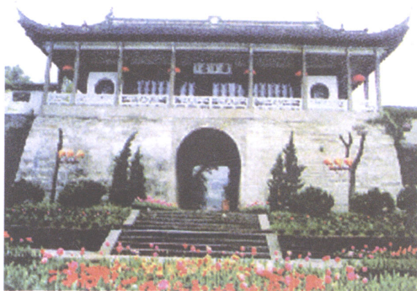
巍峨庄严的越王台

由于战争的需要，公元前490年，越国大夫范蠡受命兴建越国都城。范蠡先选择在种山(今绍兴市区府山)东南麓兴建“句践小城”。小城“周二里二百二十三步”，设