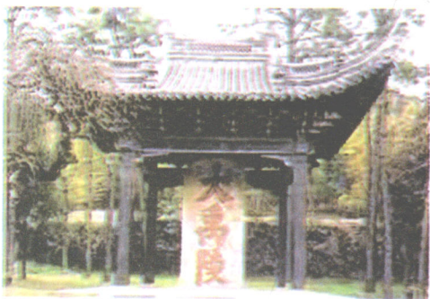
全国重点文物保护单位——大禹陵

传说尧任部落联盟酋长时，天下曾经洪水肆虐。禹的父亲鲧(gǔn)接受尧的命令负责治理洪水，历时九年而水患不息，鲧因此被舜所杀。舜命令禹继续治水，禹吸取了父亲鲧“堵塞”之法治水失败的教训，采用“疏导”的方法，引导全国主要河流流入大海，历时十三年，终于治平了洪水，救民于倒悬。