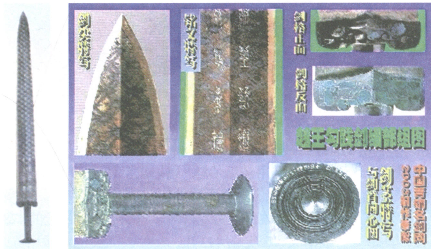
国宝越王句践剑及细部组图