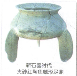
新石器时代·夹砂红陶鱼鳍形足鼎