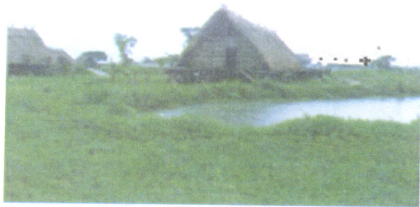
绍兴先民生活环境想象图

远古绍兴,降水量充足,气候温暖而湿润,非常适合多种动植物的生长。南部丘陵地区,森林茂密,古木参天,林荫蔽日,是野牛、野猪、野兔等多种野生动物的乐园。北部水网地带,沼泽遍布,河流湖泊纵横交错,鱼类资源十分丰富。中部河谷盆地和北部绍虞平原,土质疏松、肥沃,有利于发展种植业。