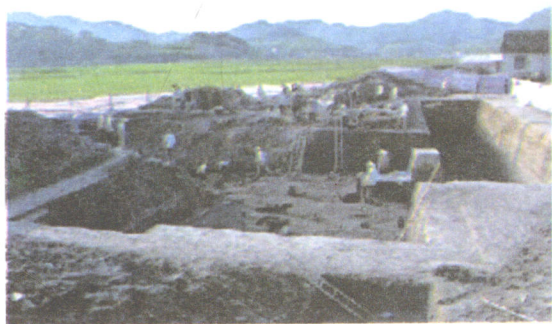
河姆渡遗址发掘现场

1973年夏，浙江余姚河姆渡村的农民在村东北修建排涝站时，偶然地发现了河姆渡遗址，引起了当时考古界的震动。在4万余平方米的河姆渡遗址发掘现场，共出土文物6700余件，据考证，这批文物已有7000余年的历史。河姆渡遗址中发现了世界上最早的栽培水稻，还有代表性农具骨耜。河姆渡遗址出土的文物还表明，河姆渡先民已开始纺纱织布，驾驭舟楫，会运用成熟的榫卯技术建造干栏式木结构房屋。河姆渡遗址还出土了大量的玉器、漆器等珍贵文物。