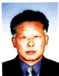
付西方，尉氏 县人民政府正县长 级干部；河南省书 法家协会会员。