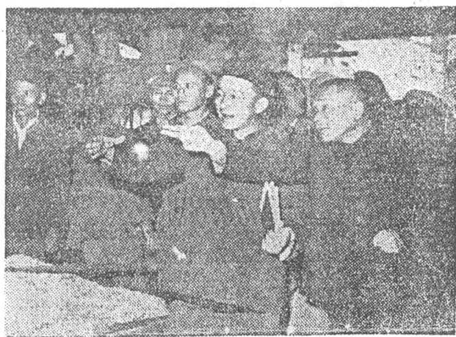
邓小平同志视察东北