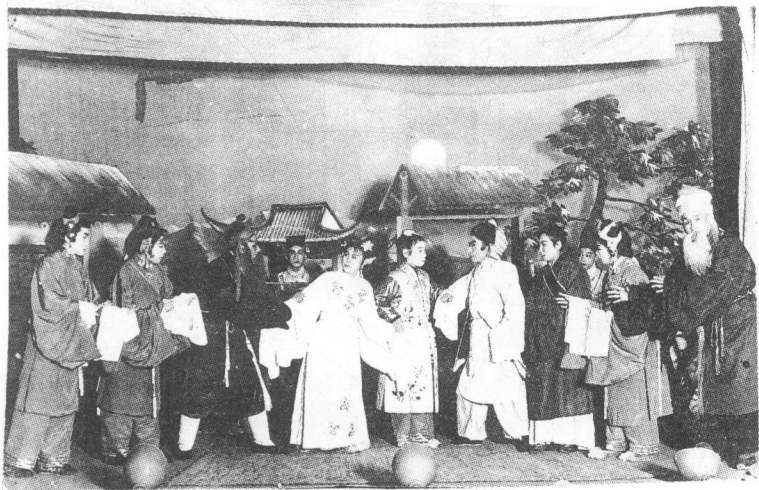
艺新评剧团上演剧目《火里桃花》