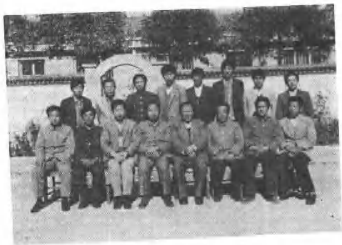
第一次、第二次青运史工作座谈会与会人员合影