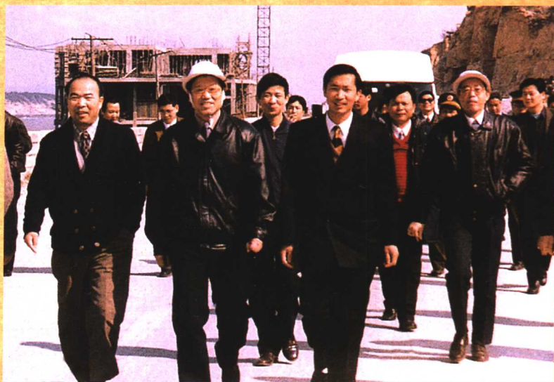
● 1995年2月，原中共中央政治局委员、国务委员、现任全国人大常委会副委员长李铁映（前排左二）视察湄洲妈祖祖庙。