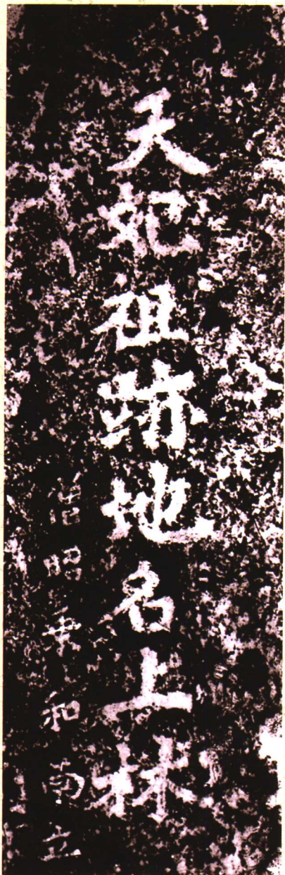
● 湄洲岛上“天妃祖迹 地名上林”碑刻