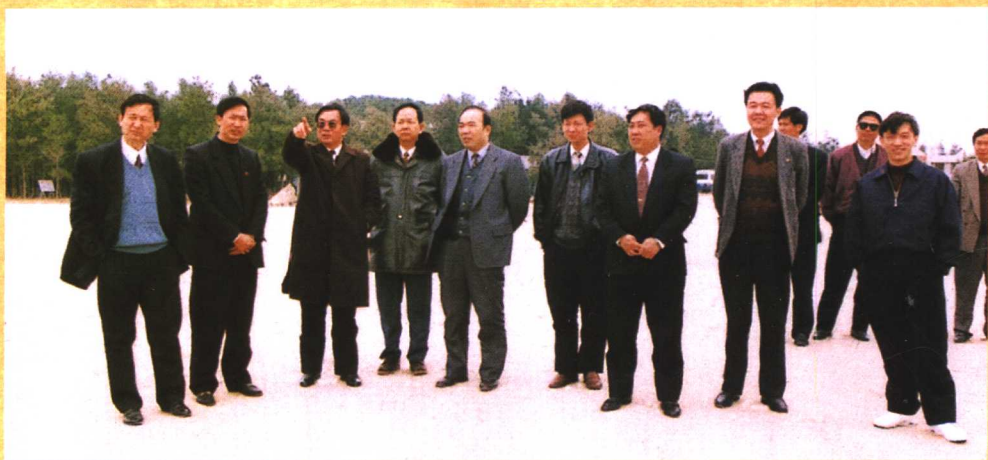
● 1997年3月，原福建省省长、现任中共中央政治局委员、中组部部长贺国强（左三）视察湄洲妈祖祖庙。