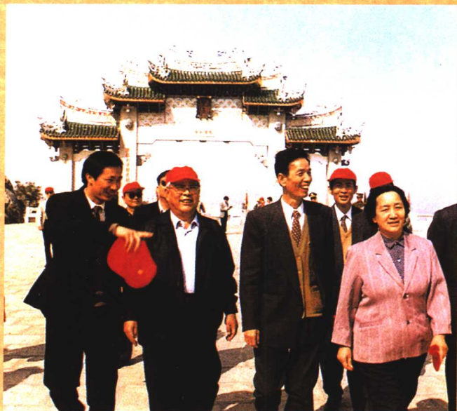
● 1994年4月，原全国人大常委会副委员长李锡铭（左二）视察湄洲妈祖祖庙。