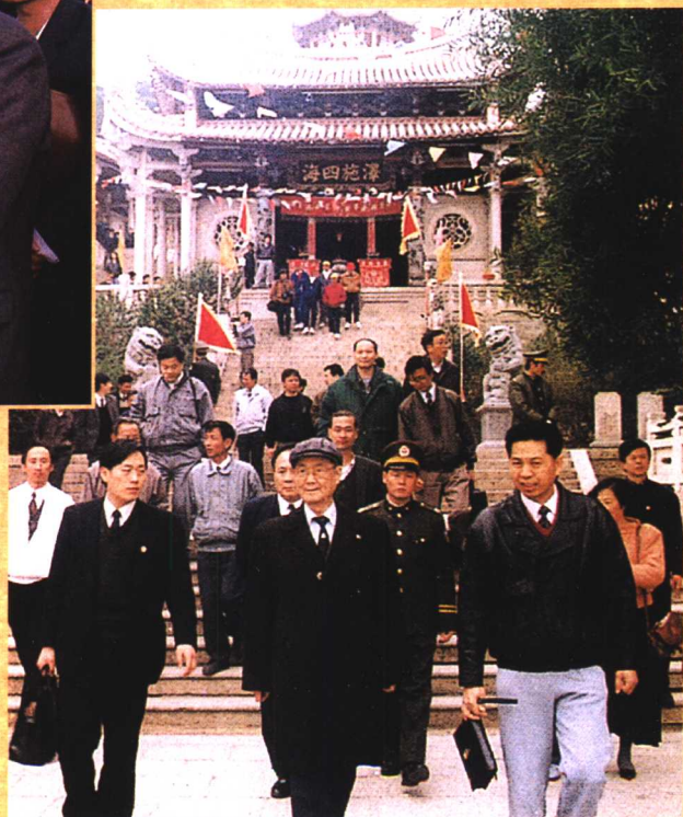
● 1993年3月，原中共中央政治局常委宋平（中）考察湄洲妈祖祖庙。