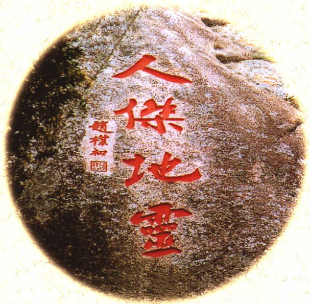
● 赵朴初的题刻“人杰地灵”