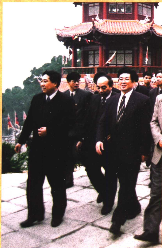
● 1995年12月，原全国政协副主席、现任全国人大常委会副委员长王兆国（右一）视察湄洲妈祖祖庙。