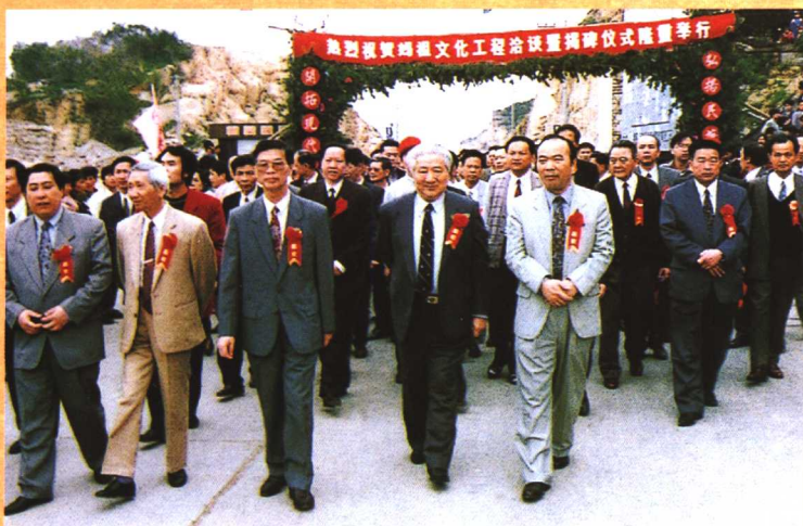
● 1996年5月，全国政协副主席丁光训（前排左四）视察湄洲妈祖祖庙。