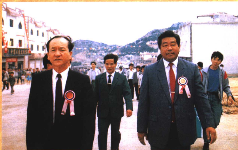
● 1991年10月，原福建省省长、现任中共中央政治局常委、全国政协主席贾庆林（右）、原中共福建省委书记陈光毅（左）考察湄洲妈祖祖庙。