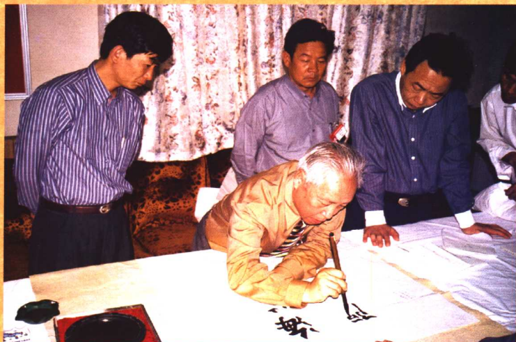
● 1998年11月，原全国政协副主席杨汝岱（左二）视察湄洲妈祖祖庙。