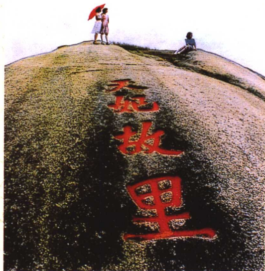
● 湄洲岛上“天妃故里”石刻

和五年(1123)路允迪出使高丽(朝鲜)途中,船遇大风巨浪,“八舟七溺”,唯有路允迪“祈求妈祖保佑”,忽而一道红光出现,只见有一朱衣女子端坐桅间,瞬即风平浪静,终于平安脱险。路允迪返朝后奏明圣上,宋徽宗下诏赐“顺济”匾额。此后,历史上有众多人士受到妈祖的庇佑,留下许多故事。历代皇帝对妈祖进行了30多次的褒封,其爵位从“夫人”、“妃”直至“天妃”、“天后”,并被人们尊称为“天上圣母”。同时,皇帝还颁诏天下行“春秋谕祭”,编入国家祀典。