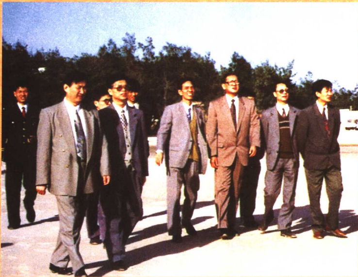
● 1995年11月，原全国人大常委会副委员长倪志福（右三）视察湄洲妈祖祖庙。