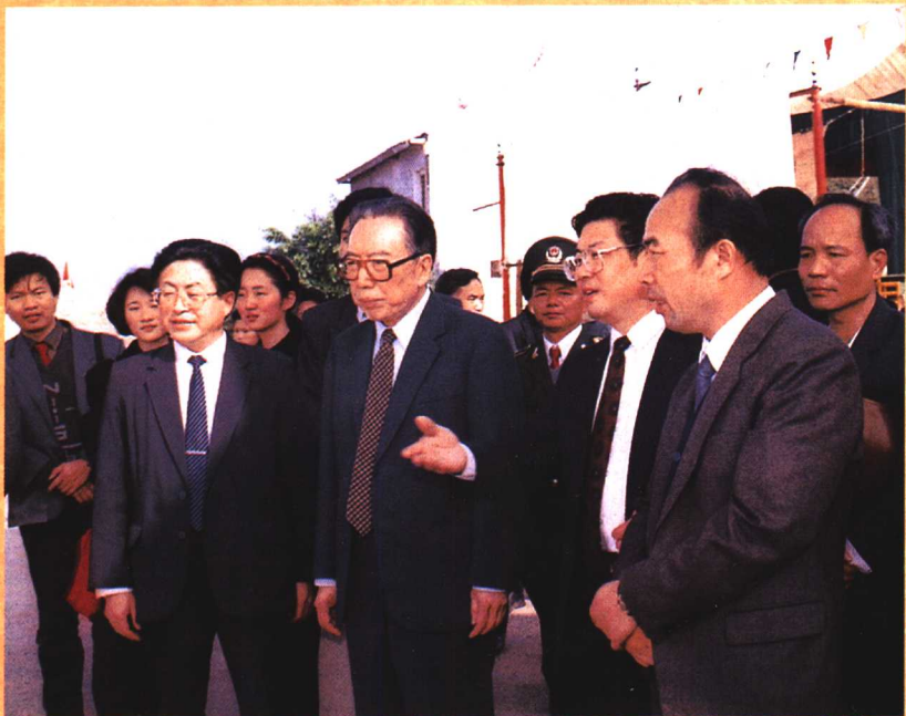
● 1992年，原中共中央政治局委员、国务院副总理吴学谦考察湄洲妈祖祖庙。