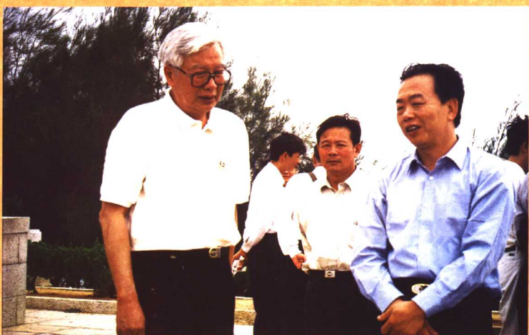
● 1998年11月，全国政协副主席罗豪才（左一）视察湄洲妈祖祖庙。