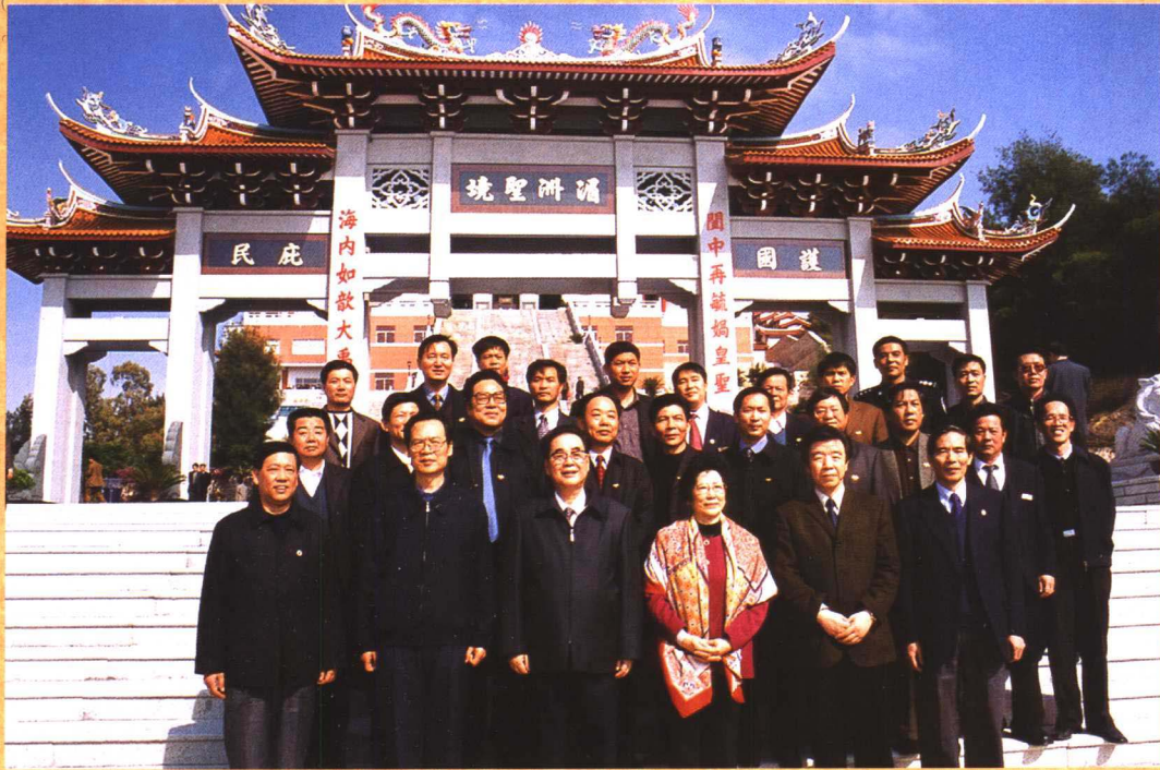
● 2002年12月14日，全国人大常委会委员长李鹏偕夫人在福建省委书记宋德福、省长卢展工等领导陪同下到湄洲妈祖祖庙考察，并题词：“弘扬妈祖文化，秉承中华美德”。