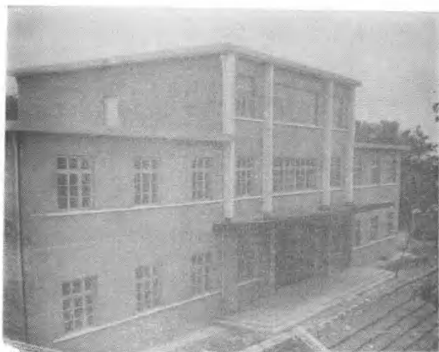
宁陵县妇幼保健所