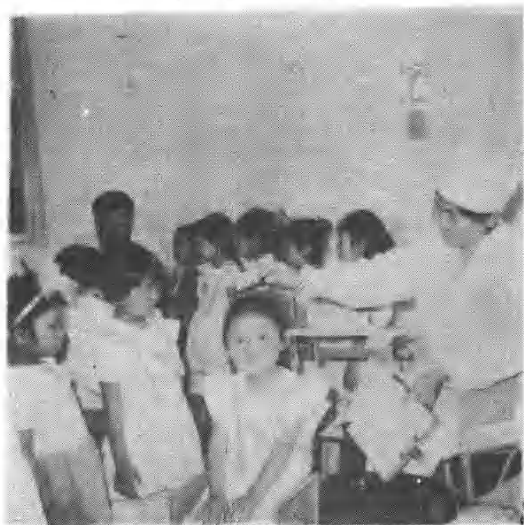
儿 童 健 康 检 查