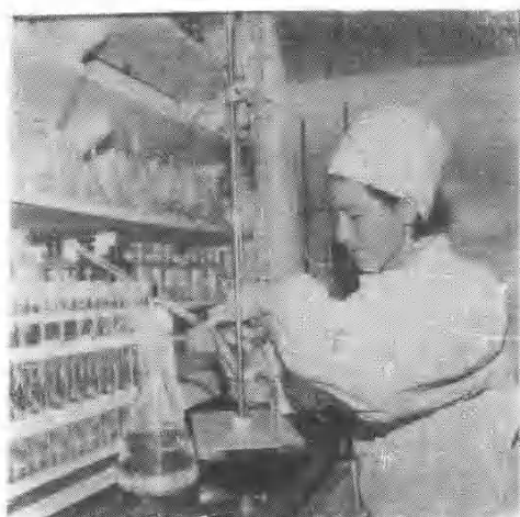
药 品 检 验