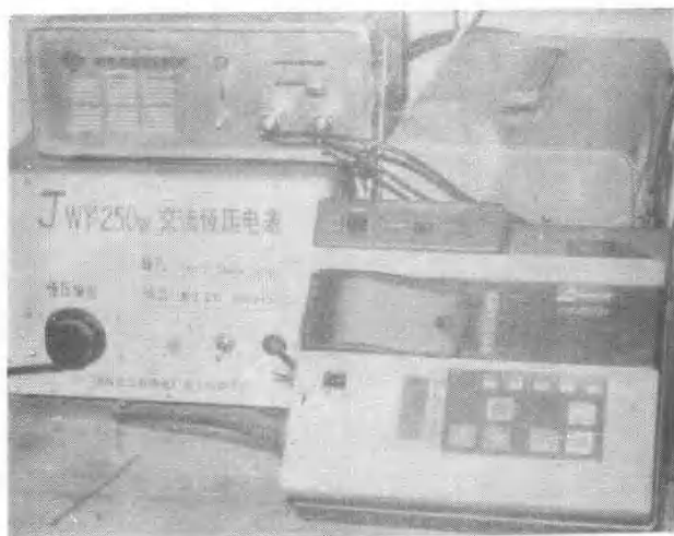
超声波多普勒诊断仪