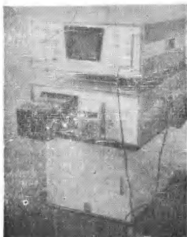
B 型 超 声 波 诊 断 仪