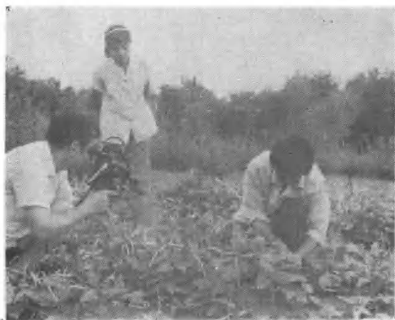
河南省电视台记者采访灭鼠工作