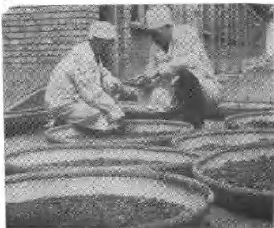
中 药 炮 制