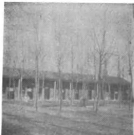
宁陵县药品检验所