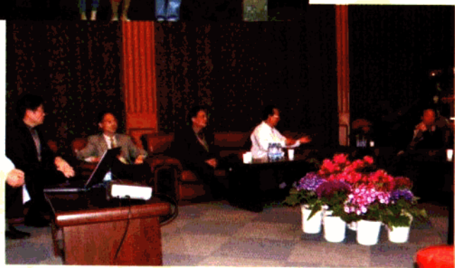
院领导向复旦领导汇报防非工作