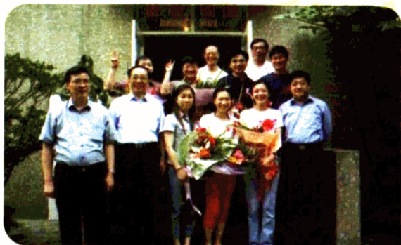
卫生局领导送医疗队进病房