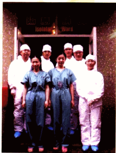
第二支医疗队全体队员