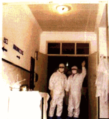
在隔离病房与大家挥手致意