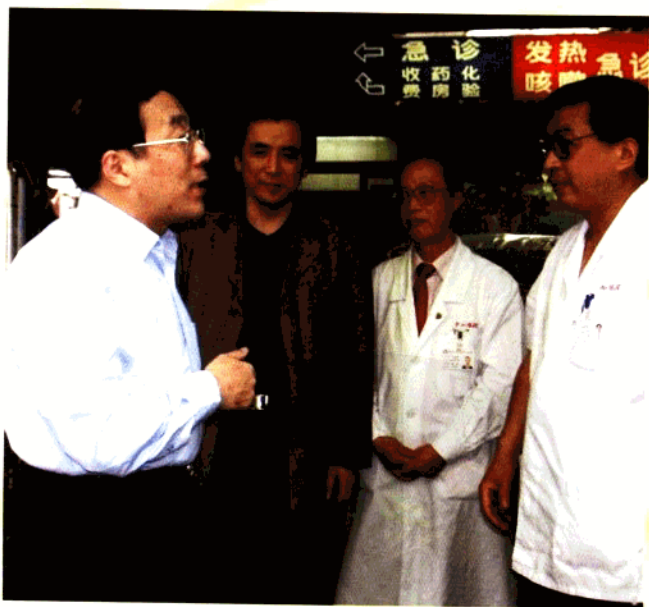
上海市副市长杨晓渡在急诊检查防非工作