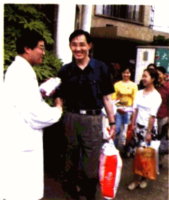
与传染病医院领导告别