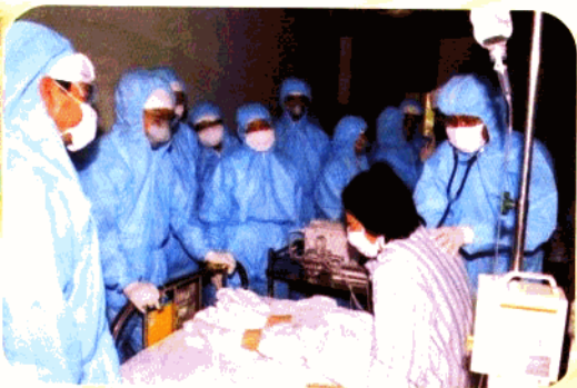
钮善福教授(右一)等专家会诊非典病人