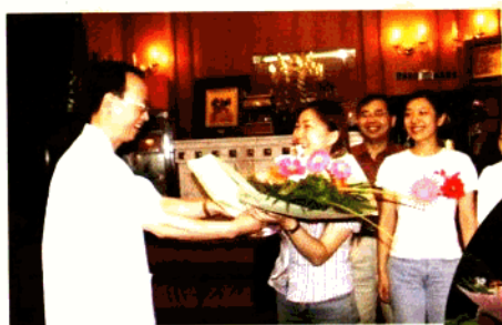
鲜花献给抗非英雄