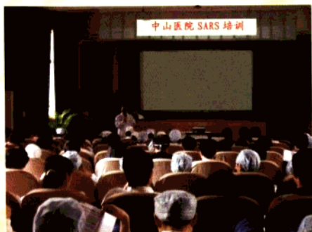
王国民副院长做SARS培训动员