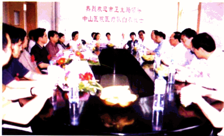
卫生局领导关心、鼓励中山医疗队