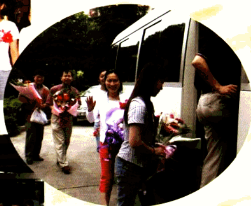
第二支医疗队整装待发， 奔赴传染病医院一线