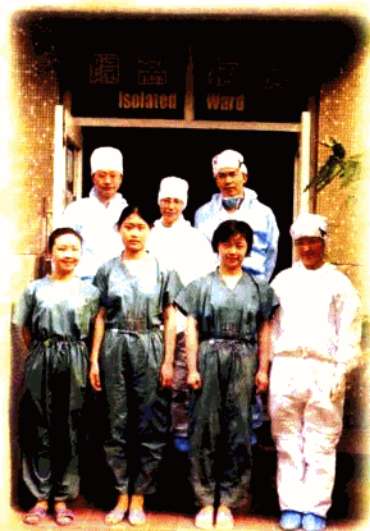
第一支医疗队队员