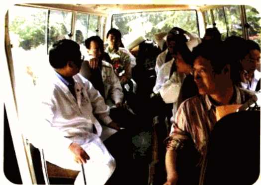
在传染病医院路上