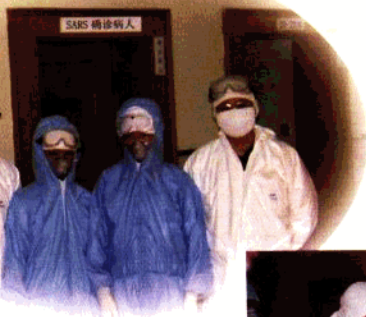
第一支医疗队医生在隔离病区