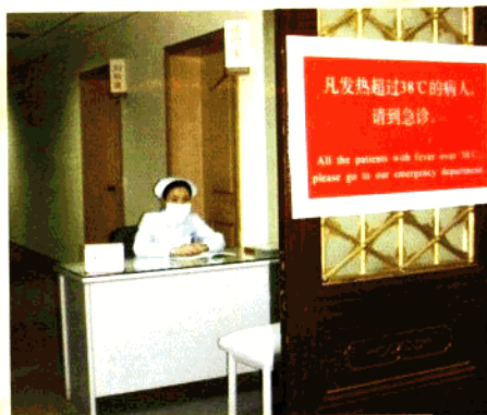
外宾发热预检门诊