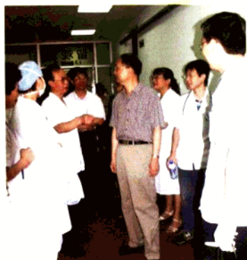
复旦副校长王卫平慰问急诊医护人员