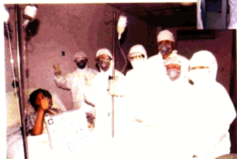
院领导看望医学观察队员