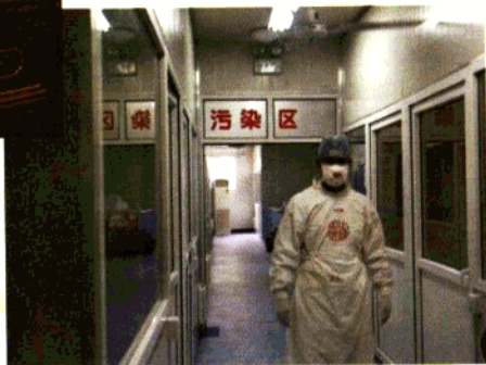
医务人员在重新修建的急诊发热观察室