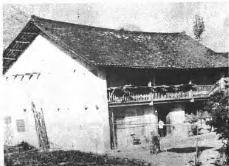
长阳县妇协旧址（长阳县妇联供稿）