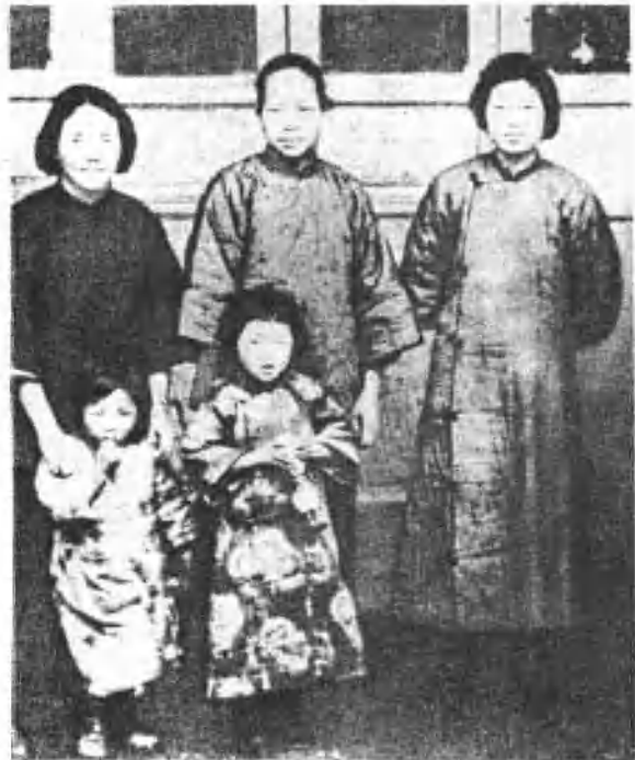
一九二七年四月 向警予同志在湖南长沙 与家人合影（后排左 第一人为向警予同志）