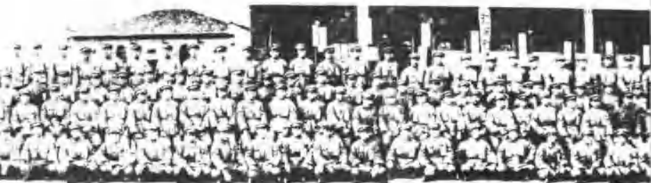
總隊政女大生全體攝影

1925年至1927年武汉市妇协、湖北省妇协编 印的机关刊物《武汉妇女》、《湖北妇女》。