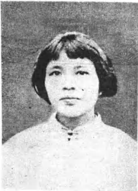
一九二四年向警予同志在上海