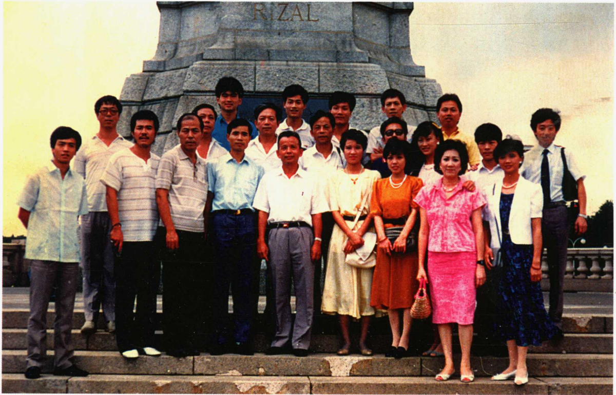
福建省副省长叶双瑜（前排左四）长期以来非常关心晋江木偶剧团的发展。1987年率剧团访问菲律宾演出时与全团演职员合影于马尼拉黎刹公园广场。