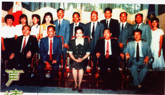
1990年，我因时任团长苏统谋（后中）、演员陈丽娟（后左四）随福建南音代表团访菲，受到阿基诺总统（前排中）的亲切接见。

艺术上高度的综合性、兼容性，这是《五里长虹》突出的优点，所以我称之为“兼具众美”的佳作。