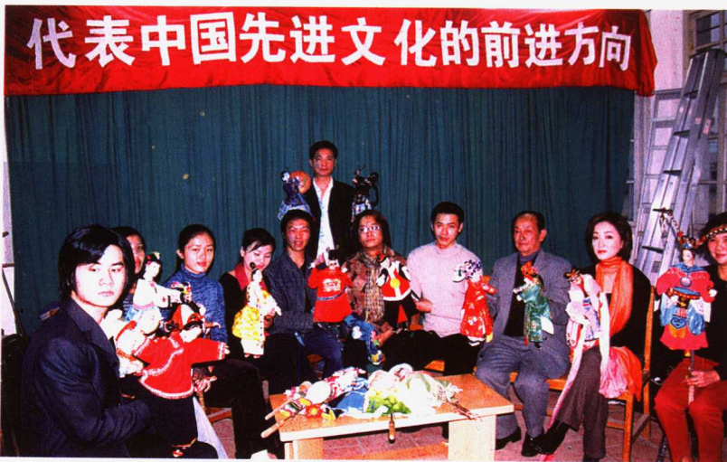
晋江木偶剧团接受中央电视台采访