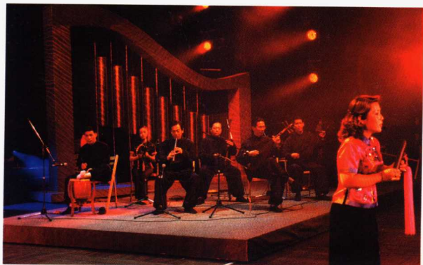
参加2001年“上海之春”国际音乐节

难能可贵的是，晋江市掌中木偶剧团的艺术家们坚持开拓创新，不断打造精品。最近又推出一部立意新颖、制作精美、技艺精湛、偶趣鲜明、观赏性强的大型神话剧《清源仙女》，参加在广州举行的“金狮奖”全国木偶皮影戏比赛盛会。该剧在剧本故事情节、人物塑造、形象制作、特技运用、音乐舞美等方面都有新的突破与超越。深信这部独具魅力的剧目，定然能为偶坛添彩增辉！