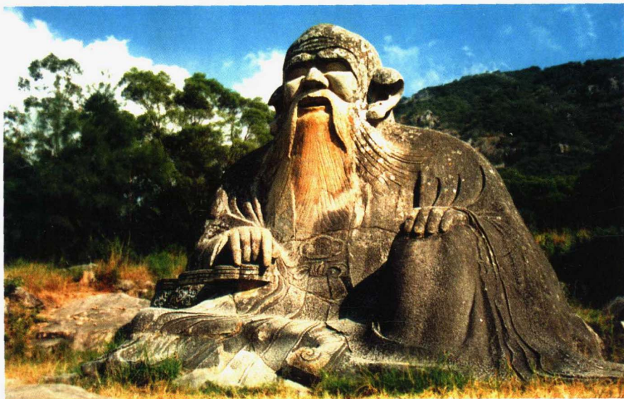
老君岩老子石雕道像（宋代）