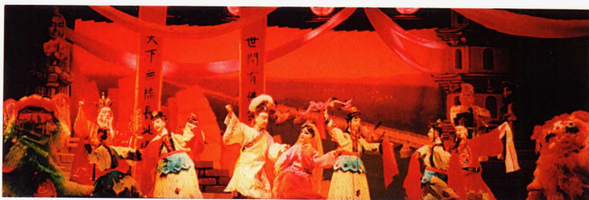
荣获文化部第九届文华奖《五里长虹》剧照

《五里长虹》排演开始了。剧团上下和外聘人员，铆足劲，精心磨砺整合，争取早日把《五里长虹》推出去。天热，青年男演员穿着短裤衩，赤膊上阵；年轻女演员轻装短裙，配着脖子上的一条毛巾。下大雨了，戏棚顶上渐渐下起小雨，顶起塑