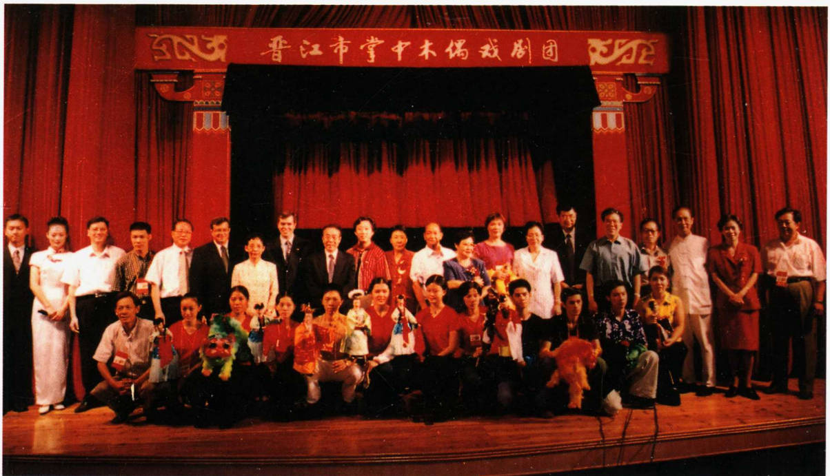
福建省政协副主席刘金美(后排中)、中共泉州市委书记施永康(后排左九)、泉州市人大主任薛祖亮(后排左五)、泉州市政协主席傅圆圆(后排右七)与福建省文化厅巡视员庄晏成(后排右四)、中共泉州市委常委、宣传部长黄少萍(后排右二)、著名歌唱家郭兰英(后排右九)等观看晋江木偶剧团演出后与全体演职员合影。