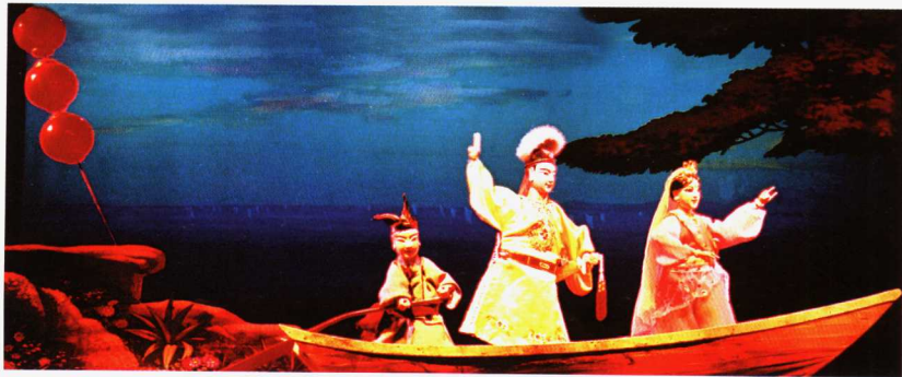
荣获文化部第九届文华奖《五里长虹》剧照

时过10多年后，晋江市掌中木偶戏剧团又精心创作、排演了大型木偶神话剧《五里长虹》，作为向省、市戏剧汇演献演的剧目，观后深感赏心悦目，