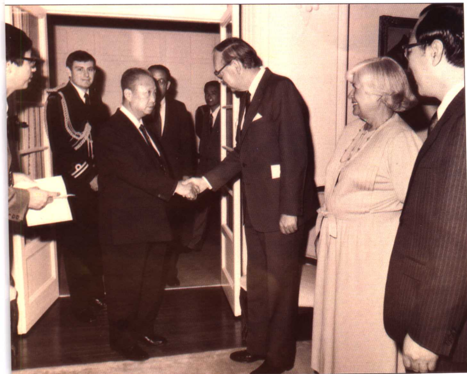
1992年访问澳大利亚期间，受到澳大利亚总理接见。