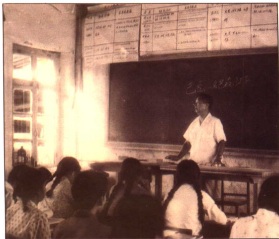
70年代初，在6.26医疗队时，为当地学生讲授中药学。