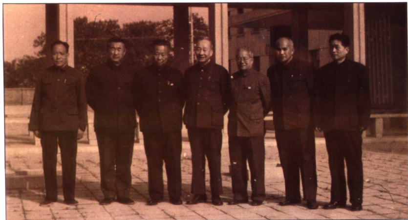
1982年南京教材会议期间，刘渡舟与任应秋、邓铁涛等专家在一起。