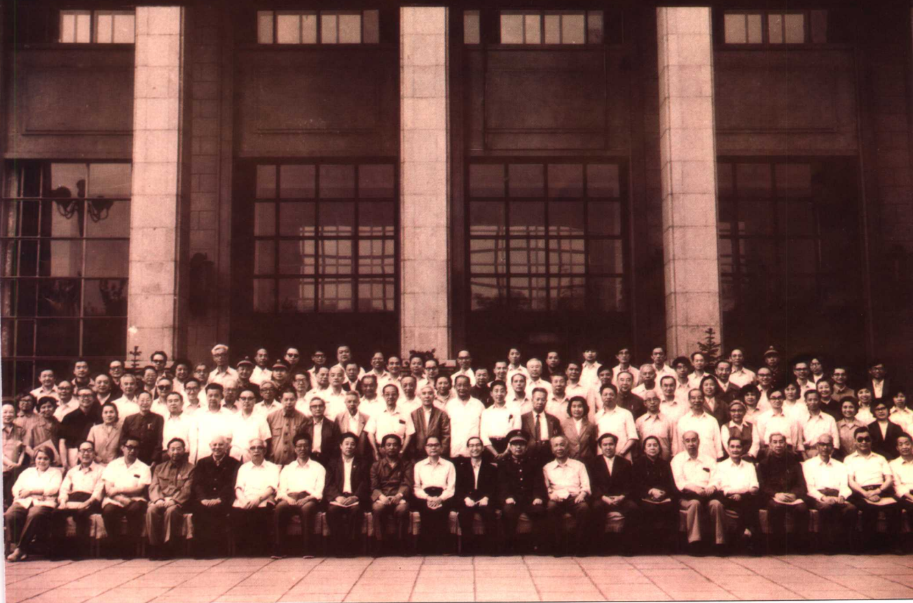
国务院学位委员会学科评议组第三次会议 医学门类评议组成员分组会议合影（1986）

国务院学位委员会学科评议组第三次会议 医学门类评议分组会议合影 1986年5月23日 北京