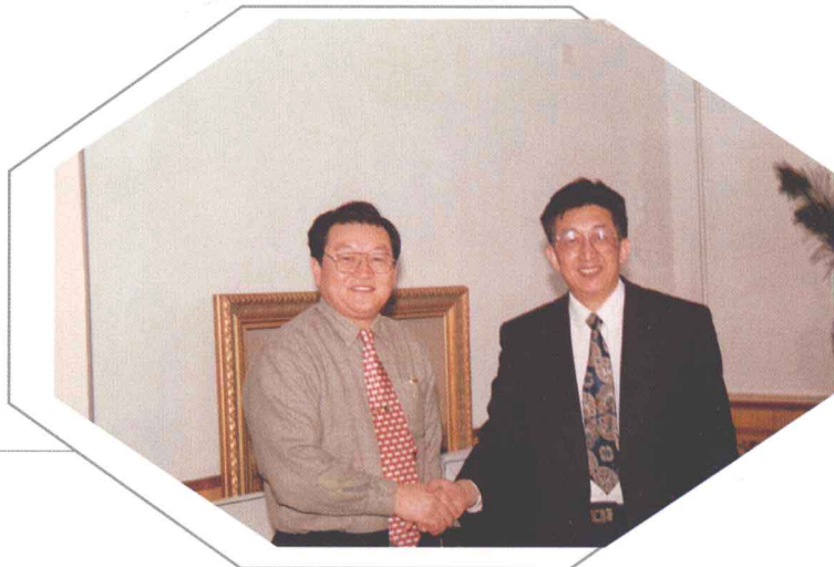
1998年，张涛主委为李长春书记赴广东工作送行并留影。