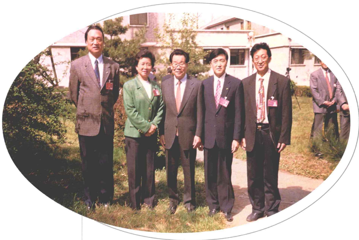
1998年4月，张涛主委与中共中央政治局常委、全国政协主席李瑞环在中共中央党校合影。