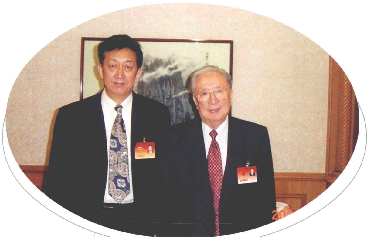
2002年3月14日，在全国两会期间，张涛主委与全国人大常委会副委员长、九三学社中央主席吴阶平合影。