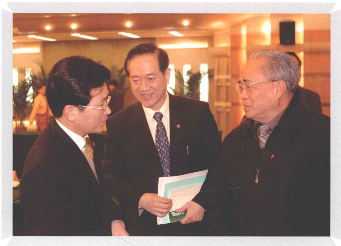
2004年3月26日，在“九漯合作”仪式之后，韩启德主席、洪 绂曾副主席与九三学社漯河市委主委孙运锋亲切交谈。