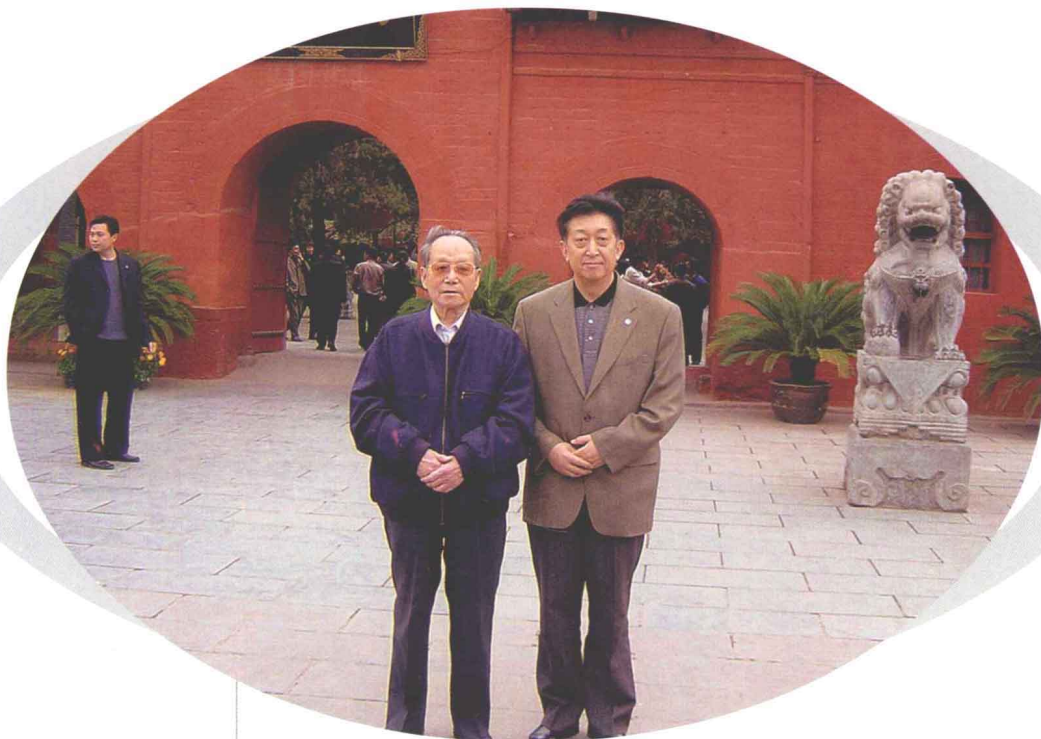
2004年4月18日，张涛主委陪同原中共中央书记处书记、 国务院副总理、全国政协副主席谷牧考察洛阳白马寺。