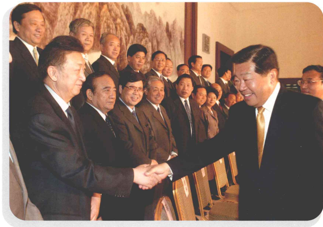
2004年，全国政协主席贾庆林到河南视察工作，在接见中共河南省委、省人大、省政府、省政协领导人时与张涛主委亲切握手。