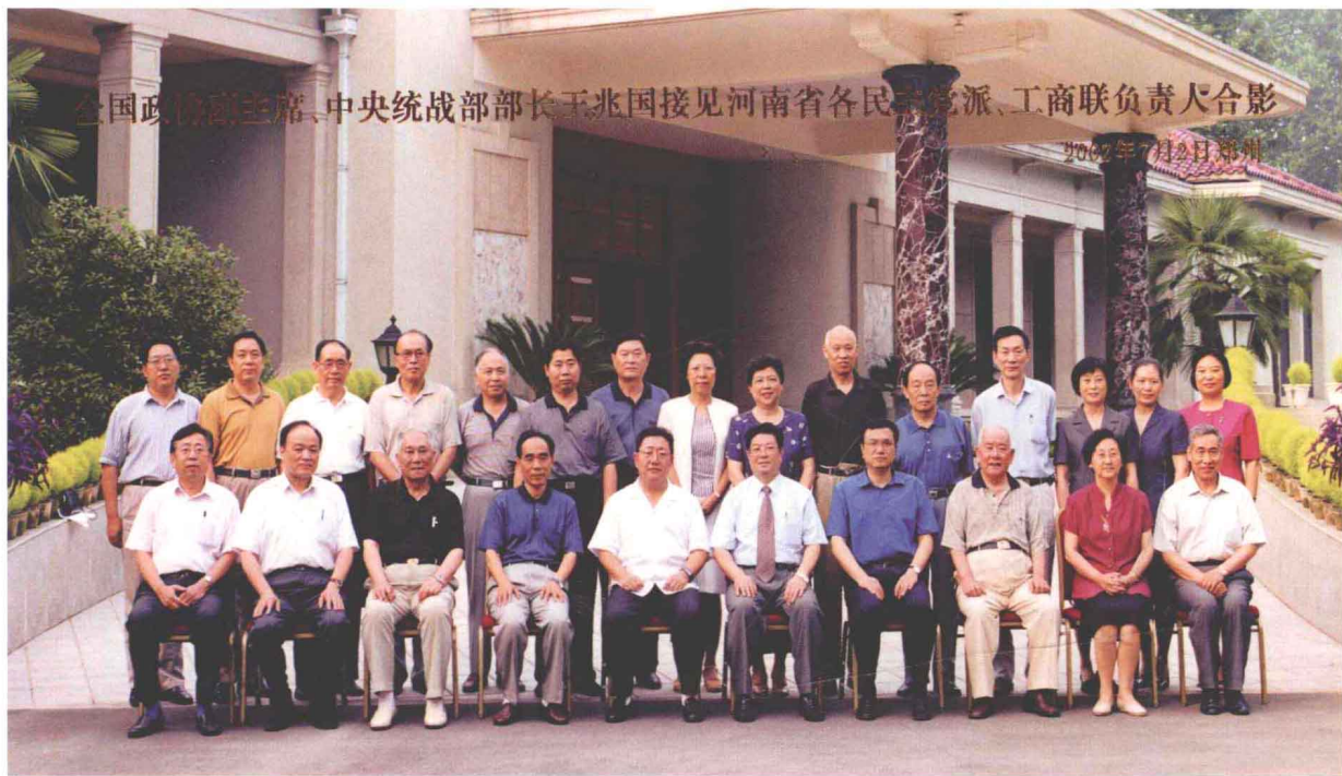
全国政协副主席、中央统战部部长王兆国接见河南省各民主党派、工商联负责人合影