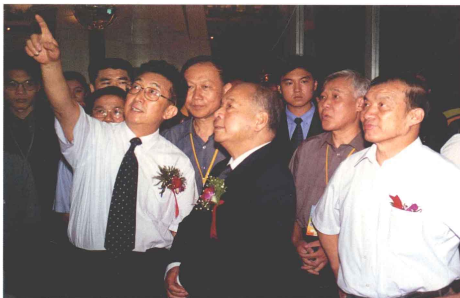
2001年6月21日，时任副省长的张涛主委赴京出席“国有企业改革与发展及技术创新成果展览会”，在河南馆向中共中央政治局常委尉健行介绍河南国有企业改革发展和技术创新情况。