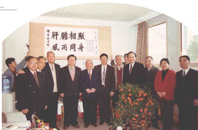
1998年，省委统战部及省各民主党派负责人与李长春书记合影（左六为张涛主委）。