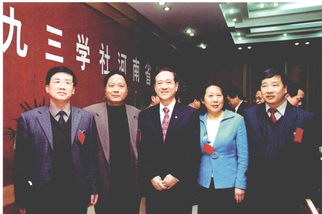
2005年3月24日，韩启德主席与九三学社郑州市委主委委会成员合影。