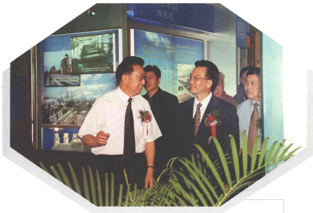
2001年6月21日，张涛主委赴京出席“国有企业改革与发展及技术创新成果展览会”，在河南馆向温家宝副总理介绍河南国有企业改革发展和技术创新情况。