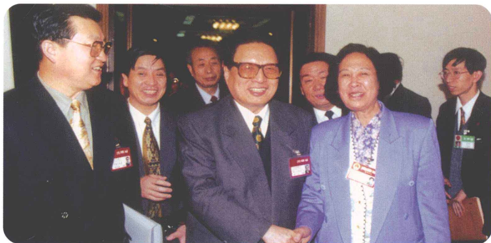
1997年3月，全国人大常委会委员长乔石（中）、河南省委书记李长春同志（左一）在全国人大会议期间与张瑞彰同志亲切交谈。