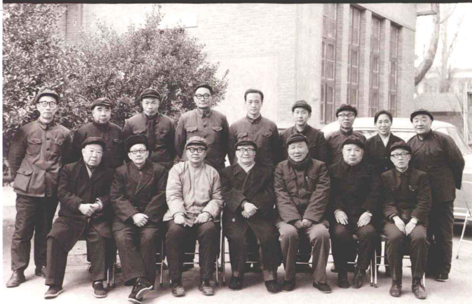
九三学社郑州分社社委会欢迎社中央茅村主席莅临指导郑州 8.12.10

1981年12月10日，九三学社中央副主席茅以升（前排中）莅郑指导工作，与九三学社郑州分社左明生（前排左三）等负责同志合影。