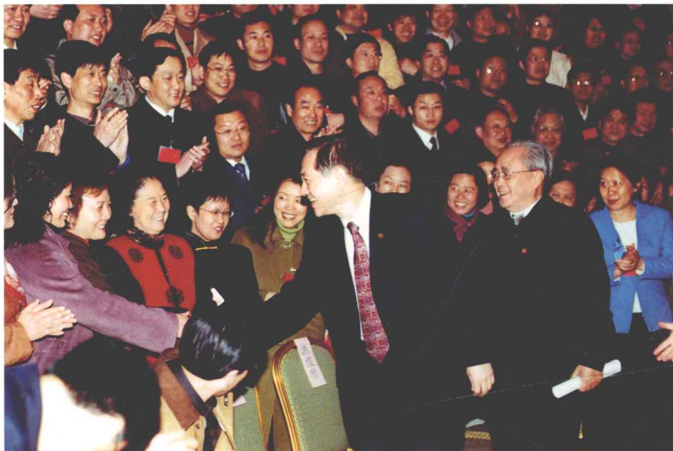
2005年3月24日，全国人大常委会副委员长、九三学社中央主席韩启德、副主席洪绂曾、贺铿来豫调研时，亲切接见我省社员。