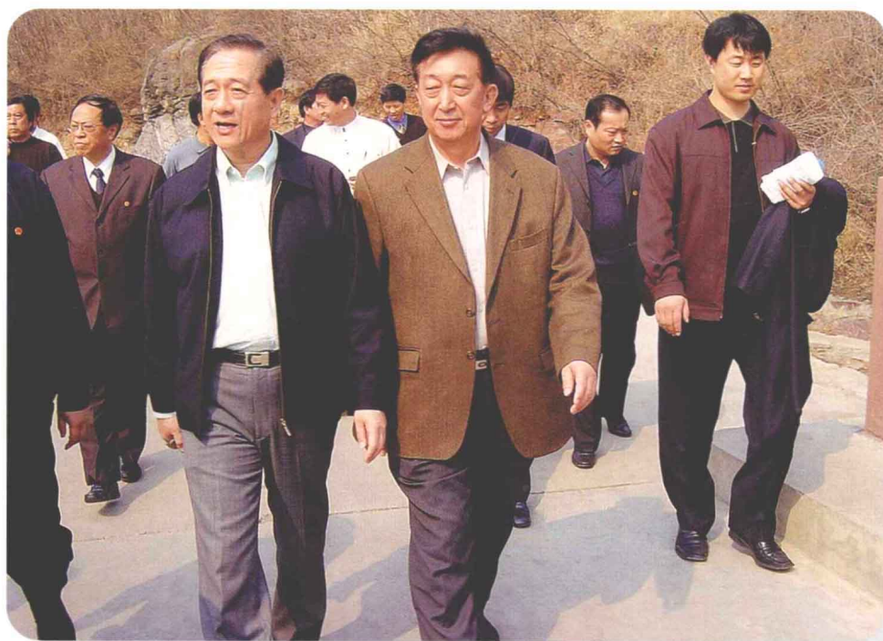
2004年3月28日，张涛主委陪同韩启德主席在焦作考察旅游产业时合影。