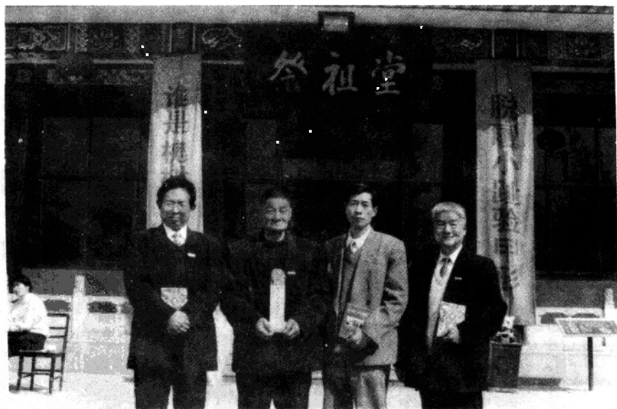
在山西洪洞县大槐树祭祖园,祭祖后在祭祖堂门前合影